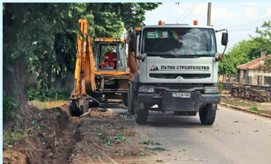
Подготовката за ремонтните дейности на пътя Василево - балканци вече започнаха.

С реализирането на дейностите се очаква да се подобрият транспортните връзки за населението от района със съседните общини.