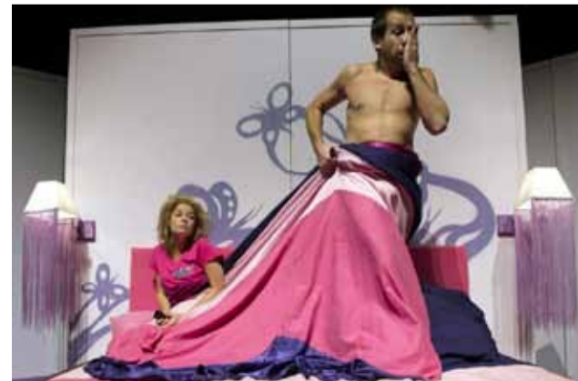
„На другата сутрин“ гарантира, че ще оправи и най-лошото настроение.

Билетите за постановката „На другата сутрин“ струват по 7 лева и вече са в продажба на касата на НЧ „Светлина - 1941“ в града.