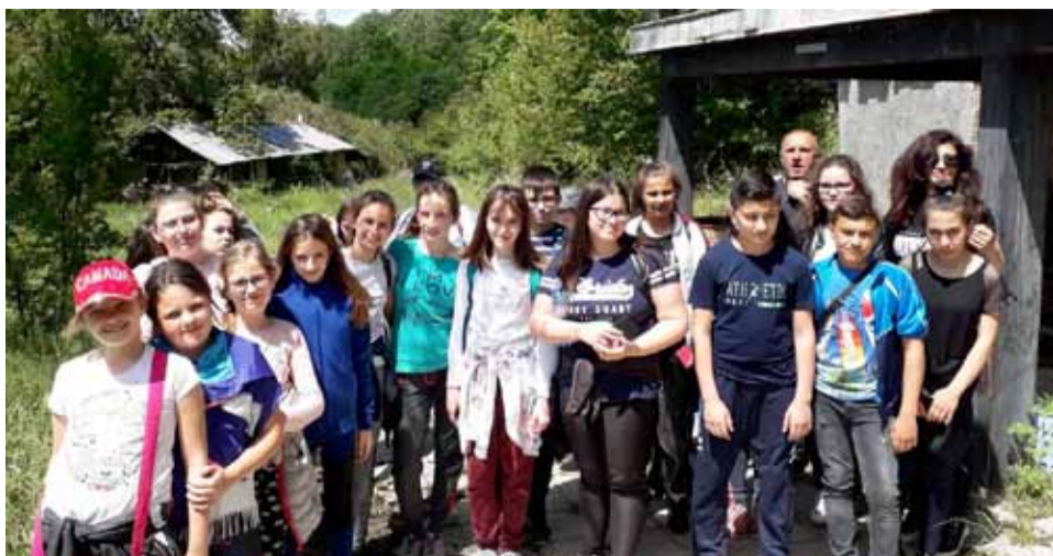
Деца с радост се включват в походите на ТД „Добруджанец“.