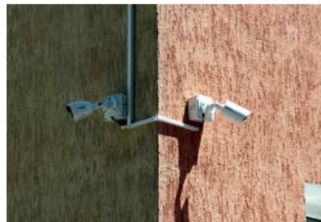
Поставянето на видеонаблюдение цели да гарантира максимална сигурност на подрастващите.

Допълнителни разисквания предизвикаха безстопанствените кладенци в квартал Пастир, както и нехайното отношение на ВиК към хидрантните кранове, които са жизненоважни при възникнали извънредни ситуации и пожари.