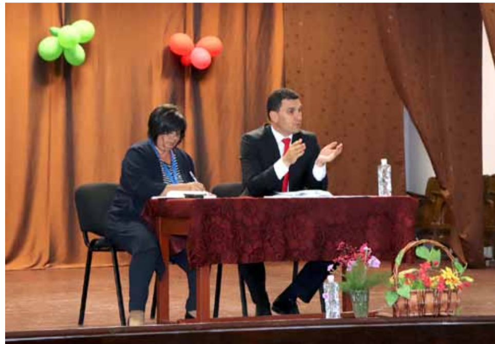
Момент от срещата „Попитай кмета“ в квартал Пастир.

първо лице какво всъщност се случи с водата им, кметът на община Генерал Тошево бе кратък в обзора си изминаващия пролетен месец. В него той акцентира на богатия културен календар на общината и това, че все повече нови инициативи се включват в него.