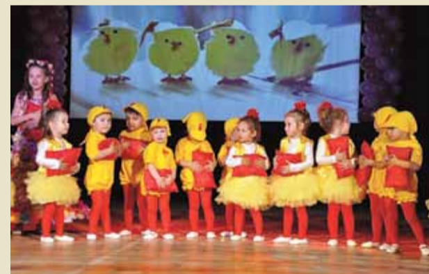
С такива прекрасни изпълнения децата от Детска градина „Пролет“ просълзиха своите родители.

В края на миналата седмица в НЧ „Светлина - 1941“ - град Генерал Тошево се проведе празничен концерт по случай 45-годишнината от създаването на Детска градина „Пролет“ в града. Тържеството изпълни до краен предел залата, а всички гости останаха възхитени от представената продукция на детското учебно заведение.