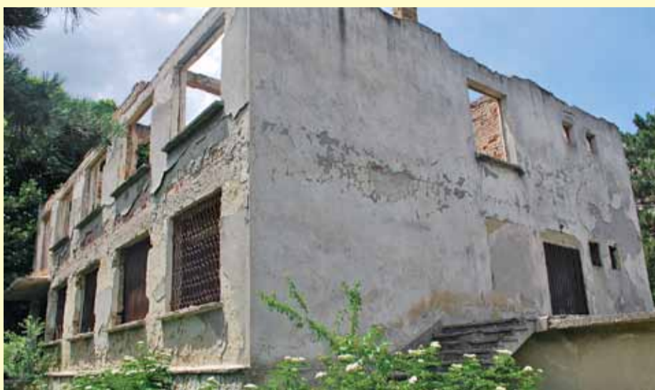
Ето така изглежда в момента разрушената сграда. Тя ще бъде съборена и на нейно място ще бъдат изградени гаражи и навес.

Три златни медала донесе СКВТ „Генерал Тошев“ от Държавното лично първенство в Хасково. 4 стр.