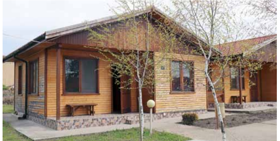
Докоснете се до Йовковата Добруджа! Къмпинг село Красен приема гости целогодишно. Къмпингът разполага с четири четириместни бунгала, включващи всекидневна с кухненски бокс, две спални, баня, цифрова телевизия, паркинг и тераса с барбекю. За резервации: 0889 320 643; 0895 083 664.