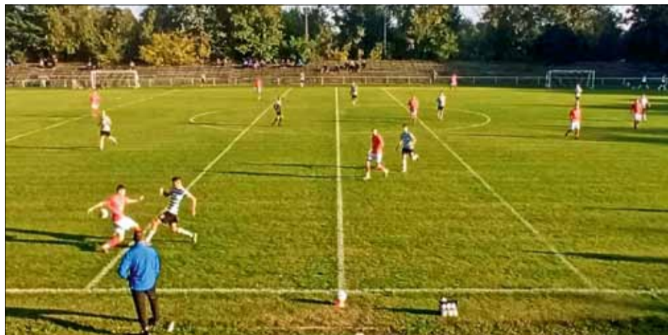
Двубоят между „Спортист 2011“ и втория тим на „Черно море“ предложи доста емоции и интригуващ футбол.