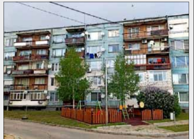
Сега всички живущи в блоковете, които останаха несанирани в града ни, ще имат възможност да кандидатстват ново и да обновят енергийно сградите, в които живеят.

Първият е до 23:59 часа на 15 февруари 2023 г. Вторият срок е до 23:59 часа на 31 март 2023 г. Първият етап предвижда предоставяне на 100% безвъзмездна финансова помощ за обновяване на многофамилни жилищни сгради. Предвидените за него средства са в размер на 1 129 881 600 лева с включен ДДС. Предвижда се минималният размер на заявените средства по всеки индивидуален проект за сграда или блок-секция да е 100 000 лева, а максималният да