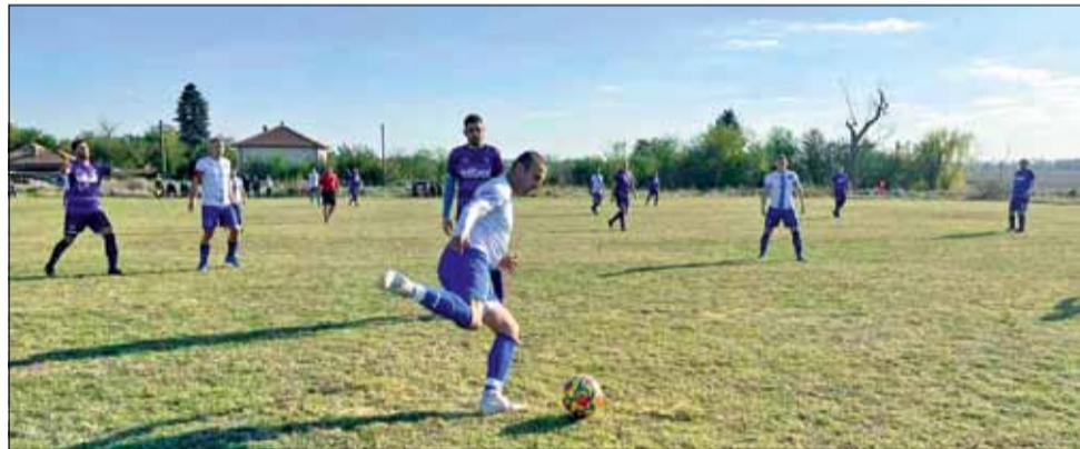
Момент от горещото общинско дерби между отборите на „Дружба“ и „Спортист“.

Другият общински тим „Партизан“ (Василево) загуби с 0:9 гостуването си в Добрич на юношеската формация на „Добруджа“.