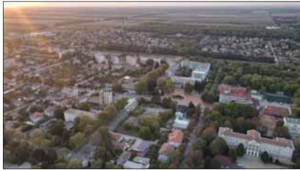
Направете страхотния кадър на нашия град и участвайте в конкурса. Трябва ви само малко въображение и улавянето на точния момент...

• Фотографиите да са придружени с кратко заглавие, информация за мястото на което е направена снимката, трите имена на участника училище, ЦППР – школа, клуб, телефон и email за връзка, име на ръководител, ако има такъв;