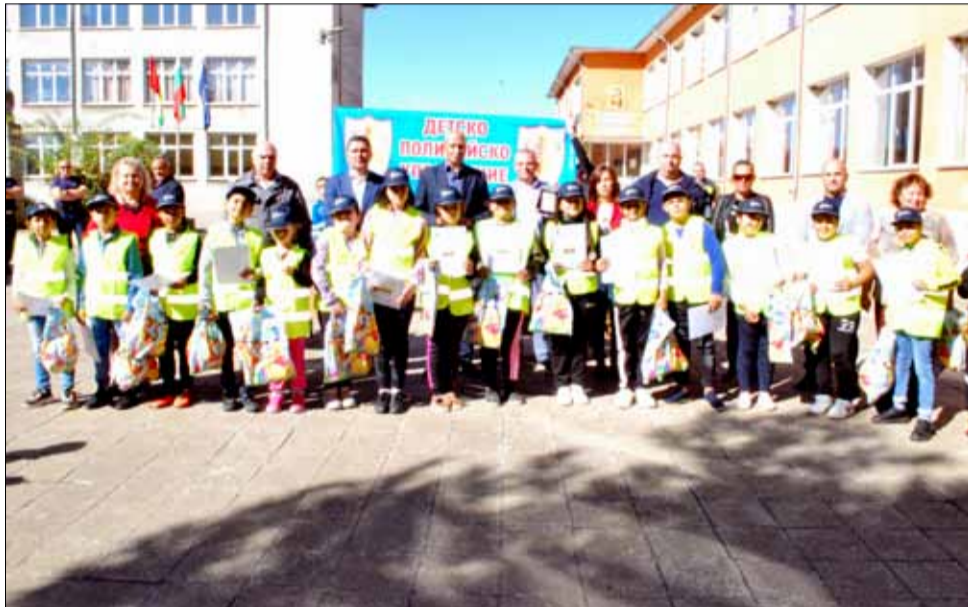
В следващите две години децата от ОУ „Йордан Йовков“ в село Спасово ще се потопят в тайните на работата на служителите на реда.

По време на официалното събитие учениците, участници в програмата получиха много подаръци, сред които специални светлоотразителни жилетки и шапки, но по-интересното за тях беше, че имаха възможността да се докоснат до тайните на специализираните автомобили на МВР. Разгледаха отвътре полицейската кола, след което се включиха в демонстрацията по за потушаване на пожар.