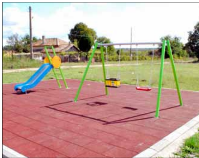
Площадката в село Горица е цветна и приветлива.

ка. Тези съоръжения са допълнения към вече съществуващите обособени детски кътове за игра.