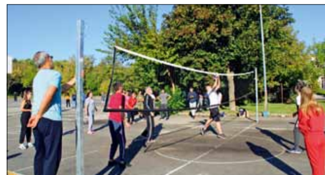
Учениците от Професионална гимназия по земеделие „Тодор Рачински“ взеха участие в инициативата с огромно желание и интерес.

В следващия кръг – на 15 октомври (събота), „Спортист 2011“ гостува в Търговище на местния „Светкавица“, който също е без поражение от началото на сезона и има седем победи от седем мача с голова разлика 12:2.