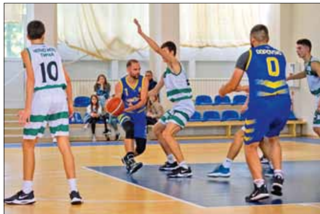
Тимът на „Спортбаскет ГТ“ започна втория си сезон в шампионата на ББЛ – Зона „Изток“.

Ден преди двубоя на „Спортбаскет ГТ“ пък стана официално ясно, че тимът ще приеме две домакинства на кръгове от програмата. Датите ще бъдат допълнително обявени, но съществува вариант „Черноморец“ (Балчик) също да поиска да домакинства в нашия град. Това ще даде възможност на „Спортбаскет ГТ“ да изиграе четири двубоя пред родна публика в спортната зала на СУ „Никола Й. Вапцаров“.