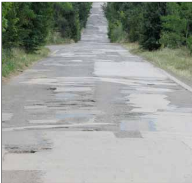
Всички могат да дадат своите предложения за ремонт на даден участък. Такива пътища категорично не трябва да съществуват.

Граждани могат да изпращат предложения и сигнали, включително снимки и видеоматериали, чрез форма за подаване на предложения за пътища с необходимост от ремонтни дейности, на имейл адрес: signalii@api.bg. Форма-