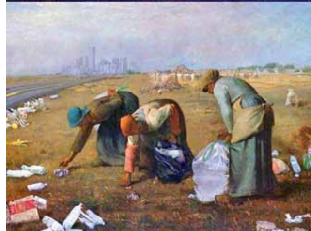
Преди – сега...