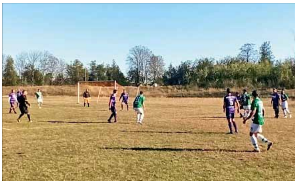
Изминалият уикенд предложи много интересни футболни срещи в „А“ Областна група – Зона „Изток“.

На 22 и 23 октомври ще се изиграят двубоите от шестия кръг на първенството. В събота „Спортист“ приема „Добруджанец“ от 16:00 часа на стадиона в Генерал Тошево. На следващия ден „Дружба“ е домакин на „Албена – 97“, а „Партизан“ гостува на „Орловец – 2008“.