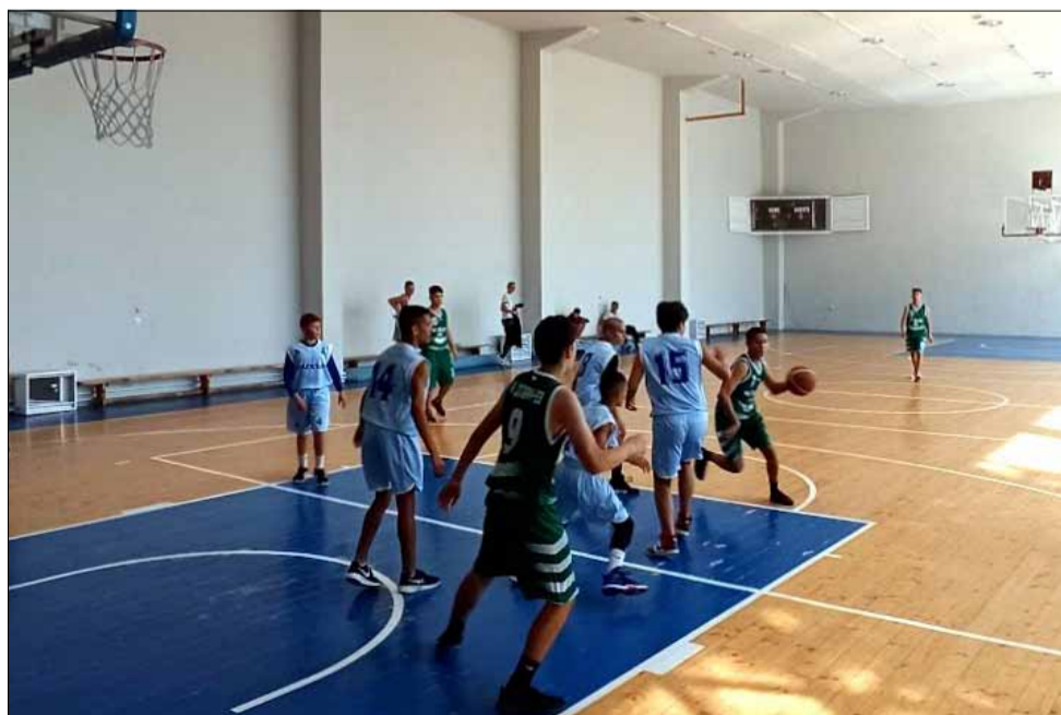
Спортната зала в СУ „Никола Й. Вапцаров“ ще бъде често домакин на множество двубои при подрастващите баскетболисти в региона.

Всички привърженици на баскетбола могат да намерят пълната програма на първенствата в различните възрастови групи и дивизии, както и датите за домакинствата в град Генерал Тошево на сайта www.basketball.bg .