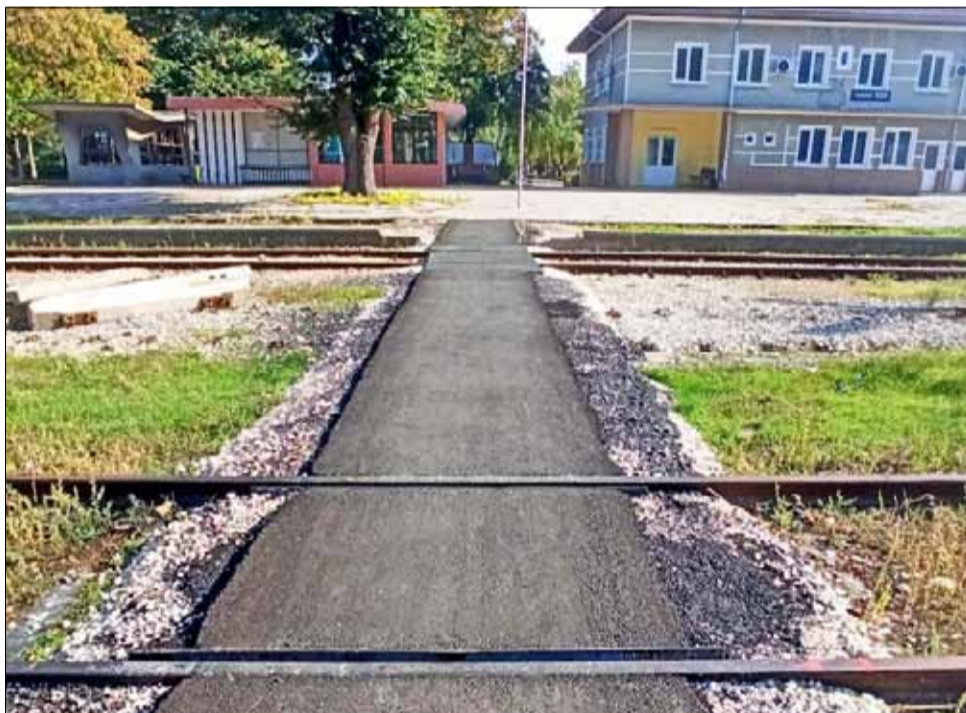
До края на ремонтните дейности трябва да бъдат поставени бордюри и специална прелезна ограда.

Макар и в незавършен вид прелезът вече се използва от гражданите – най-вече от майки с колички, които водят децата си до Детска ясла „Радост“. Велосипедистите също преминават през него без да се налага да слизат от колелото и да го пренасят през релсите, каквато гледка беше доста честа преди време. За всички вече остава отговорността да внимават и винаги да се оглеждат при преминаването през прелеза.