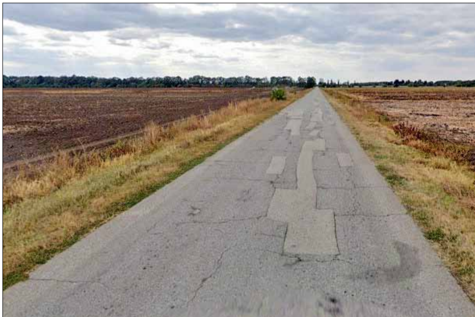
От години пътят между Петлешково и Пленимир е в много лошо състояние.

Пълната рехабилитация на път DOB3033 – /II-29, Добрич - Генерал Тошево/ - Пленимир - Петлешково предвижда фрезование на асфалтова настилка, полагане на трошенокаменна настилка, изкопаване на земна маса, оформяне и засипване на банкетите с трошенокаменна настилка, доставка и полагане на два пласта асфалт по 4 см. След приключване на тези дейности се предвижда и полагането на маркировка и нови пътни знаци.