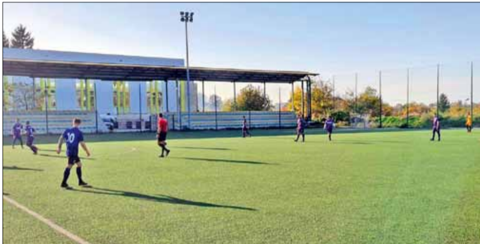
В Добрич „Дружба“ не успя да се противопостави на домакина „Интер“ и загуби с 0:7

В друг двубой от същия кръг, в същия ден и час, „Спортист“ ще приеме в град Генерал Тошево тима на „Интер“ в една напълно равностойна и непредвидима среща.