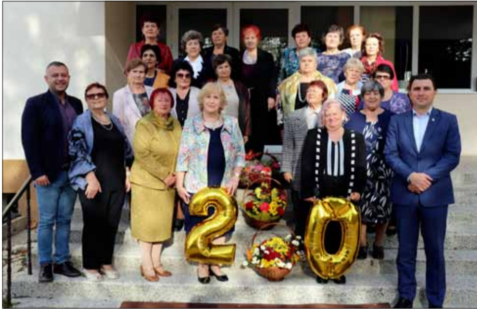
Много усмивки по повод 20-годишнина от основаването на клуба.

Добре ни е заедно, пожелаваме си да е за по-дълго...!