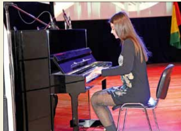
Децата от Школата по изкуства при НЧ „Светлина – 1941“ демонстрираха наученото от началото на новата учебна година.

тезитор възпитаниците на различните школи се представиха чудесно и бяха бурно аплодирани от децата, изпълнили до краен предел залата в читалището. Пев-