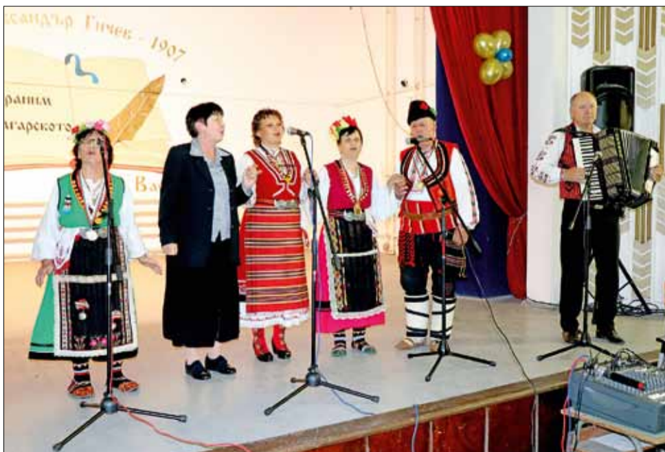
В село Василево се получи един наистина хубав празник.

Празничната програма продължи близо два часа и включваше различни музикални изпълнения. Първи на сцената се качиха самодейците от местното читалище, които зарадваха присъстващите с няколко красиви фолклорни изпълнения. След това пред публиката се представиха и гостуващи групи от читалищата в селата Сноп и Преселенци. Кулминацията на тържеството бяха изпълненията на талантливите деца от Ансамбъл „Балик“, град Балчик, които показаха красотата на българския народен танц.