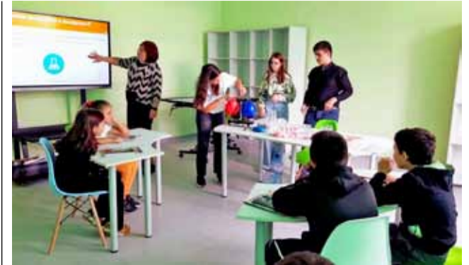
В СУ „Никола Й. Вапцаров“ обучението винаги е интересно и иновативно.