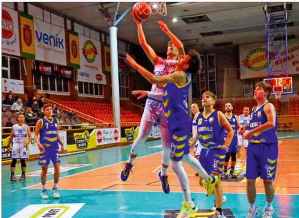
Мъжският отбор на „Спортбаскет ГТ“ най-после ще има възможността да се изяви пред местните привърженици на играта.

Във временното класиране тимът на „Спортбаскет ГТ“ е на последното 10 място с 4 загуби от 4 двубоя. Със същия актив е и следващият съперник на нашия тим – „Калиакра“ (Каварна). Подкрепата на местната публика обаче може да вдъхне сили на момчетата на Стойо Стоев и те да се преборят за първи успех през сезона.