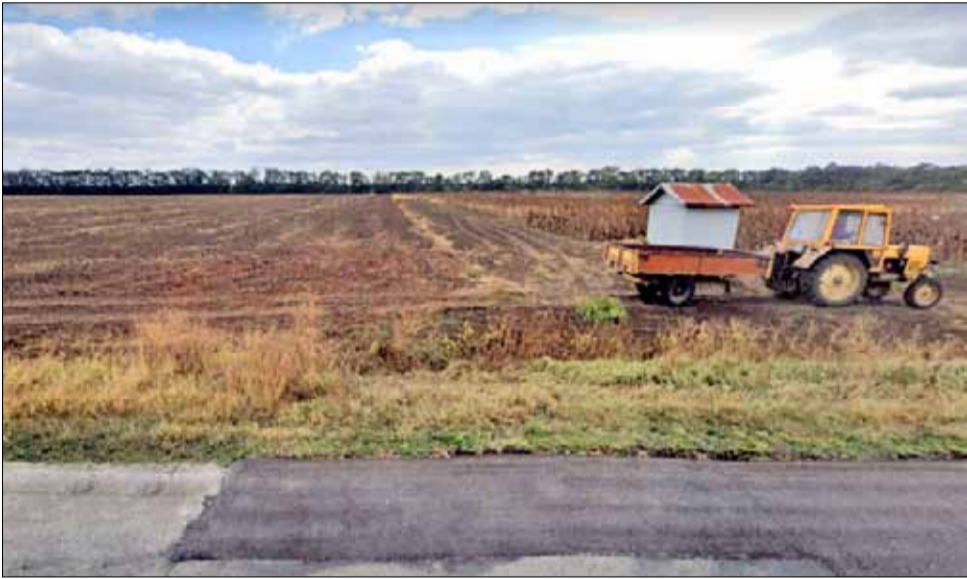
Рентите и през тази година ще бъдат около и малко над 100 лева.