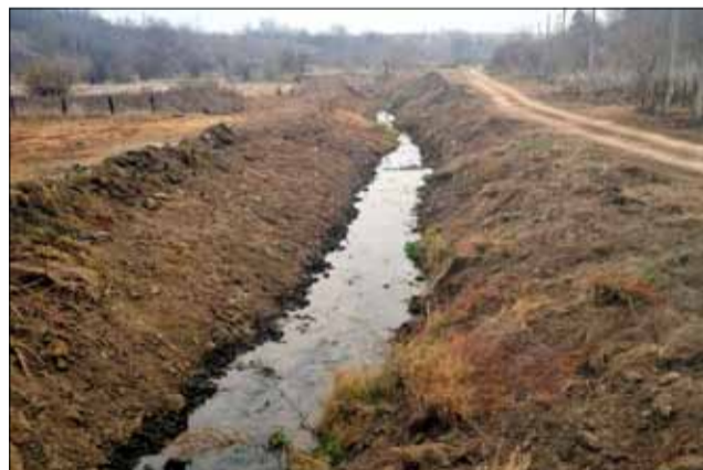
Така изглежда дерето след неговото почистване.

В последната седмица на месец ноември завършиха работите по почистването на коритото на дерето в село Красен. Те са част от планираните дейности на Община Генерал Тошево за ограничаване на последствията от природни бедствия.