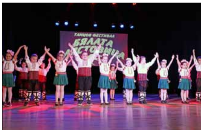
Най-малките участници във фестивала бяха на по 4 и 5 години.

Във фестивала се включиха над 240 деца, разделени в различни възрастови групи и стилове – съвременни танци, мо-