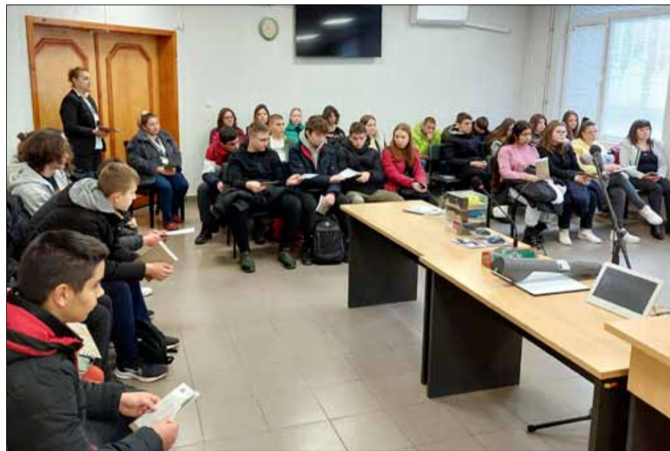
Денят на отворените врати в Районния съд предизвика интереса на учениците в града.

Наградени са 1 и 2 клас при ОУ „Йордан Йовков“, село Красен.