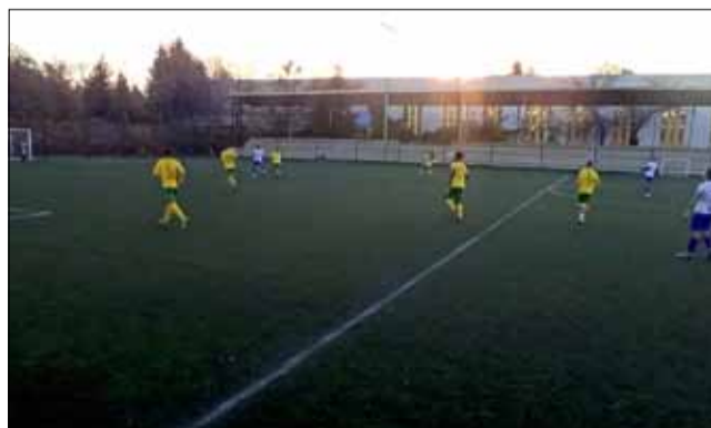
„Спортист“ завърши полусезона с кошмарна загуба от юношеската формация на „Добруджа“.

Така през паузата между двата полусезона на върха в