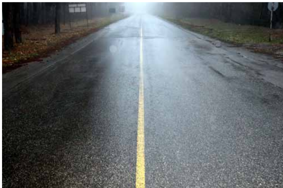
Пътят от Генерал Тошево до ГКПП Кардам вече е изкърпен и няма дупки. Сега се чакат пълната рехабилитация на трасето, която трябва да се случи през 2023 година.

От АПИ пък увериха, че през следващата година ще продължи текущият ремонт по пълната рехабилитация на път II-29 Генерал Тошево – Кардам – ГКПП „Йовково“, но хората вече трудно вярват на подобни обещания.