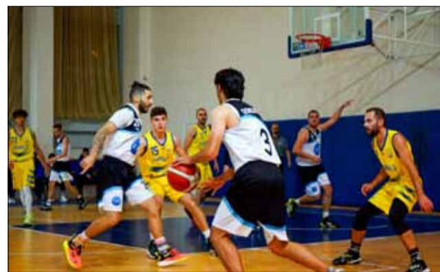
Втора победа за „Спортбаскет ГТ“ през настоящата кампания.

Отборът на „Спортбаскет ГТ“ записа своята втора победа от началото на редовния сезон в шампионата на баскетболната „Б“ Група – Зона „Изток“ в ББЛ. Възпитаниците на треньора Стоев спечелиха по изключително драматичен начин срещата си с варненския тим „Bay Kings Varna“ с 67:65 и се изкачиха до осмо място във временното класиране.