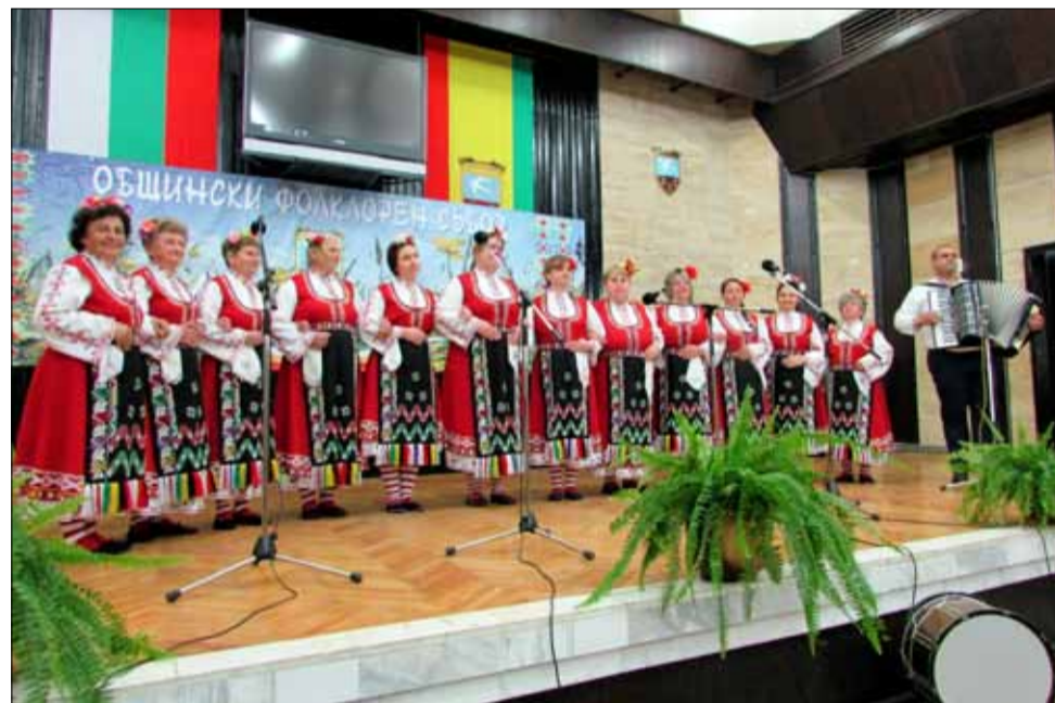
Общински фолклорен събор "Цветница"

рането на улицата пък се подобри и облагороди инфраструктурата в централната част на града, което го прави по-приятен и достъпен.