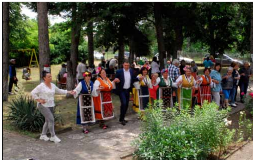
Малко преди да настъпят летните месеци в село Балканци имаха троен повод за празнуване.