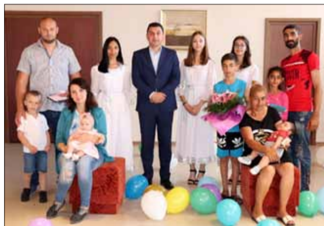
Първото бебе, родено през 2022 година и последното, родено през 2021 година, бяха орисани на официална церемония.

церемония бяха открити два нови военни паметника. Паметна плоча на загиналите във войните за национално обединение и във Втората световна война жители на село Житен и Паметна плоча на войните, загинали в битката край село Житен на 14.09.1916 г.