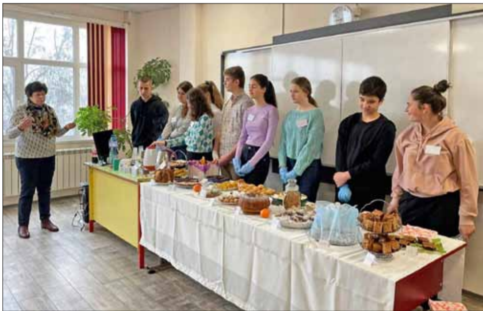
Интересните образователни часове винаги ще са предпочитани от учениците.

През 2022 г. в конкурса по направление „Български производител на земеделска техника“ участват 7 фирми с 13 машини, по направление „Иновации“ – 9 фирми с 15 машини, а по направление „Механизация в земеделското производство“ – 17 земеделски производители. Победителите получават плакет за всяка фирма и диплом за всяка машина, като признанието се отнася до целия производствен процес – от създаването и предлагането до използването на иновативни машини в производството. През 2022 г. отличието е наречено „Единение“, Единение на образование, наука и бизнес – на ученици, студенти, научни работници, земеделски производители и търговци на земеделска техника за прилагане на иновативни технологии с иновативни машини. Благодарната кауза „Единение“ е осъществима дори и в трудни години, убедени са организаторите на конкурса.