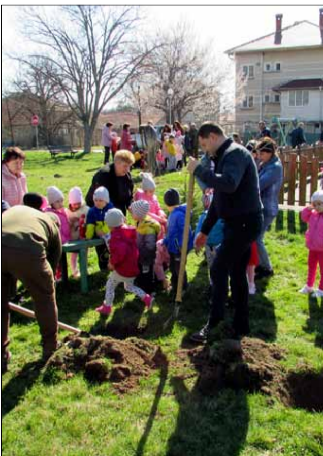
Акциите по залесяване продължиха и през 2022 година.

На 3 май се проведе официална церемония за откриване на реновираната сграда на НЧ „Дора Габе – 1940“ в село Дъбовик. Инфраструктурните дейности включваха цялостен външен и вътрешен ремонт на сградата на читалището, прилежащото