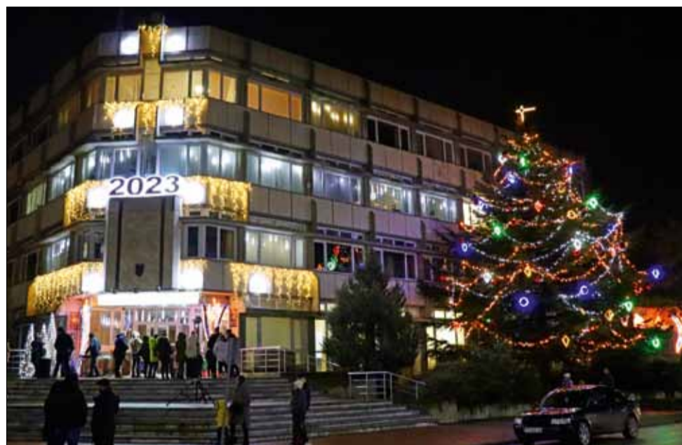
Коледните светлини на град Генерал Тошево бяха запалени за радост на малки и големи.

Благодарение на машинното мулчиране, занапред поддържаната на общинската пътна мрежа ще бъде много по-лесна.