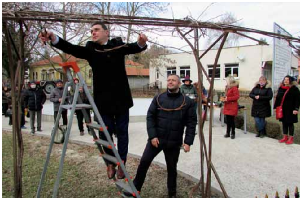
Традиционното зарязване на лозите на Трифон Зарезан.

Преди 12 месеца новата 2022 година започна с добра новина, свързана със социалната политика на Община Генерал Тошево. На 4 януари беше сключен нов договор с Фонд „Социална закрила“ за реализиране на дейности по предоставяне на топла храна към Целева програма „Обществени трапезарии“ за 120 бенефициенти на територията на общината, в рамките на 248 работни дни. До-