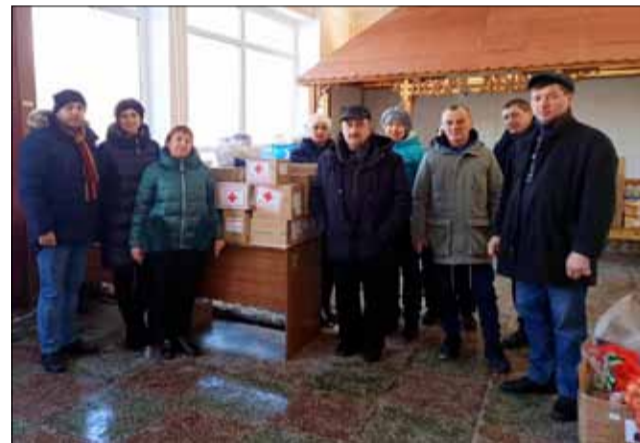
Хората в Болград бяха безкрайно благодарни за помощта и вниманието, които получиха от всички нас.

Площадката беше изградена на 72 кв. м. площ върху ударопоглъщащи плочи за пълна безопасност на спортуващите. Фитнес уреди-