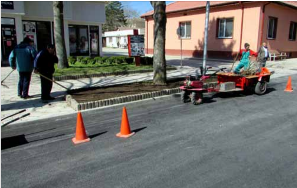
След асфалтирането на ул. "Васил Априлов", бяха облагородени и градинките на тротоарите, за да бъде по-приятен център на града ни.

Продължава от 2 стр. С изграждането на фитнеса на открито са свързани надеждите да се повиши физическата активност на хората и да се разнообразят възможностите за спорт в селото.