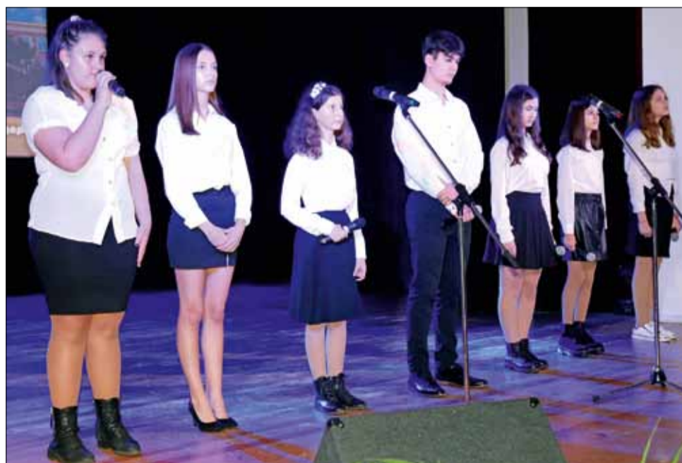
Рециталът на учениците от СУ „Никола Й. Вапцаров“ беше завладяващ и незабравим.

чово хоро – поздрав-изненада от учителите към всички ученици, родители и гости.