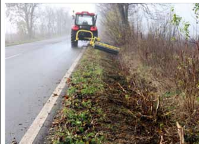
Благодарение на новия мулчер, поддържаната на общинската пътна мрежа ще бъде много по-лесна.

Обработката на пътните банкети е съобразена с метеоро-