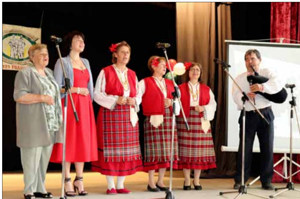
Културните събития през пролетта бяха много и всички преминаха с огромно въодушевление.

Продължава от 3 стр. На 11 май в село Пчеларово се състоя един истински фолклорен празник, който местните жители чакаха с огромно нетърпение. Едно от най-старите читалища в община Генерал Тошево – Народно читалище „Св. св. Кирил и Методий – 1897“, село Пчеларово отпразнува своята 125-годишнина от основаването си.