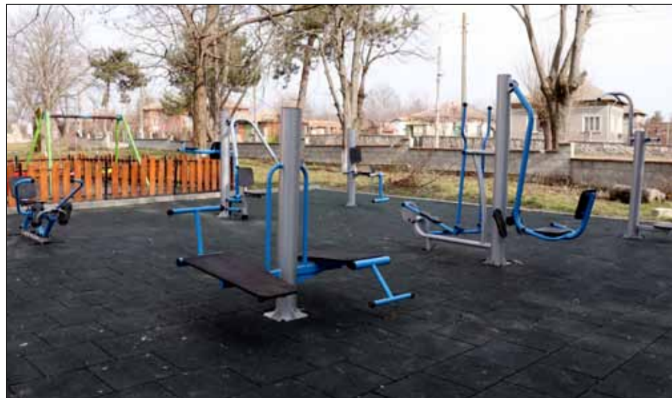
В село Спасово и малки и големи спортуват на открито.

Двамата не искат нито да се разчува за случката, нито да бъдат снимани. Искат да останат в анонимност. Доброто