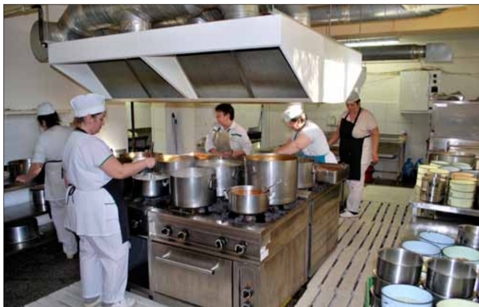
И през тази година продължи реализирането на услугата „Обществена трапезария“, която предоставя топла храна на 120 нуждаещи се жители на нашата община.

говорът беше подписан за 13 поредна година и е в сила до 31 декември 2022 г. Фонд „Социална закрила“ предостави сумата от 95 232,00 лв., като средствата се изразходват за приготвяне и доставяне на топла храна за обяд – супа, основно ястие и хляб.