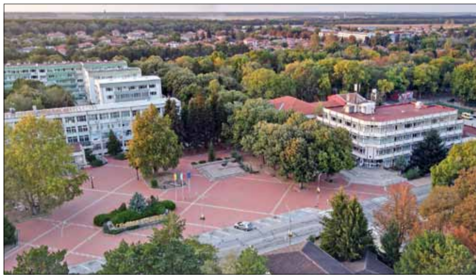
Градът на нашия живот порасна с още една година...

ствено от нас. И ако ние се научим да бъдем благодарни за това, което имаме тук и сега, ако се научим да го пазим и да го ценим, то със сигурност бъдещето ни ще бъде светло.