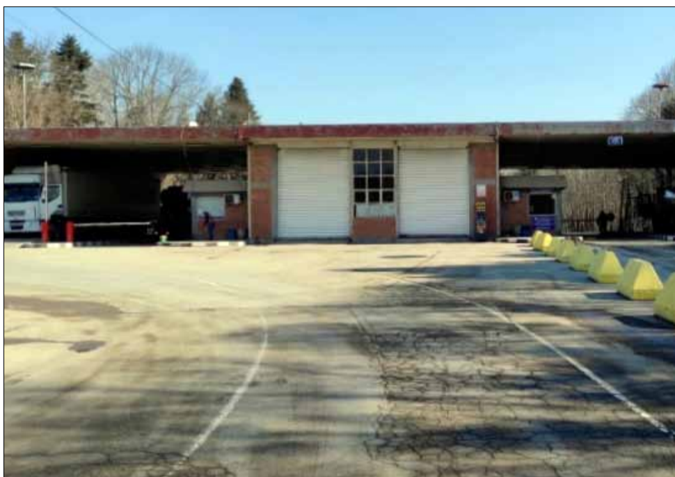
Ще имаме ли скоро един нов, модерен и европейски граничен пункт?