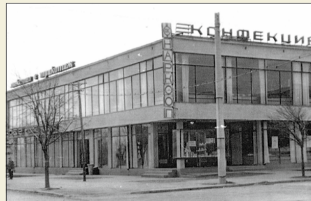
Да, и нашето малко градче си имаше единствения Универсален магазин...

Ние, децата на 80-те и 90-те, израснали в малкия град обаче, не сме съвсем съгласни с текста на тази песен. На нас винаги имаше какво да ни се случи. И съвсем не ни липсваха места за игри или най-различни приключения. Никога не ни е пречило, че имаме само едно кино и тъй като е лятно, проекциите се свеждаха до не повече от 5 в годината (основ-