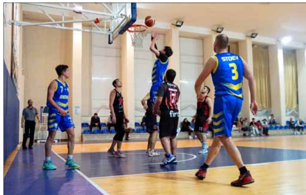
Нашите баскетболисти отстъпиха и пред „Консуматорите“.

В следващия кръг „Спортбаскет ГТ“ ще гостува в Търговище, където ще премери сили с тима на „Светкавица Б“. Домакините са лидер в класирането с 11 победи в 11 двубоя.