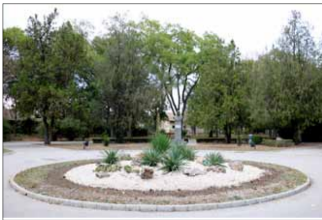
Едно от любимите места за събиране на всички младежи в града.

Разкажете ни за някое „ваше“ тайнствено място