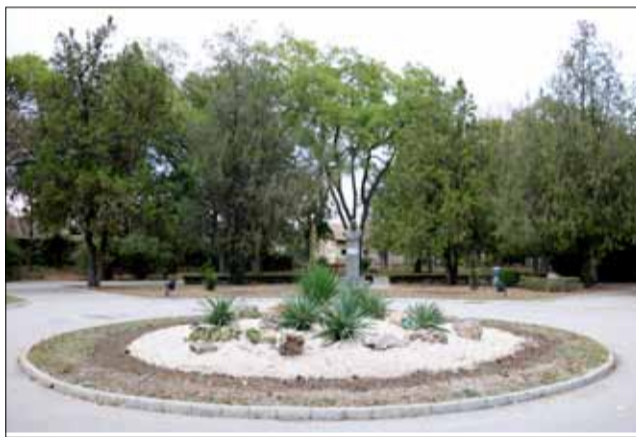
Едно от любимите места за събиране на всички младежи в града.

Разкажете ни за някое „ваше“ тайнствено място