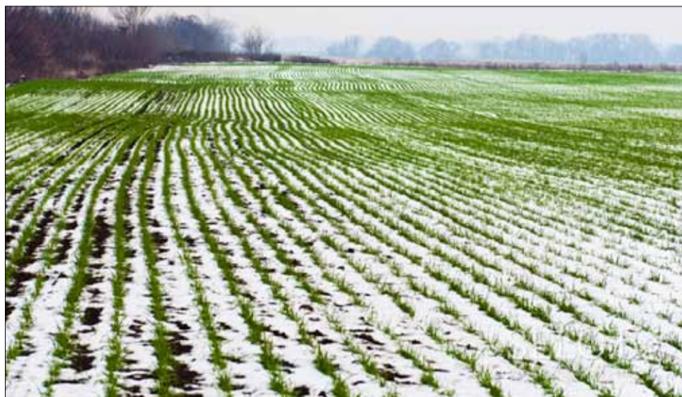
Снегът през миналата седмица беше много малко и не успя да се задържи в полетата дори и ден.

В област Добрич през есента въпреки сухите условия земеделските стопани успяха да засеят 1 200 000 дка с пшеница и 57 000 дка с ечемик.