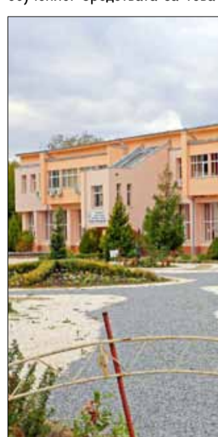
В ПГ по земеделие „Тодор Рачински“ не спират да работят в посока по-добро образование за нашите деца.

Професионалната гимназия по земеделие „Тодор Рачински“ в град Генерал Тошево е едно от 28-те учебни заведения в страната, което ще бъде модернизирани и оборудвани в съответствие с най-високите технологични изисквания с цел превръщането му в Център за високи постижения в професионалното образование и обучение.