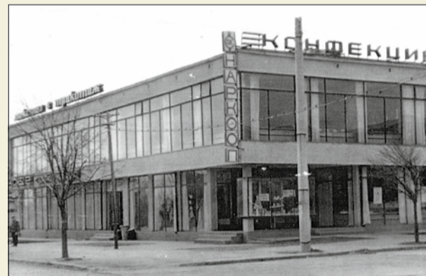
Да, и нашето малко градче си имаше единствения Универсален магазин...

Ние, децата на 80-те и 90-те, израснали в малкия град обаче, не сме съвсем съгласни с текста на тази песен. На нас винаги имаше какво да ни се случи. И съвсем не ни липсваха места за игри или най-различни приключения. Никога не ни е пречило, че имаме само едно кино и тъй като е лятно, проекциите се свеждаха до не повече от 5 в годината (основ-