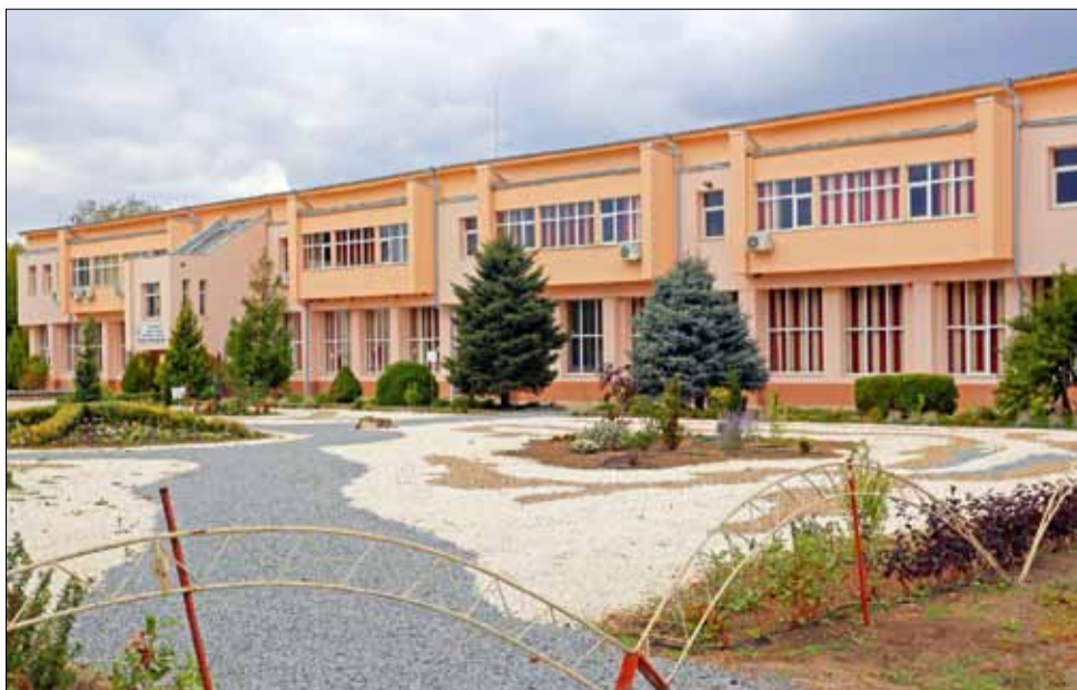
В ПГ по земеделие „Тодор Рачински“ не спират да работят в посока по-добро образование за нашите деца.

Учебното заведение вече е преминало през комплексна оценка по критерии, свързани със спецификите на училището, неговата адаптивност към настъпващи промени, финансов капацитет, възможност да отговори на нуждите на региона от кадри и други.