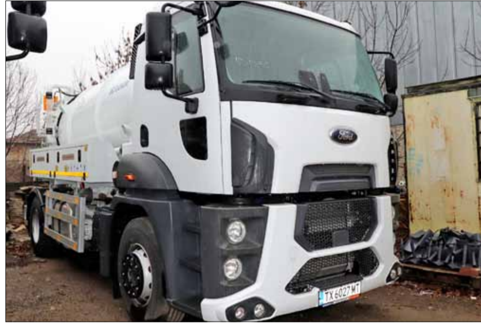
Жителите на нашата община вече могат да се възползват от услугите, които каналопочистващата машина извършва.