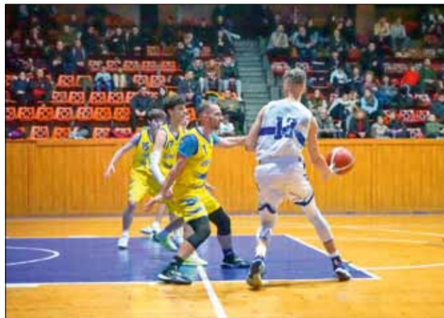
Нова загуба за „Спортбаскет ГТ“ в ББЛ

Домакините са абсолютен лидер във временното класиране с пълен актив от 24 точки (12 победи, 0 загуби) и съвсем логично през целия двубой контролираха играта на полето. Те натрупаха солидна преднина още през първата четвъртина (22:11) и до края на срещата поддържаха темпото. На