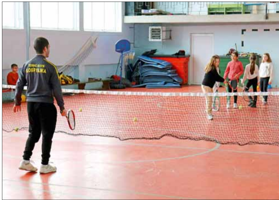
Групова тренировъчна сесия на ТК „Добруджа“ с момичета от град Генерал Тошево.

зи възможност, но поради различни причини, тя не можеше да се реализира досега. Със съдействието на ръководството на ОУ „Христо Смирненски“, това обаче стана възможно. Тенис клуб „Добруджа“ работи с деца и възрастни, като от самото начало имаме възпитаници от Генерал Тошево, които посещаваха тренировки в Добрич, водени от тех-