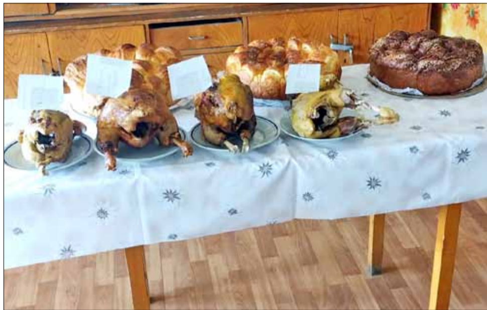
В село Кардам си спретнаха конкурс за най-добре приготвен петел.

Основна традиция на този ден е да се заколи петел във всяка къща. Жертвената птица се заколва на прага, като стремежът е кръвта и да изпръска наоколо. С кръвта на закланата птица по челата на момчетата се прави кръстен знак, за да бъдат живи и здрави. Петльовден е български народен празник, обичай с регионално разпространение. Чества се главно в източнобългарската етническа територия – от Одринско и Лозенградско, до Добруджа. Приеман е като мъжки празник за стимулиране на плодовитостта на момчетата.