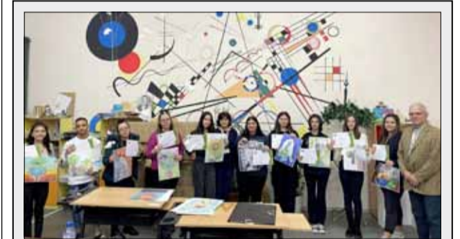
В първите дни на месец февруари учениците от клуб „Рисуване“ на Професионална гимназия по земеделие „Тодор Рачински“, град Генерал Тошево, получиха своите грамоти от участието си в конкурс „Композирай пречиствателна станция“ по Оперативна програма „Околна среда 2014-2020 г.“ на Министерство на околната среда и водите.

Одобреният Стратегически план за Обща селскостопанска политика (ОСП) на България е в размер на 5,6 млрд. евр.