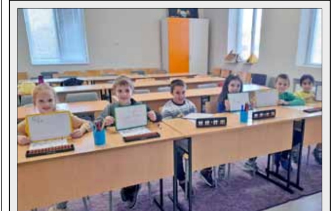
В края на месец януари Академия за развитие на интелекта AMAKids, град Добрич стартира партньорство с училище СУ „Никола Й. Вапцаров“ в часовете по интереси. Две образователни организации се обединяват в една обща кауза и една обща цел – интелектуалното развитие на децата. Сега прекрасните деца и техните учители ще имат ново предизвикателство пред себе си – курсът по Ментална аритметика.

В картините си учениците използваха различни техники на рисуване, включително и компютърна графика. Това впечатлително жури на конкурса и възпитаниците на учебното заведение от нашия град бяха напълно заслужено отличени.