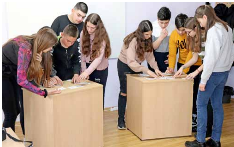
Викторината беше много интересна, а децата показаха знания.

Паралелно с това, децата от всички училища на територията на общината, продължават да творят и изпращат своите произведения за конкурса за есе и рисунка „150 години безсмъртие“. Той ще бъде отчетен през месец март, като творбите се предават в ЦПЛР – Център за работа с деца, град Генерал Тошево.