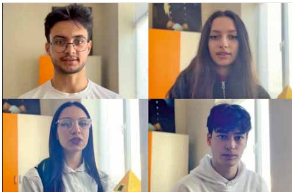
Част от младежите, включили се в благотворителната кампания.

Смятам, че човек става доста себичен, когато не иска да даде част от себе си на света. Не всичко в нашия живот трябва да е свързано с лични ползи и интереси. Възрастта в случая не играе никаква роля и не смятам, че трябва да се прави асоциация между добродушието и възрастта. Нека повече да се усмихваме и да гледаме света с един решителен поглед, защото нищо ново и креативно не произлиза от скептичността. Действията правят различията около нас и за това „Дела трябва да не думи“.