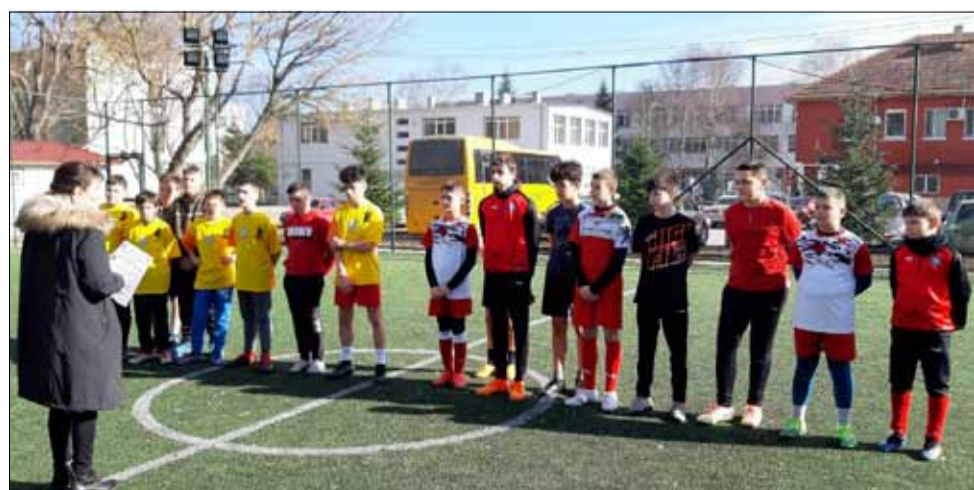
Финалистите по футбол в тазгодишното издание на Ученически игри 2023, общински етап.

След тригодишно прекъсване заради световната пандемия от коронавирус COVID-19, общинските кръгове на Ученическите игри в нашата община преминаха при сравнително голям интерес. В четирите вида спорт се включиха близо 100 деца от четири общински училища – СУ „Никола Й. Вапцаров“ и ОУ „Христо Смирненски“, град Генерал Тошево, ОУ „Йордан Йовков“, село Красен и ОУ „Йордан Йовков“, село Спасово.