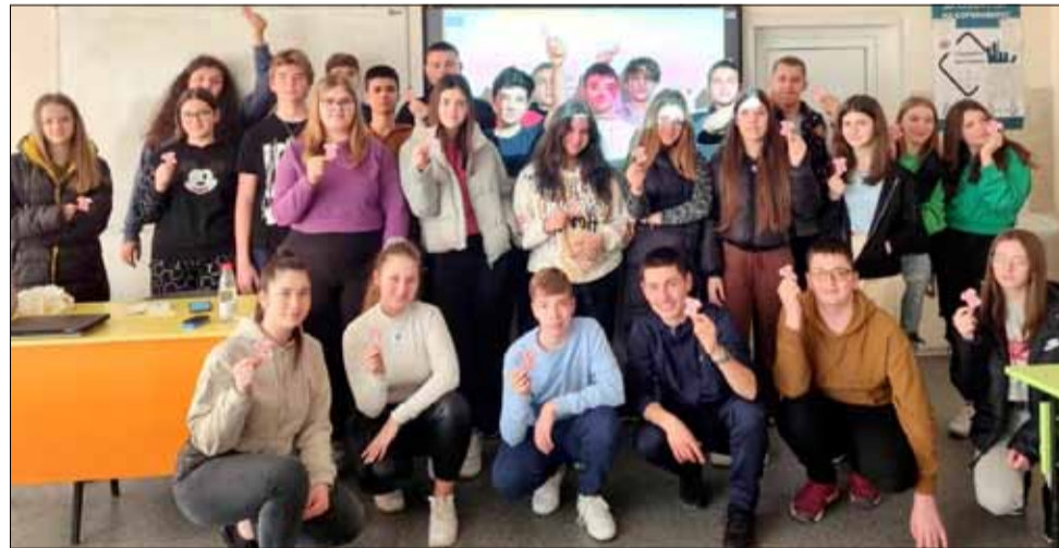
Учениците от ПГ по земеделие „Тодор Рачински“ участваха в интересни образователни уроци и беседи, свързани с тормоза в училище.

Други училища също се включиха с различни активности в Деня на розовата фланелка. Децата гледаха тематични филми, слушаха лекции и беседи, участваха във викторини и писаха послания против тормоза в училище.