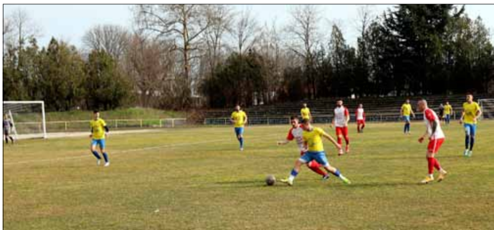
Първо домакинство за тима на „Спортист 2011“ през пролетния дял в шампионата.

С победата „Спортист 2011“ събра актив от 9 точки, но все още се намира на предпоследното 14 място в класирането. В следващия кръг тимът гостува на „Черноломец 1919“ (Попово).