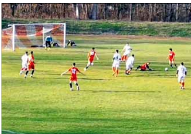
„Спортист 2011“ имаше доста тежки моменти по време на гостуването си в Попово.

След добрата игра в миналия кръг и домакинската победа с 3:2 над „Волов“, сега тимът на „Спортист 2011“ нямаше никакъв отговор за събитията на футболния терен. Още до 12-та минута домакините от Попово реализираха три безответни попадения. Въпреки това те не намалиха оборотите, а търсиха още голове на своята сметка. В края на първото полувреме „Черноломец 1919“ стигна до нови два гола за разгормено