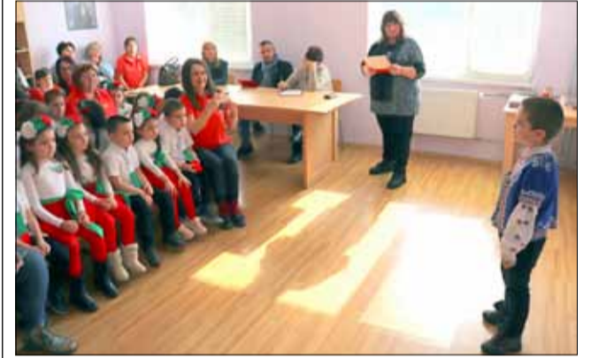
Дори най-малките участници в конкурса се бяха подготвили много добре.

При по-големите изпълнения пък бяха работени по-старателно. Повечето от по-големите участници разчитаха на интонацията и патосът в своите стихове. Самата конкуренция също беше много силна. Това максимално затрудни журито в даването на оценки и опре-