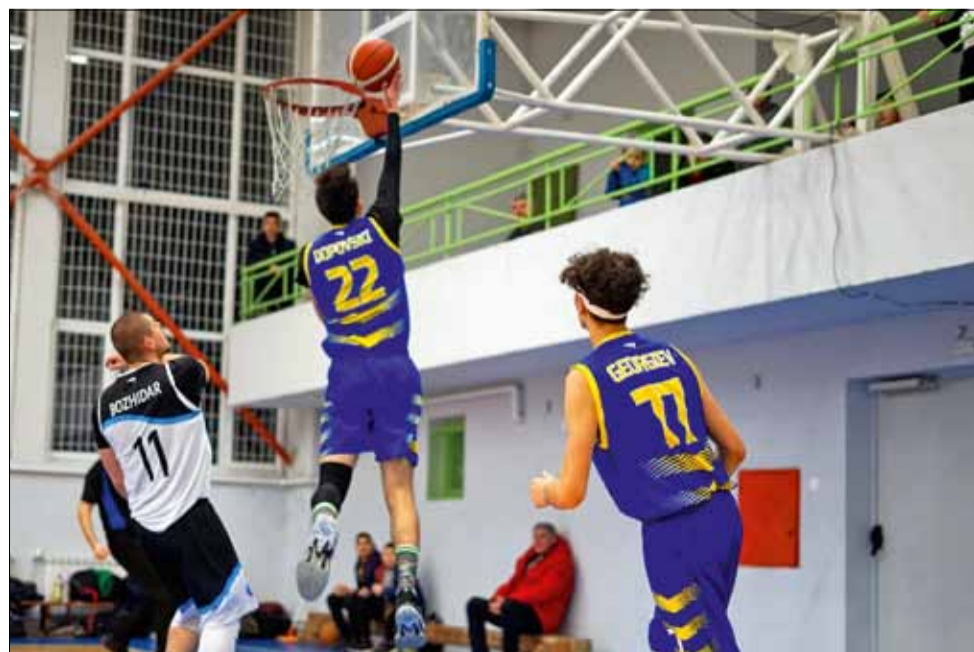
В поредния си двубой от първенството, момчетата на „Спортбаскет ГТ“ имаха подкрепата на местните привърженици на играта.

Загубата остави тима на „Спортбаскет ГТ“ на предпоследното 9 място във временното класиране с актив от 19 точки (3-12). Толкова има и „Вау Kings Varna“, който обаче се намира една позиция по-нагоре, заради по-добрите си показатели. До края на редовния сезон остават два кръга, в които „Спортбаскет ГТ“ играе срещу силните тимове на „Черноморец“ (Балчик) и „Шоутайм Б“ (Варна) и намирането на място в плейофите изглежда почти невъзможна задача.