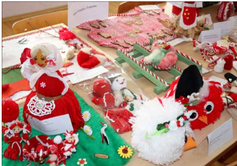
Това са само малка част от мартениците за конкурса.

Празникът на Баба Марта в българските традиции е символ на пролетта и носи пожелание за здраве и плодородие в началото на новия цикъл в природата. Традицията е свързана с древната езическа история от Балканския полуостров, свързана с всички земеделски култове към природата. Някои от най-специфичните черти на първомартенската обредност и особено завързването на усуканите бяла и червена вълнени нишки, са плод на многовековна традиция, която е била присъща за тракийски (палеобалкански) и елински обичаи.