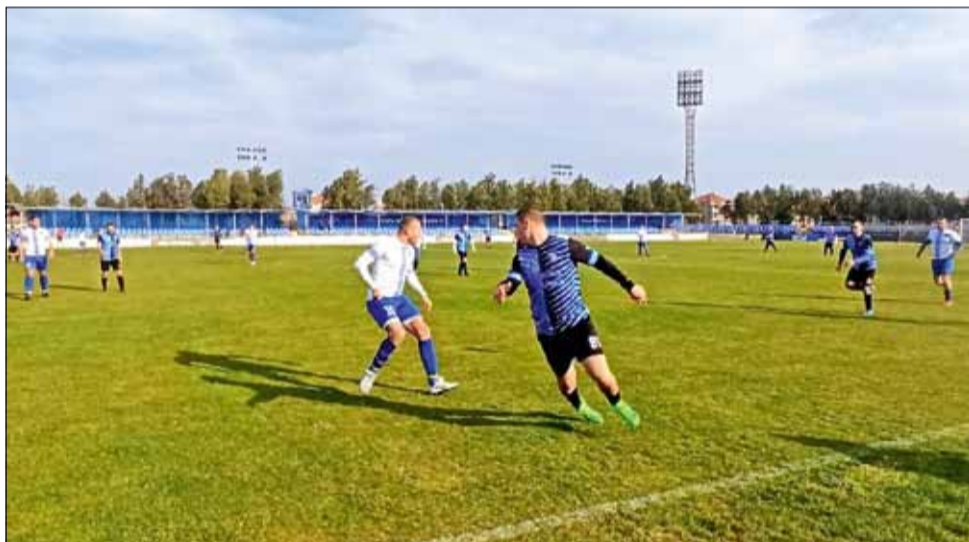
След дълго чакане футболът в най-ниските нива се завърна.

Следващия кръг на надпреварата ще се изигра на 11 и 12 март. В него „Спортист“ е домакин на „Орловец – 2008“, а „Дружба“ приема „Хр. Ботев“, като и двете срещи са на 12 март (неделя) от 14:30 часа. В този кръг „Партизан“ ще почива.