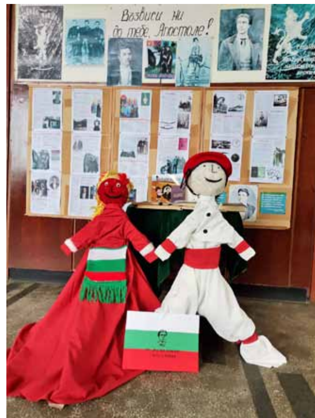
Това е най-голямата мартеница, която тази година беше предадена за конкурса на ЦППР – Център за работа с деца, град Генерал Тошево „Да сме бели и червени като мартеничките засмени“. Мартеницата е дело на деца от ОУ „Васил Левски“, село Преселеници.