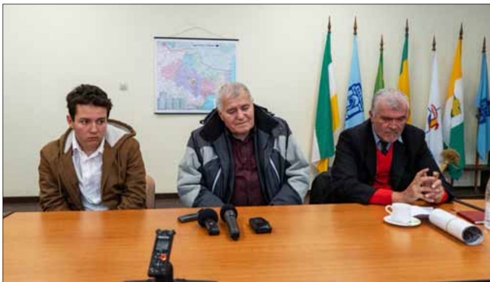
Това са тримата победители.

С помощта на учителите голяма група ученици от I до VII клас са изработили високите по 120 см. кукли Пижо и Пенда. Напълно заслужено творението на децата от село Преселеници спечели първа награда в раздел „Най-голяма мартеница“ от общинския конкурс. В момента мартеницата се намира във файето на учебното заведение в селото.