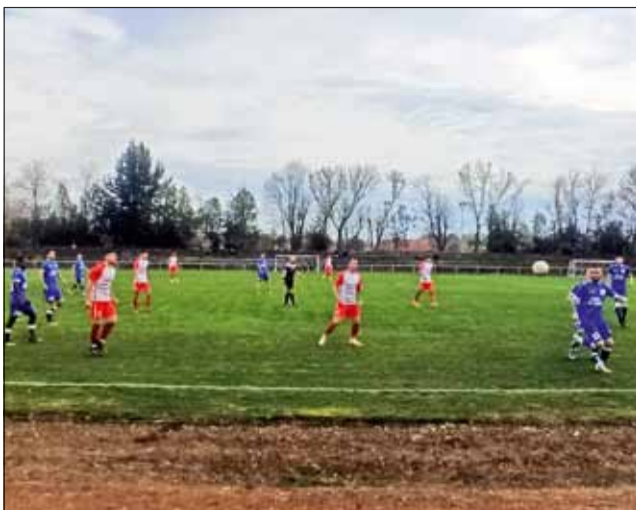
Двубоят с „Черноморец“ (Балчик) беше много труден за нашите футболисти.

Двете срещи се играха след уикенда, в който „Спортист – 2011“ по програма трябваше да почива. Футболистите имаха време да се възстановят и подготвят за тежите двубои до края на сезона, но още при гостуването в Добрич показаха слабости, за които платиха скъпа цена. Поражението с 0:4 дойде не толкова след лоша игра, колкото заради допускането на грешки в ключо-