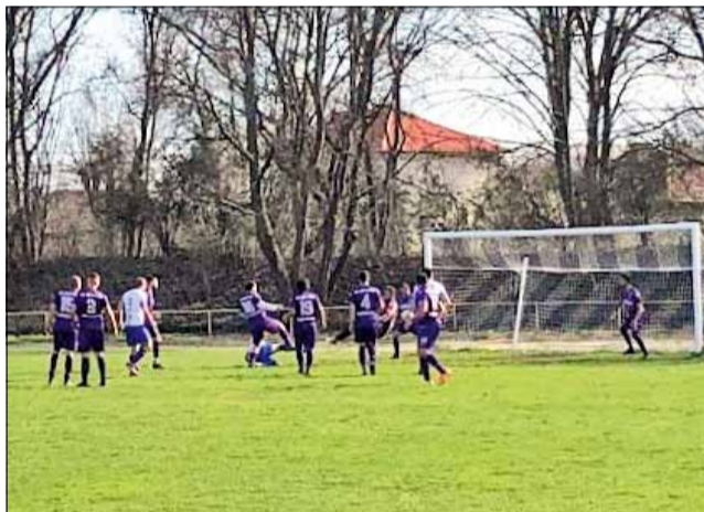
Дербито между „Спортист“ и „Дружба“ предложи осем попадения, пълен обрат в резултата и много интересни моменти. След паузата „Спортист“ на срещата резултатът все още

През миналия уикенд кръг в групата нямаше заради парламентарните избори. Първенството се подновява на 8/9 април, когато „Дружба“ ще бъде домакин на „Добруджанец“ (Овчарово), а „Партизан“ гостува на „Калиакра – 1“ (Каварна). „Спортист“ почива.