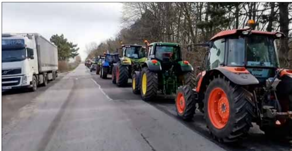
Зърнопроизводителите не искат собствената им стока да залежава по складовете за сметка на помощта за Украйна.

Освен в Кардам ефективните протестни действия се състояха и на граничните пунктове при Видин, Русе и Силистра.