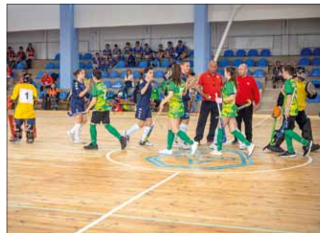
Малко не достигна на тима на „Стик ГТ“ да влезе сред най-добрите четири.

Във втория ден от първенството се играха финалните двубои, както и тези, които разпределяха местата от пето до осмо. В тези срещи отборът на „Стик ГТ“ беше нещадно удържан и записа две кате-