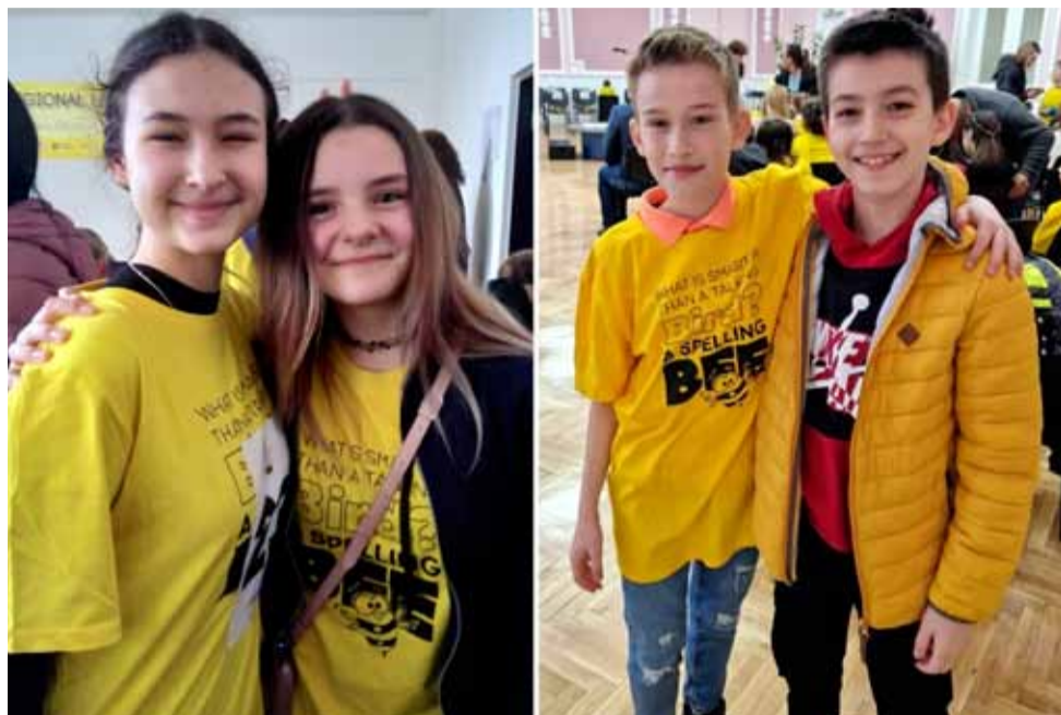
Това са децата, които се представиха отлично по време на силната надпревара.