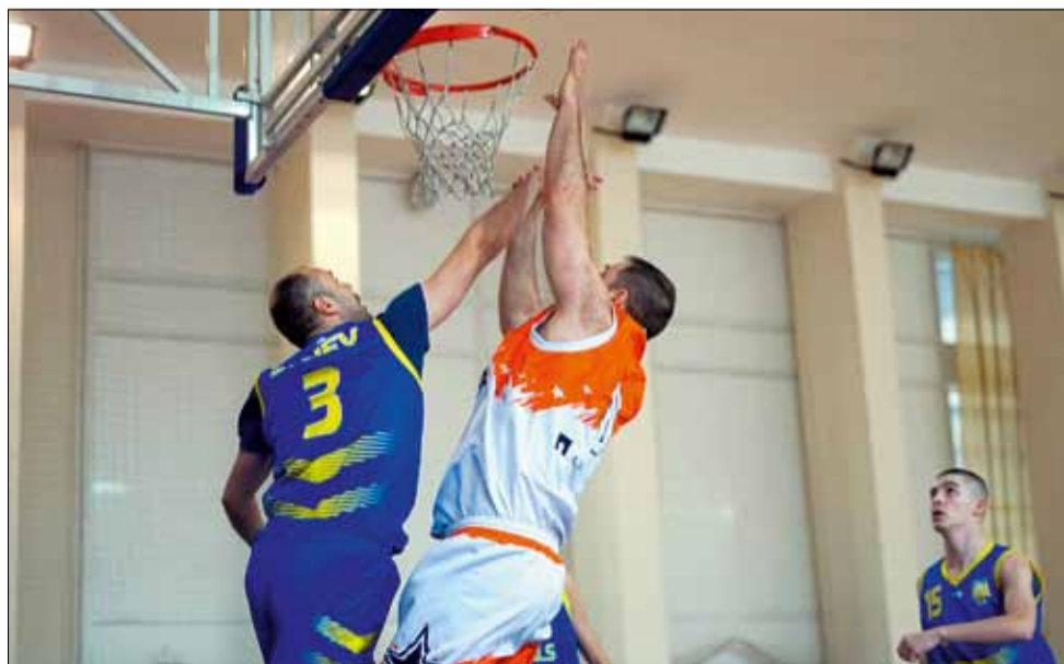
„Спортбаскет ГТ“ изигра последния си двубой в тазгодишната кампания.

Двубоят с „Шоутайм Б“ беше последният за този спортно-състезателен сезон за „Спортбаскет ГТ“. Сега в групата предстоят плейофите, но „генералите“ ще ги пропуснат. Те завършват кампанията с едва три победи - над „Калиакра“ (Каварна) с 83:80, „Bay Kings Varna“ (Варна) с 67:65 и отново „Калиакра“ (Каварна) с 91:46.