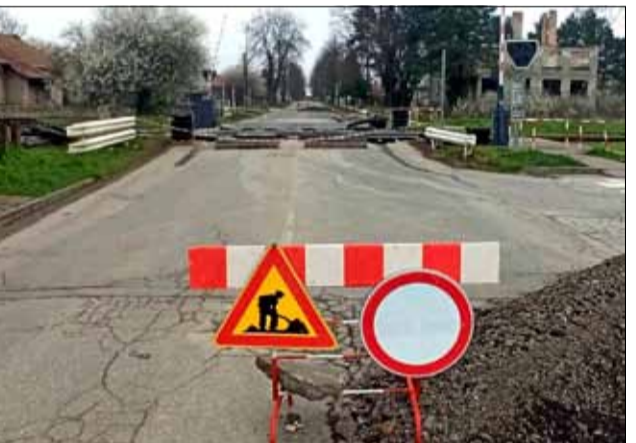
В рамките на три работни дни през миналата седмица, в периода 27–29 март, беше извършен планов ремонт на ЖП прелеза, разположен на път III-2903 в границите на град Генерал Тошево (по ул. „Опълченска“). Ремонтните дейности включваха подновяване на съществуваща прелезна настилка с еластична такава тип STRAIL.

18-21 април – Седмица на детската книга и изкуствата за деца. Различни прояви в библиотеката при НЧ „Светлина – 1943“, град Генерал Тошево, училища, детски градини и читалища в различните населени места;