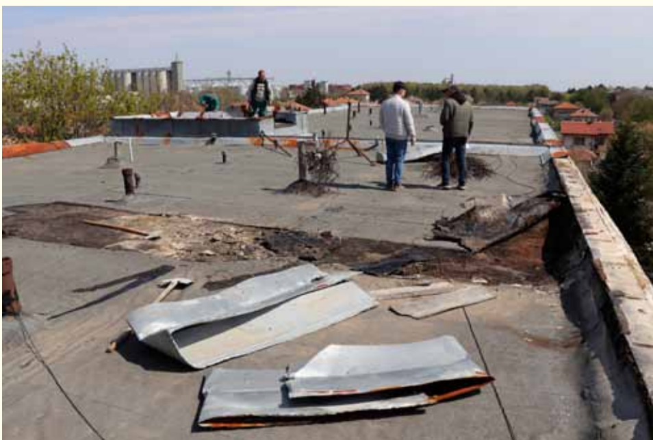
Ремонтът на покрива е все още в начална фаза.

и допълнителни козметични работи в някои от наводнените помещения, вследствие на компрометирания покрив, включително шпакловки по стени и тавани и боядисване с латекс.