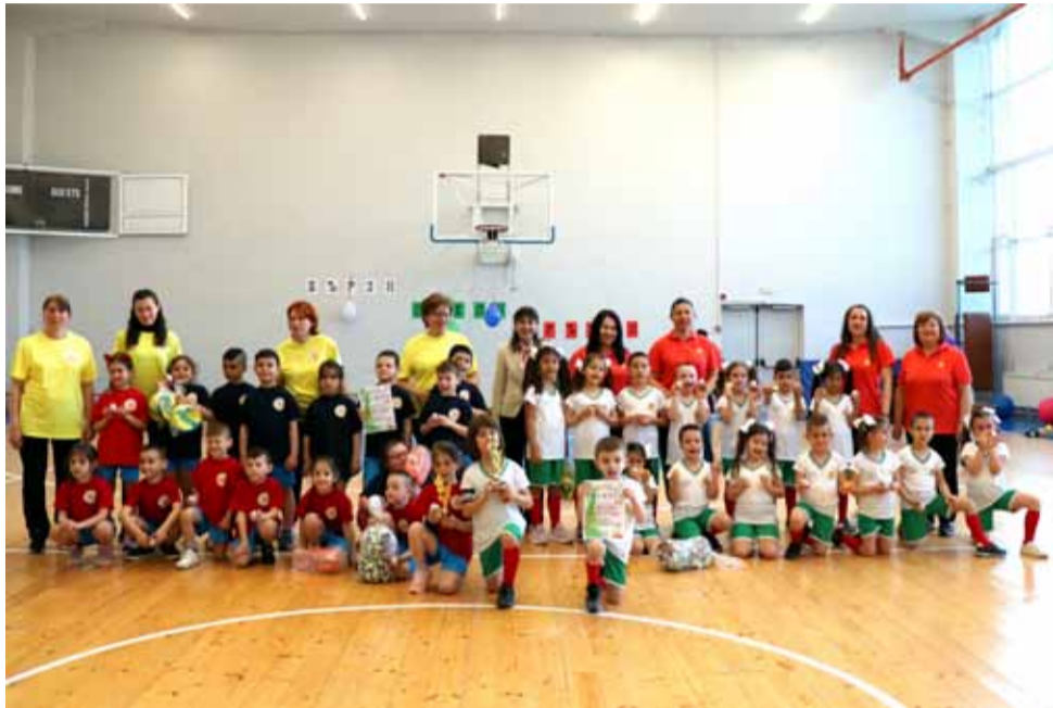
И тази година играта „Бързи, смели, сръчни“ донесе огромни усмивки по лицата на най-малките участници в Седмицата на спорта 2023 в град Генерал Тошево.

Трябва да се отбележи, че за втора поредна година децата се включват с огромно желание в игрите и дават всичко от себе си. Борят се, показват спортен хъс и имат голяма воля за победа. Накрая всички получават награди. Най-вече за това, че в този прекрасен ден победи масовият спорт, здравословният начин на живот, уважението и спортсменството между децата.