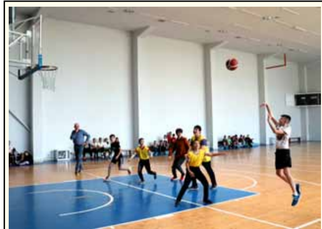
В турнира по баскетбол 3x3 имаше много оспорвани двубои.