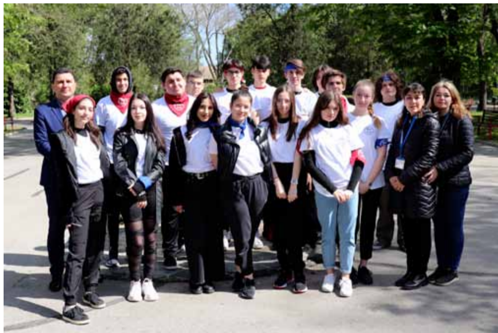
Деца от Общински младежки съвет, които се включиха в играта по спортно ориентиране.

Всички младежи останаха очаровани от играта и изразиха желание подобни прояви да бъдат организирани по-често. Те признаха, че участват за първи път в подобен род надпревара и са изпитали истинска наслада.