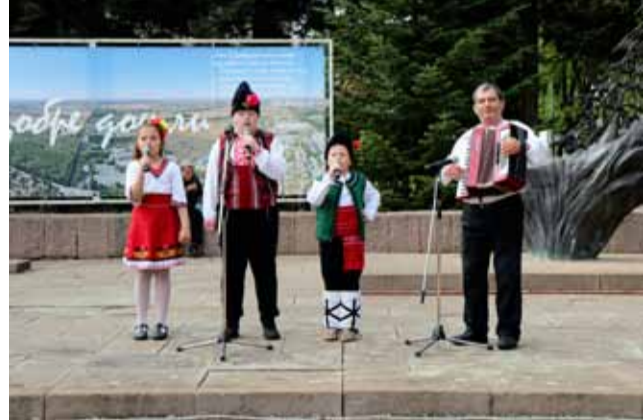
Малки и големи се забавляваха с поредното издание на Гергьовска люлка.