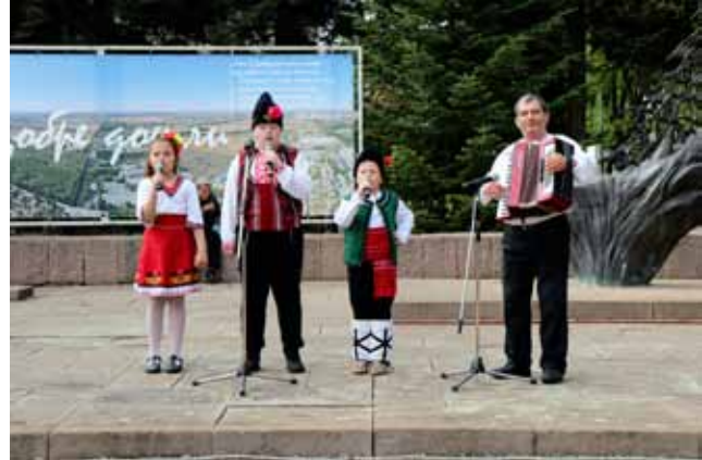
Малки и големи се забавляваха с поредното издание на Гергьовска люлка.

На 4 май на площад „Бялата лясовица“ в град Генерал Тошево се състоя ежегодното издание „Гергьовска люлка“, организирано от НЧ „Светлина – 1941“. В навечерието на Гергьовден малки и големи