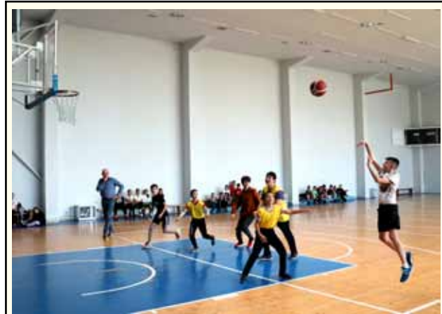
В турнира по баскетбол 3x3 имаше много оспорвани двубои.