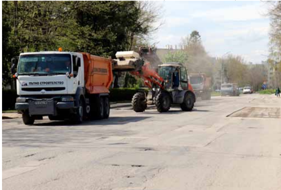
Ремонтът на булеварда в град Генерал Тошево вече приключи. Сега дейностите са съсредоточени на пътя за село Росица.

Културната проява има за цел проучване, популяризиране и съхраняване на традициите, обредността, обичаите и песните в добруджанския бит и е част от Културния календар на Община Генерал Тошево.