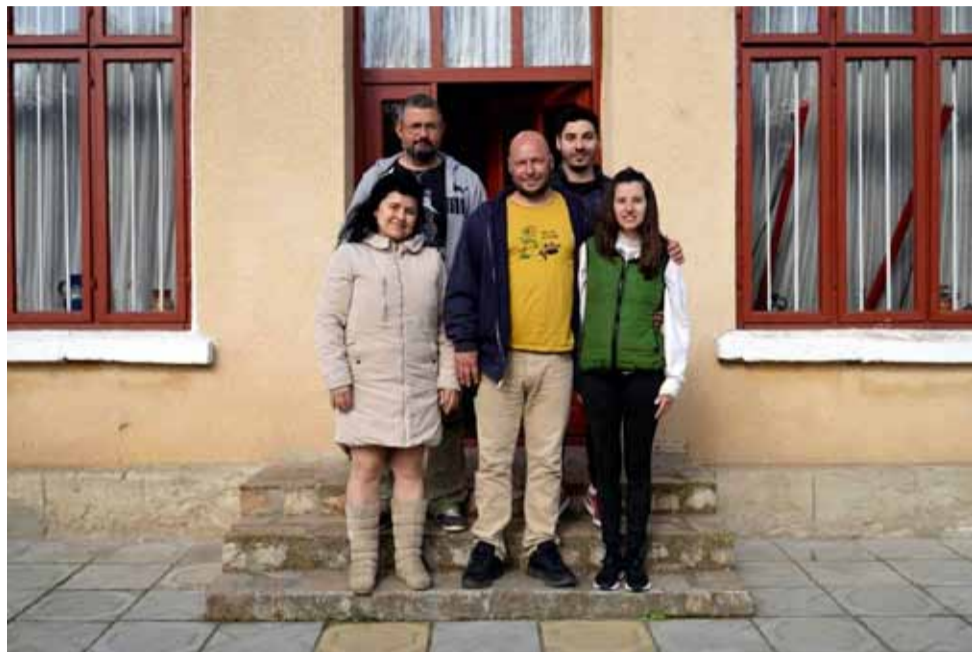
Част от участниците в тазгодишното издание на фотопленера.

Най-добрите снимки от пленера ще бъдат аранжирани в изложба и ще могат да бъдат разглеждани от жителите и гостите на град Генерал Тошево на село Красен. Датите на изложбите ще бъдат обявени допълнително.