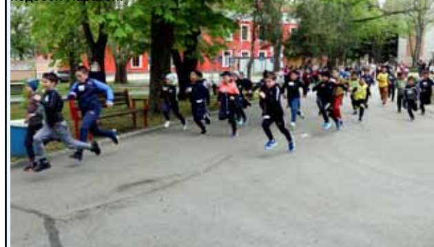
Най-масовата спортна активност – маратонът! В него се включиха над 450 ученици.

Най-радвашото от този маратон беше фактът, че децата пристигнаха с огромно желание за участие и въпреки лошото и дъждовно време, се включиха без притеснение в надпреварата. Всички пробягаха цялото трасе, без значение дали са сред първите или сред последните. Вълнението беше огромно, а това че някои от децата видимо бяха уморени и тотално изтощени след дългото бягане, не им попречи да обещаят, че логодина отново ще участват в подобен маратон.