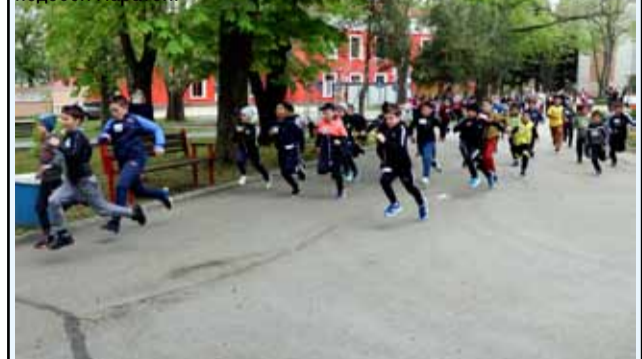
Най-масовата спортна активност – маратонът! В него се включиха над 450 ученици.

Най-радвашото от този маратон беше фактът, че децата пристигнаха с огромно желание за участие и въпреки лошото и дъждовно време, се включиха без притеснение в надпреварата. Всички пробягаха цялото трасе, без значение дали са сред първите или сред последните. Вълнението беше огромно, а това че някои от децата видимо бяха уморени и тотално изтощени след дългото бягане, не им попречи да обещаят, че логодина отново ще участват в подобен маратон.