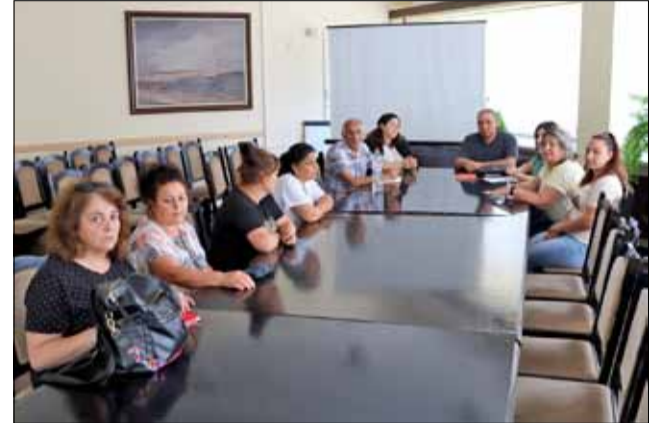
Момент от срещата.

РОМАКТ подкрепя механизмите и процесите на добро управление в съответствие с принципите на Съвета на Ев-