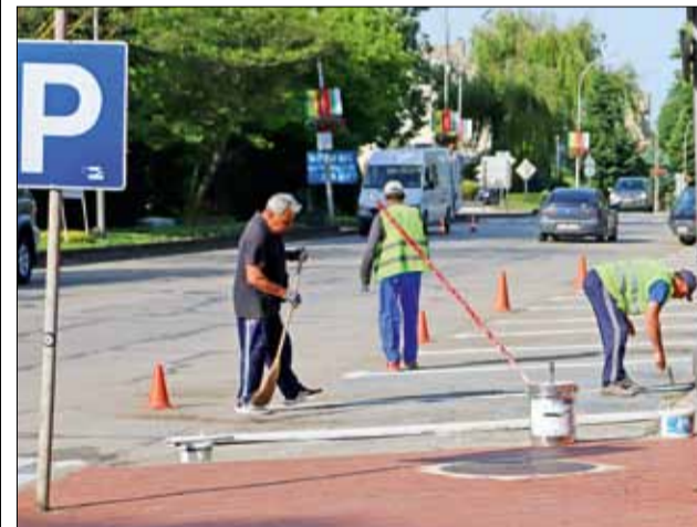
Работници освежават паркинга пред площад „Бялата лястовица“ в града.

От началото на месец май на територията на град Генерал Тошево се извършват дейности по ежегодното освежаване на пътната маркировка, с цел повишаване безопасността както на пешеходците, така и на водачите на МПС.