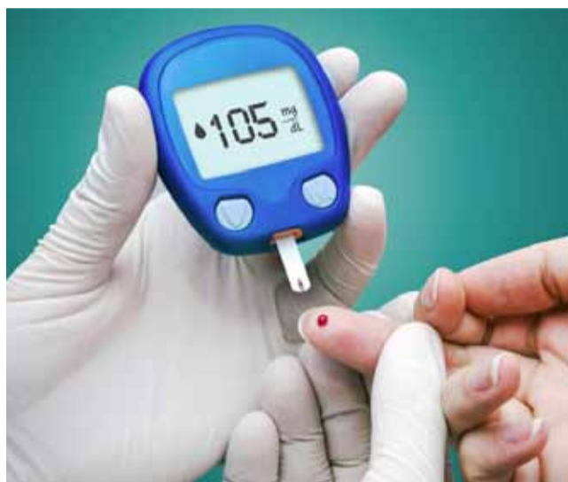
На 20 юни (вторник) от 08:00 до 12:00 часа пред аптека „Билка“ в град Генерал Тошево, ще се проведе безплатно измерване на кръвната захар.

Ще се оценяват език, стил и съдържание; свързаност с проблематиката за земята, труда на хората и Добруджа; последователност/логика на изложението; динамика на повествованието; умение да се изграждат характери и