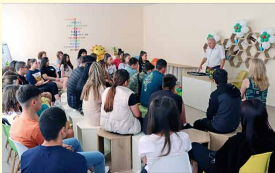
Георги Балабанов спечели вниманието на учениците с емоционалните си разкази

то тематична насоченост и при интерпретацията на проблематиката от българското селско битие. Те доставят естетическа наслада и ни убеждават да бъде по-проницателни и да се вглеждаме в човешкия си космос. Във всеки един от разказите му бие и пулсира съвестта на всеки от нас. Съвест, която поставя на везните измеренията на сторените от нас дела.