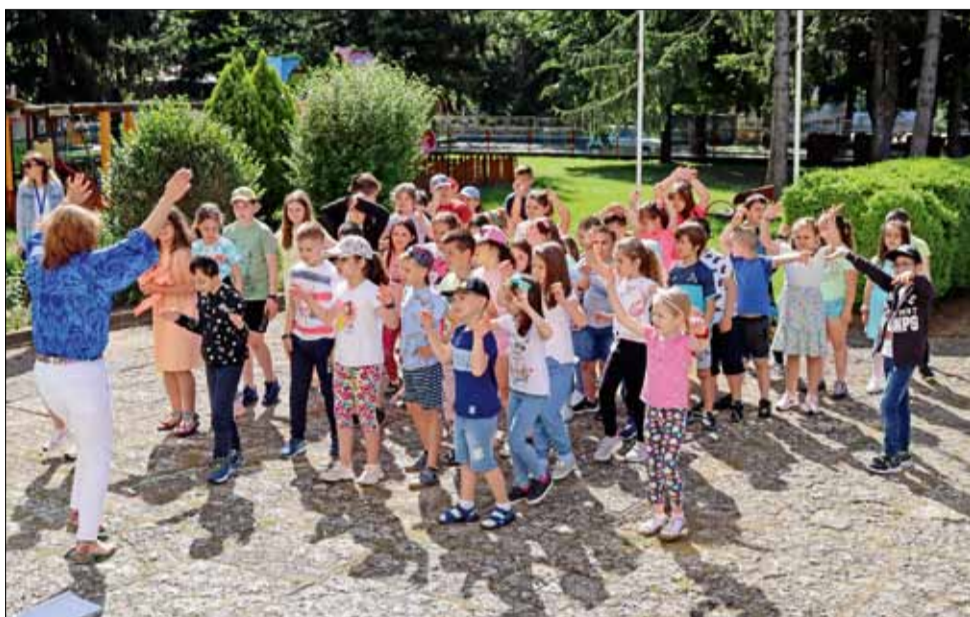
Лятна академия „Патиланци“ отвори врати за поредното незабравимо лято.

Програмата LEADER е програма на ЕС за безвъзмездна помощ, която подкрепя селските общности да станат по-добри места за живеене и работа. Следващата програма LEADER ще започне към края на 2023 г. и ще продължи до 2027 г. и ние се стремим да надградим постиженията от изпълнението на предходната програма. На МИГ „Балчик – Генерал Тошево“ предстои да бъдат отпуснати около 7 милиона евро в полза на общностите и бизнеса в целия окръг.