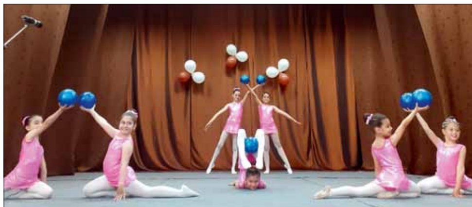
Празникът в квартал Пастир донесе много усмивки и настроение на присъстващите.

жиха традицията да създават, опазват и разпространяват духовните ценности, да развиват творческите способности и да задоволява културните потребности на населението и неговите интереси.