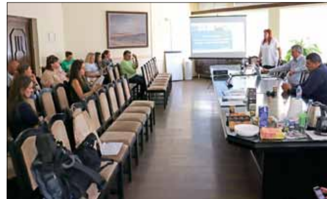
Важна среща за бизнеса с експертите от „МИГ Балчик – Генерал Тошево“.

Лятна академия „Патиланци“ цели пълноценно осмисляне на свободното време на малчуганите през летните месеци. Това ще се постигне чрез забавления и обучения, повишаване на общата екологична култура, обществена ангажираност, придобиване на знания за здравословния начин на живот, в областта на етнографията, историческото минало, флората и фауната на Добруджа, изящните и приложни изкуства, запознаване с българската и световна детска литература.