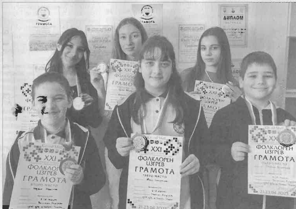
Нашите деца са най-талантливите...

Фестивалът във Варна „Фолклорен изгрев“ е поредната солидна музикална сцена, от която нашите млади изпълнители се прибират с отличия за чудесното си представяне.