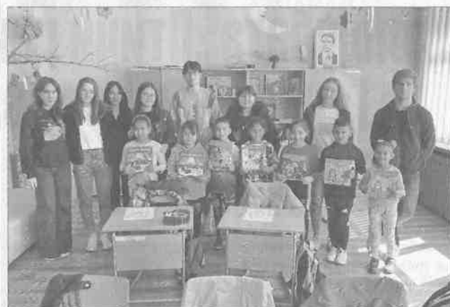
Малчуганите бяха зарадвани с детски книжки с приказки.

Младежите от СУ „Никола Й. Вапцаров“ и ПГ по земеделие „Тодор Рачински“ посетиха първокласниците на ОУ „Христо Смирненски“ и СУ „Никола Й. Вапцаров“ и им подариха цветни книжки с приказки. Същите изненади получиха и възпитаниците на детските градини „Първи юни“ и „Пролет“ в града. Книжките бяха придружени