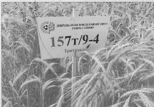
Тритикале – сорт „Андроник“.