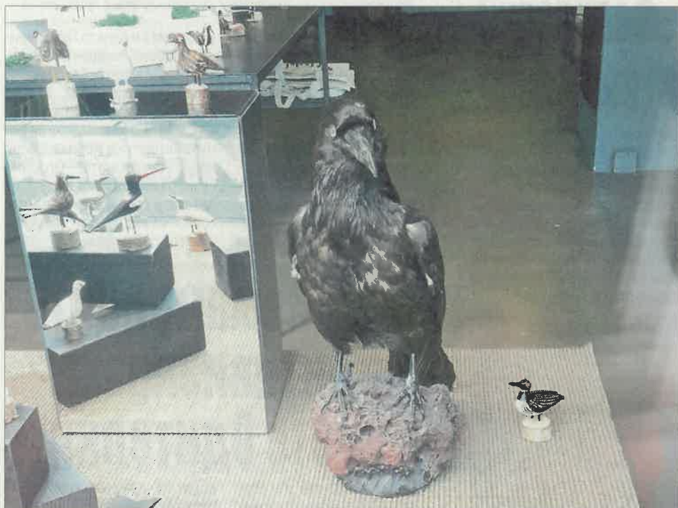
Деца ще се зарадват на богатото разнообразие от препарирани птици, които ще бъдат изложени в музея.

Гостуващата изложба ще покаже над 30 вида птици. Всеки посетител ще получи и сувенир за спомен. Откриването ще бъде в Нощта на музеите 2023 година на 13 май от 17.00 часа. В съботния ден музеят ще работи за всички жители и гости на нашия град до 23:00 часа. Самата изложба ще гостува в Исторически музей до края на месец юли.