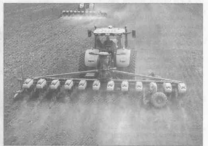
Сеитбата изостава, но стопаните не са притеснени.

Наблюденията му показват, че пшеничните посеви дори са напред във развитието си.