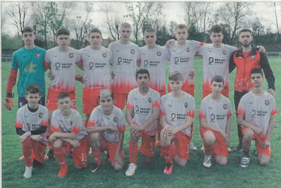
Младежите на „Спортист – 2011“ които сразиха лидерите в групата с лекота.

Успехи в оставащите четири двубоя, една трудна но определено не и непосилна задача, ще гарантира на тима място в четворката, а това ще бъде отлично класиране и много добра основа за началото на новият сезон през есента.