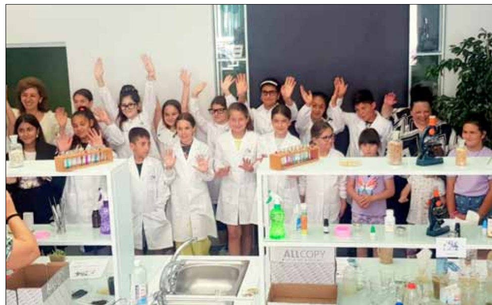
Момент от един от най-интересните уроци – този в лабораторията.

Кандидат-стипендиантите могат да подават документи по реда на Наредба за отпускане на стипендии на студенти от община Генерал Тошево в срок от 1 юли до 31 август 2023 г. Целта на тази инициатива е да се подпомогнат и стимулират младите хора в общината, както и да им се даде възможност да работят в Генерал Тошево и бъдат в полза на обществото.