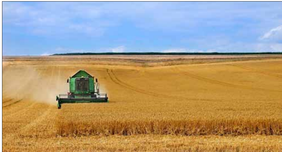
Тази година добивите от пшеница не са чак толкова добри.

В момента докторантите в Добруджански земеделски институт – Генерал Тошево са деветима. При двама от тях скоро се очаква успешна