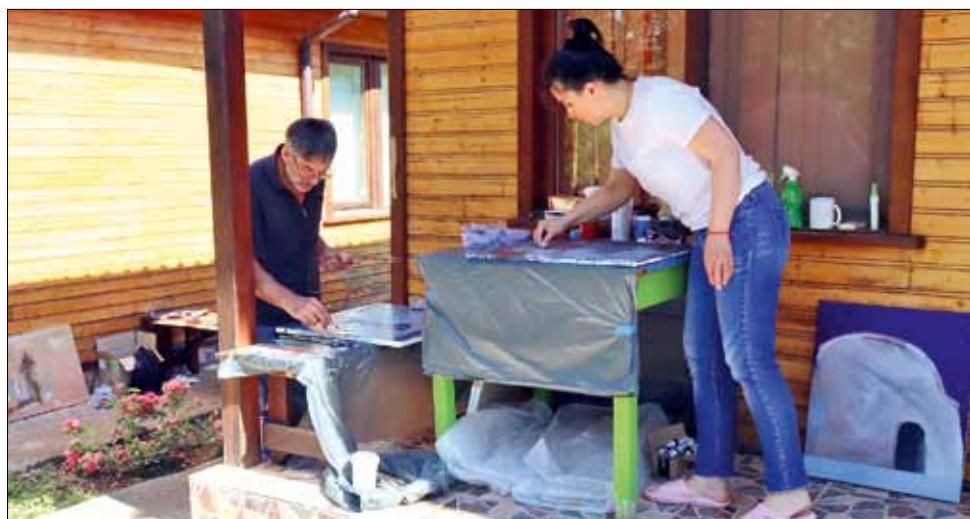
И през тази година художници от цяла България се събраха в село Красен, за да сътворят своето магическо виждане за Добруджа.

Основната идея на пленера е да се подобри градската среда