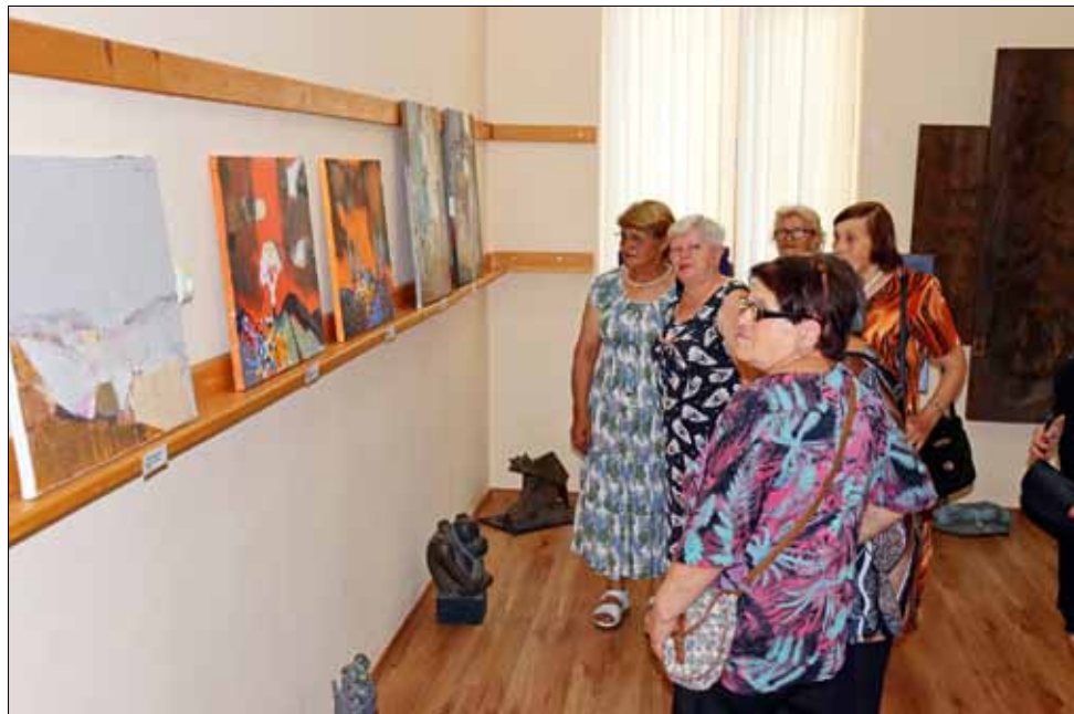
Изложбата може да бъде разгледана до края на месец август.

Авторите на платната споделиха, че природната сила и митологична история, с които е заредено село Красен, са дали отправните посоки, по които всеки е изградил своите творби. Друга линия, която е водила авторите в техните художествени търсения, е разглеждането на връзката с природното като повод за използване на нови изразни средства, на език, различен от обичайните представи за живописване. Това е и един вид стимул да се подходи към живописа с алтернативни, природни материали, да се експериментира и да се намират нестандартни решения.