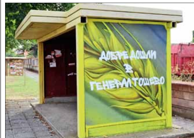
Спирката на е красиво изрисувана и приветства жителите и гостите на града ни с „Добре дошли“.

ка, която се намира на главната улица „Димитър Благоев“, точно срещу супермаркет „Астра“. Спирката беше красиво изрисувана със житни класове и слънчогледи от двете страни. На влизане в града от Добрич, се чете надписът „Добре дошли в Генерал Тошево“ на фона на златисти житни класове, а в обратна посока жителите и гостите на града могат да видят картина със слънчогледи, от която авторът пожелава „Приятен път *** Генерал Тошево“.