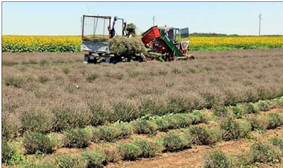
Жътвата на лавандула започна, а притесненията на стопаните са все същите.

на до сега са развалени близо 40 000 дка с лавандула. Според данните на Областна дирекция „Земеделие“ в област Добрич през миналата година е имало 70 000 дка с лавандула. За сравнение, по време на бумът на етерично-маслената култура, засетите площи надминаха 160 000 дка.