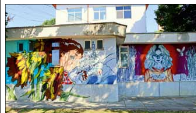
В петък (до редакционното приключване на броя) фасадата на Медицинския център все още не беше напълно готова.

на Генерал Тошево, като се облагоурият и социализират някои по-неглижирани нейни части чрез съвременни и нестандартни форми на графичното изкуство, съобразени с околната среда, природните дадености и културните традиции на общината. По този начин могат да се стимулират творческите търсения на младите творци от региона, чрез възможност за активна творческа работа, която да популяризира община Генерал Тошево като място с атрактивна градска среда, богато културно-историческо наследство и възможности за бъдещо развитие.