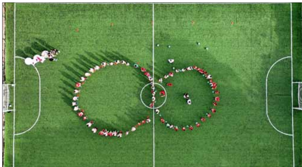
Специален поздрав за Камата от децата от детско-юношеската школа на „Спортист 2011“.