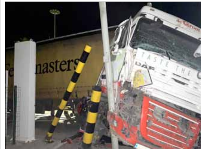
Цяло чудо е, че няма пострадали при тази катастрофа.

образена скорост се удари в съоръжение за отчитане и измерване на радиация, намиращо се на територията на граничния пункт. Вследствие на инцидента са нанесени значителни материални щети.