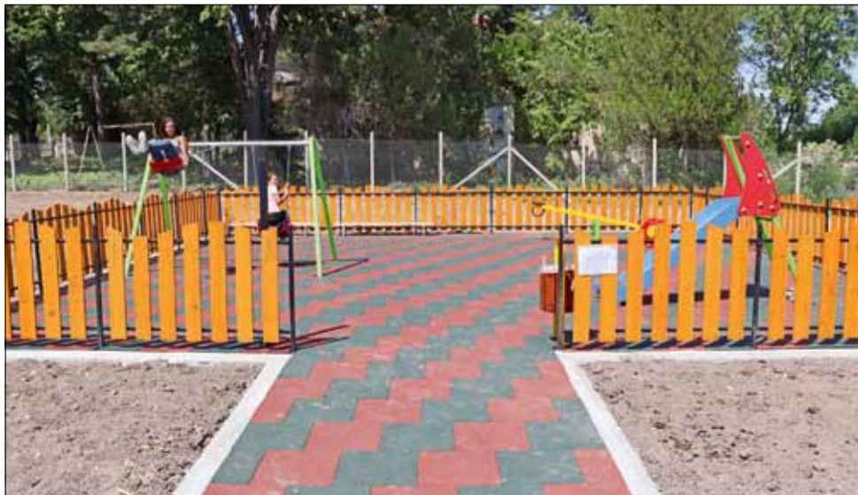
Деца в село Росица вече се радват на новата площадка.

рано, едната му част вече е брутално изкътрена. В тази връзка Община Генерал Тошево още веднъж призовава жителите и най-вече децата и подрастващите да пазят обособените за игра кътове в града и селата от общината, като при нередности и прояви на вандализъм да сигнализират в местната администрация.