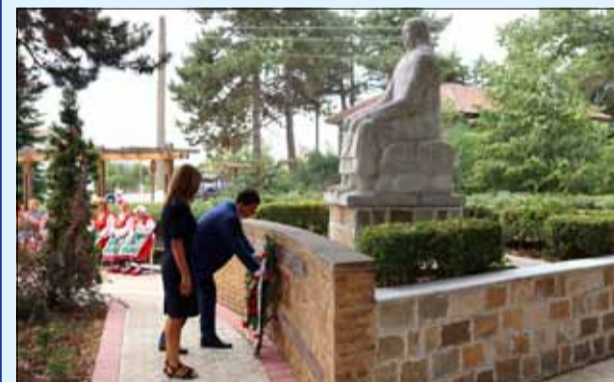
Поклон пред насилствено отвлечените и убити добруджанци.

На 15 август 1916 г. започва варварският геноцид над българите от Добруджа от страна на румънските окупатори. В периода 15-28 август румънската армия отвлече между 35 000 и 40 000 добруджанци, без оглед