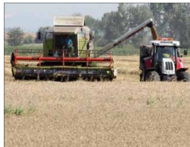
Средният добив тази година е по-нисък в сравнение с миналогодишния.

От Областната дирекция съобщават, че коситбата на лавандула също е окончателно приключила. Ожънати са общо 42 770 дка. Средният до-