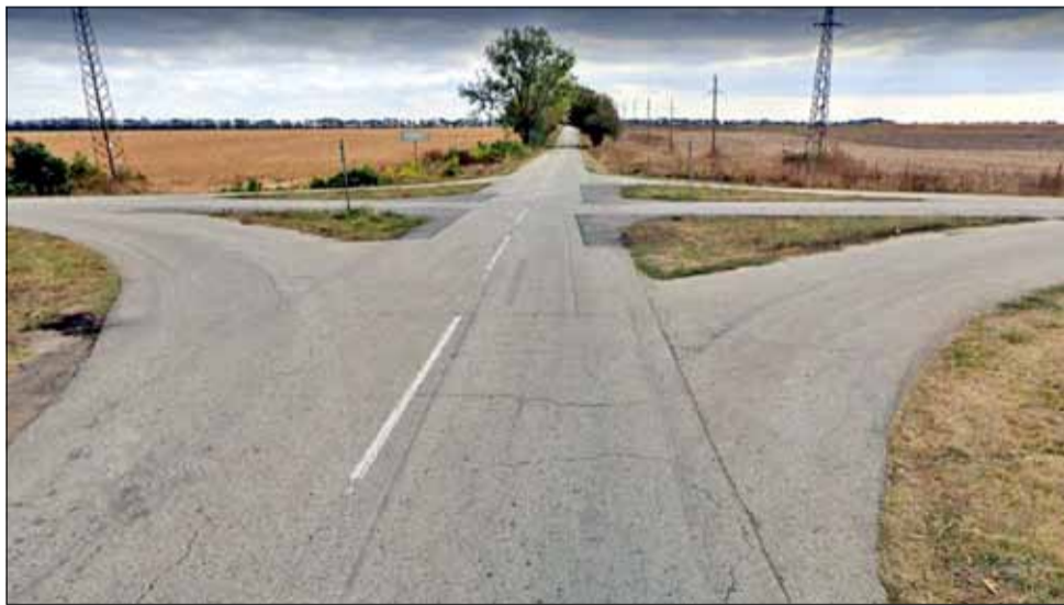
Това е опасното кръстовище, за което отдавна има идея да се направи с кръгово движение.