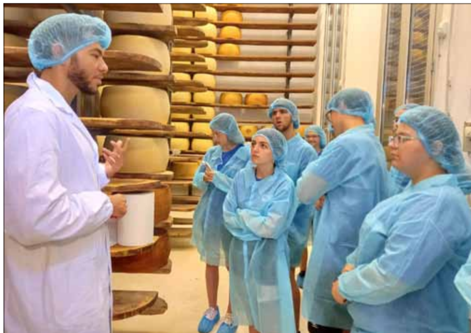
Учениците от ПГ по земеделие „Тодор Рачински“ ще имат един незабравим спомен от гостуването си в Италия.

ния. Децата останаха очаровани от посещенията си в градовете Милано и Венеция, от където със сигурност са съхранили незабравими спомени.