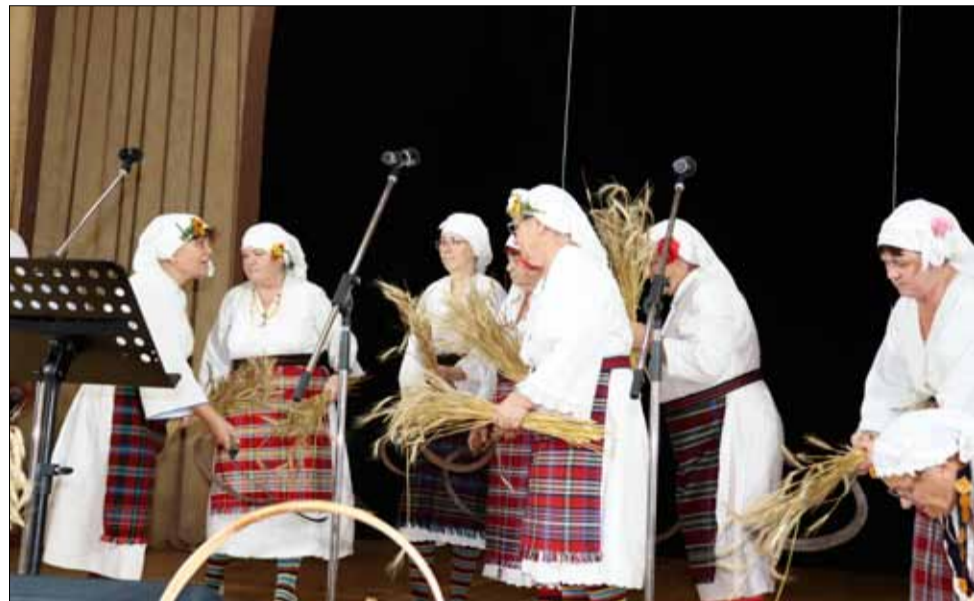
Празникът започна с ритуал по разжъване, изпълнен от местните самодейци.

Добивите от ранните пролетни култури грах и леща са много добри. Средният добив от пшеница е 505 кг/дка, от ечемик – 380 кг/дка, тритикале – 380 кг/дка, овес – 320 кг/дка, грах – 276 кг/дка и леща – 172 кг/дка. От отглежданите в биологични условия ръж и лимец са пожънати съответно 379 кг/дка и 303 кг/дка.