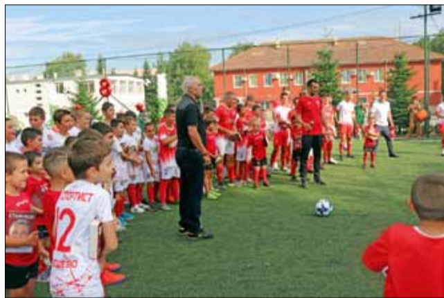
Незабравим момент за всички деца – Христо Стоичков изпълнява поредната си неспасяема дузпа.

то Стоичков! Онзи същият, който през лятото на далечната вече 1994 година вдигна цялата държава на крака, накара я да вярва, да мечтае и да плаче със сълзи от радост. Онзи, който тогава гласно заяви името си, показва се на света и от тогава до днес във всяко кътче на света България е свързвана с него – с Христо Стоичков. И не, това не са митове и легенди, това си е самата истина. Също както е истина, че Христо Стоичков е абсолютна легенда.