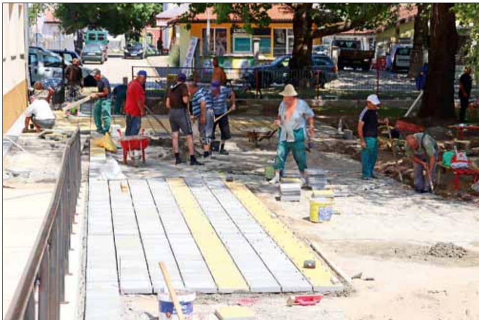
Работниците се трудят усилено по полагането на новия плочник.

Целият проект е на стойност 291 602 лв. с ДДС, като финансирането на страна на Проект „Красива България“ е в размер на 119 557 лв., а частта за съфинансиране от страна на Община Генерал Тошево е 172 045 лв.