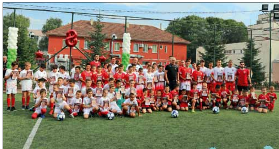
Всички млади таланти получиха за спомен биографичната книга на Христо Стоичков, лично разписана от него.