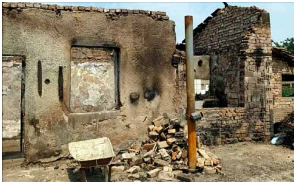
Къщата е тотално унищожена от огнената стихия.

Предстои да бъде преведена и финансова помощ от Община Генерал Тошево, гласувана на заседание на Общинския съвет.