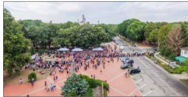
Тази снимка от небето показва само малка част от опашката, която се изви и чака в продължение на повече от четири часа за автограф и снимка с Ицо.

В 18:00 на площад „Бялата ляховица“ започна официалния брифинг за медиите. Носителят на Златната топка на списание „Франс Футбол“ за най-добър футболист в света за паметната 1994 година подари на Община Генерал Тошево умален дубликат на престижната награда. А истинската, с всичката си прелест, през цялото време стоеше величествено до Христо Стоичков. След това над 1000 човека в