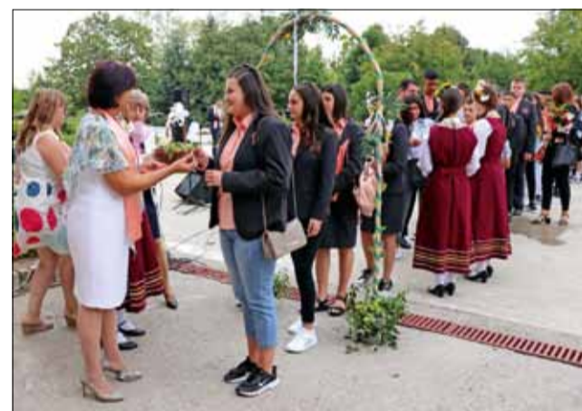
Професионална гимназия по земеделие „Тодор Рачински“ в града прие 294 ученици за новата учебна година.