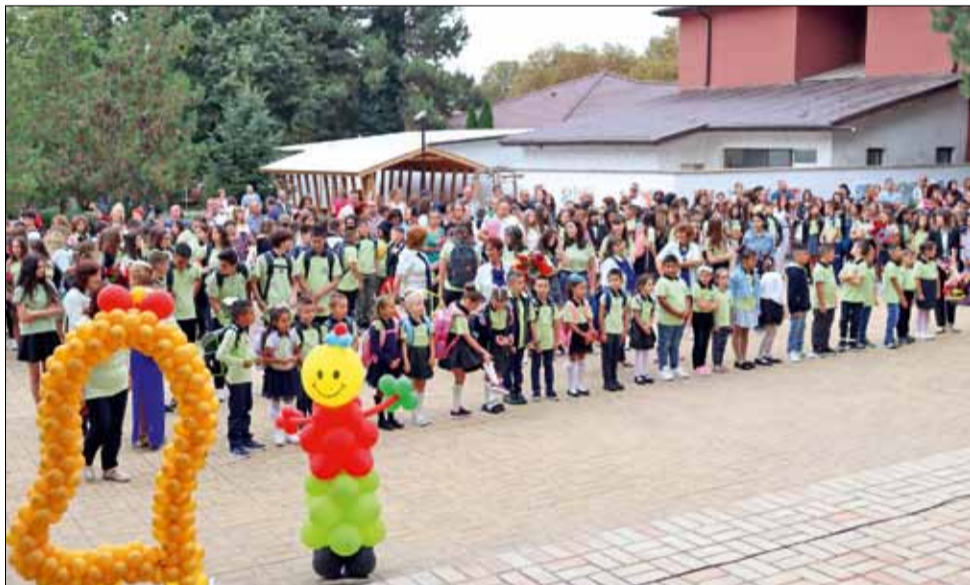
Много емоционален за всички беше първият учебен ден в СУ „Никола Й. Вапцаров“.