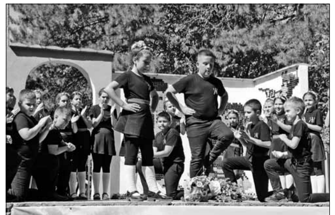
Деца от ДТШ „Жътвари“, град Добрич, бяха атракцията на празника в село Сноп.

Самодейците при НЧ „Васил Левски“, село Сноп откриха празника, а след тях на сцената се качиха няколко гостуващи фолклорни групи. Кулминацията на събитието беше представянето на талантливите танцьори от Детска танцова школа „Жътвари“, град Добрич.