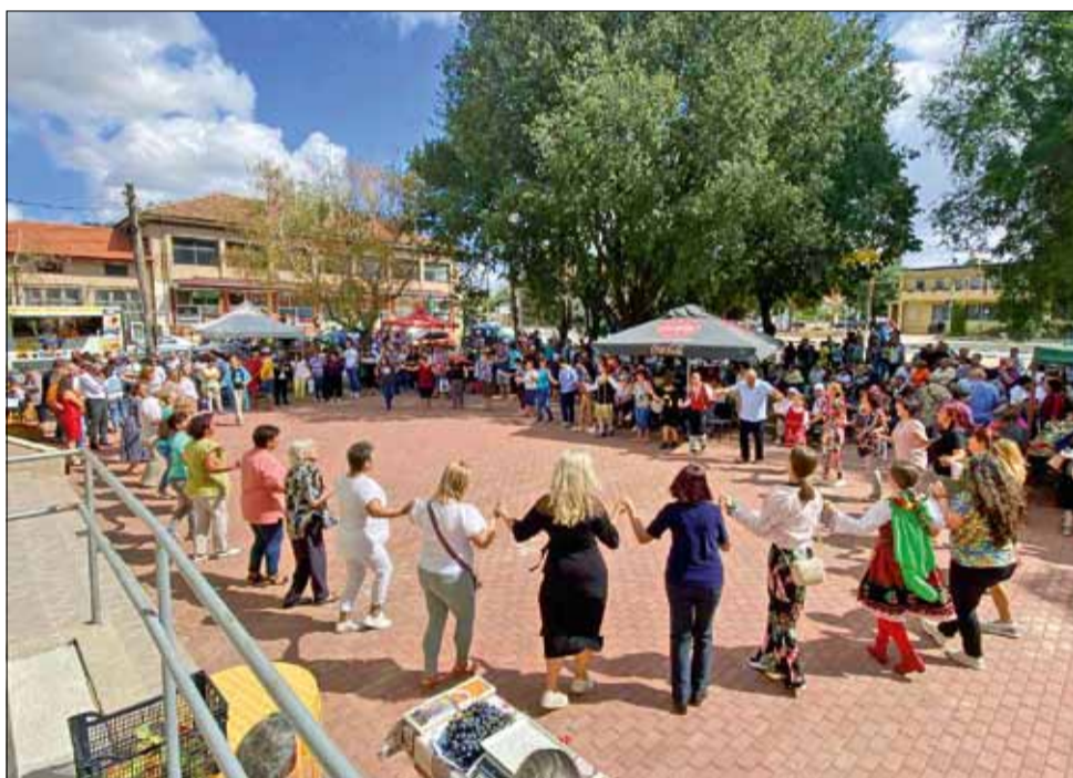
Чуден празник в село Кардам.

то настроение на всички присъстващи, а хората, които се виеха на площада пред културната институция бяха безкрайно дълги.