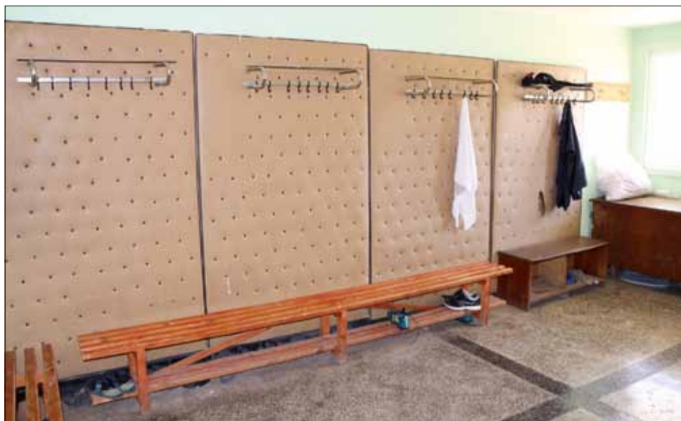
Така изглеждат в момента съблекалните на стадион „Спортист“. След ремонта те ще бъдат изцяло обновени.

„Спортист“. Той включваше основен ремонт на външната част на сградата и козирката на съоръжението, както и обновяване на трибуната, където бяха поставени нови пластмасови седалки.