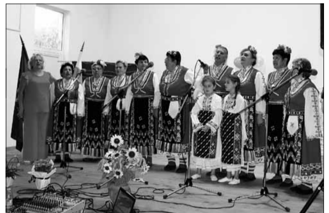
Хубав фолклорен празник си спретнаха хората в село Росен.