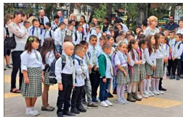
166 ученици прекрачиха прага на ОУ „Христо Смирненски“, град Генерал Тошево на 15 септември. 20 от тях тази година са първокласници и за първи път чуват училищния звънец.

ПГЗ „Тодор Рачински“, град Генерал Тошево – общо 294 ученици.