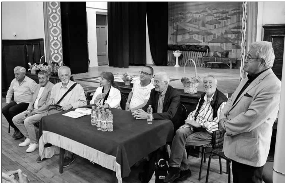
Разговорите с именитите български творци бяха истинско удоволствие.

Организаторите на събитието правят всичко това с плам и жар, защото добре осъзнават, че е изключително важно със своето слово да се борят за съхранението на българската национална идентичност, опазването чистотата и духовната енергия на българския език и най-вече да пазят националната историческа памет, защото са убедени, че народ, който не пази своята историческа памет, няма бъдеще.