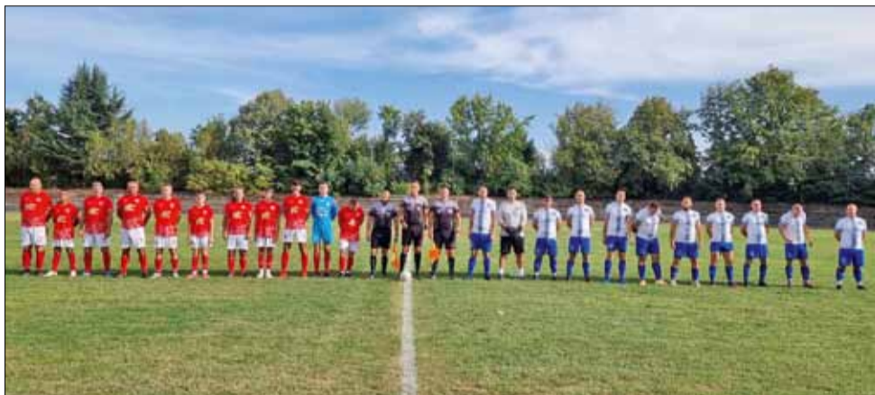
Дербито между двата отбора от град Генерал Тошево предложи безброй интересни моменти.

Другите общински отбори в групата допуснаха поражения в своите двубои. "Дружба" загуби с 1:3 домакинството си на "Орловец - 2008" (Победа), а "Партизан" отстъпи у дома с 0:4 от "Заря - 2006" (Крушари).