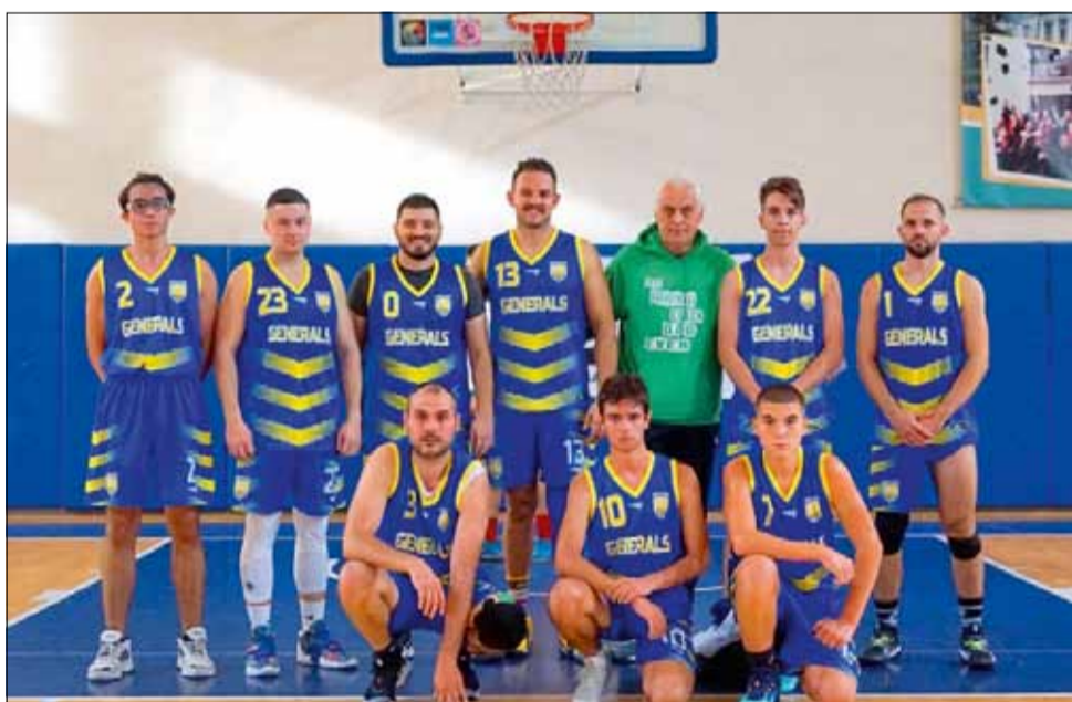
Мъжкият баскетболен тим на „Спортбаскет ГТ“ преустанови участието си в ББЛ.

Все пак от клуба разкриха, че две-три момчета от нашия