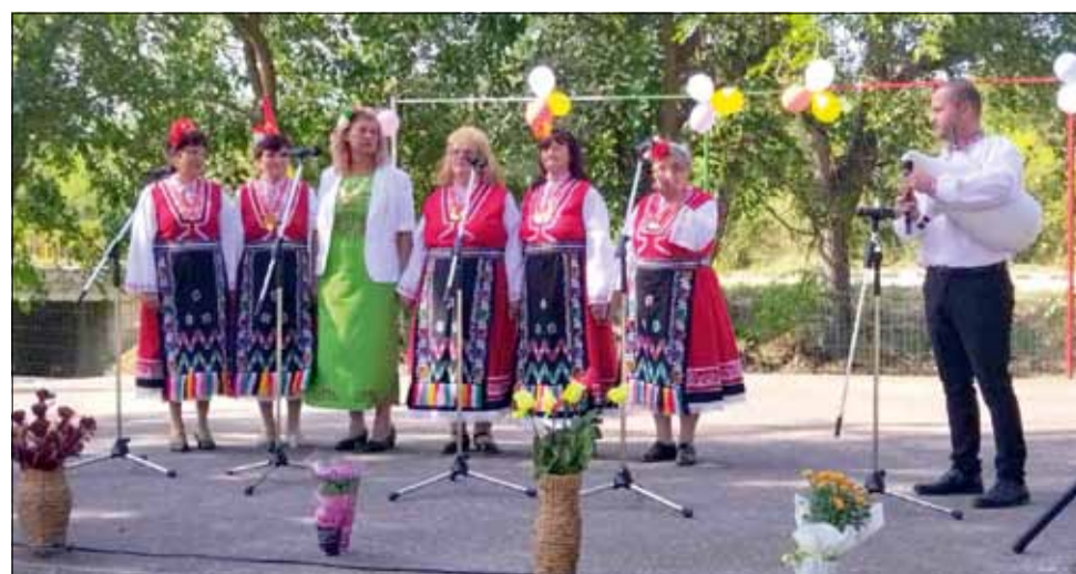
На празничния 22 септември НЧ „Съединение – 1943“, село Изворово отпразнува своя 80-годишен юбилей.

Преди 1940 г. в селската кръчма в малка стая до бръс-