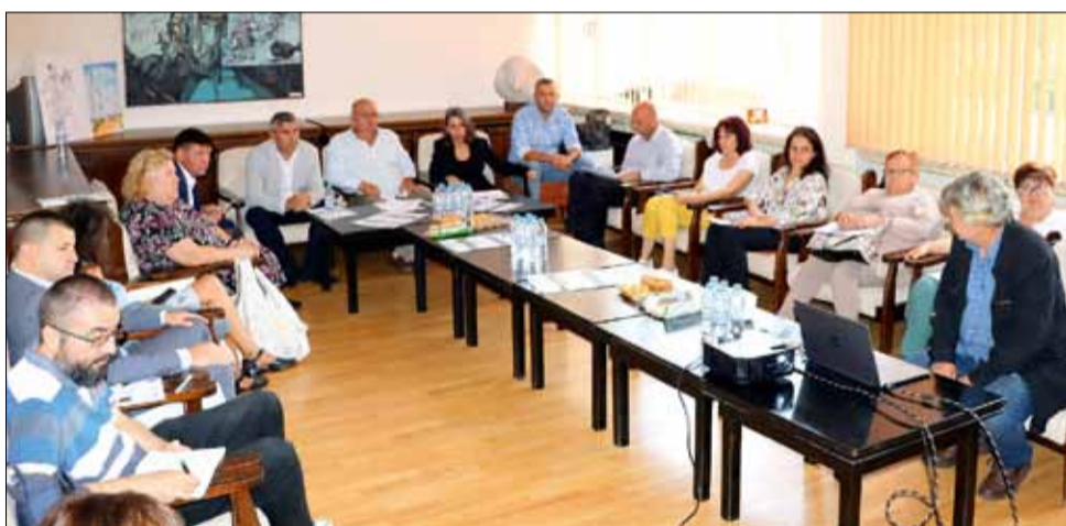
Заключителна пресконференция по проект „Развитие и популяризиране на общото наследство“, в присъствието на гости от Болград и Мурфатлар.

Проектът „Развитие и популяризиране на общото наследство“, BSB1010 по Съвместна оперативна програма по ЕИС „Черноморски басейн 2014-2020“, който се реализира в сътрудничество между Община Генерал Тошево, Общински съвет Болград, Украйна и Община Мурфатлар, Румъния има за цел да ускори регионалното и трансграничното развитие, което ще доведе до ефективно и отговорно използване на природни, културни и исторически ценности и развитие на алтернативни форми на туризъм. По този начин ще се създадат условия за устойчиво социално-икономическо развитие и просперитет на черноморските крайбрежни общности.