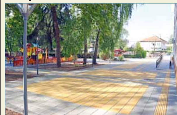
Дворът на ученическото общежитие става все по-хубав с приближаването на края на ремонтните дейности.

Ремонтът в двора на ученическото общежитие, който започна в началото на месец август, вече е към своя край. Строителните дейности вече са изпълнени на 90%, като остава единствено да бъде репатрирана изцяло асфалтовата настилка на паркинга от задната страна на сградата и да бъде положен нов пласт асфалт и бордюри.