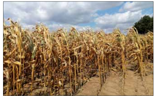
От подобни полета с царевица земеделците няма как да очакват големи добиви.

Вече втора седмица върви и жътвата на царевица в областта. Данните обаче остават сравнително ло-