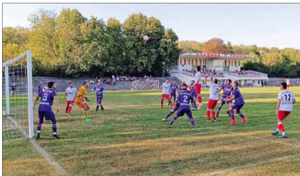
Седмица след градското дерби между тимове на „Спортист“ и „Спортист 2011“, дойде ред и на първото общинско дерби в групата – това между „Спортист 2011“ и „Дружба“, което завърши без победител.

В следващия кръг ще се изиграят две общински дербита. „Спортист“ приема „Дружба“ в Генерал Тошево, а „Партизан“ е домакин в село Василево на „Спортист 2011“. Двубоите са съответно на 30 септември (събота) и 1 октомври (неделя) от 16:00 часа.