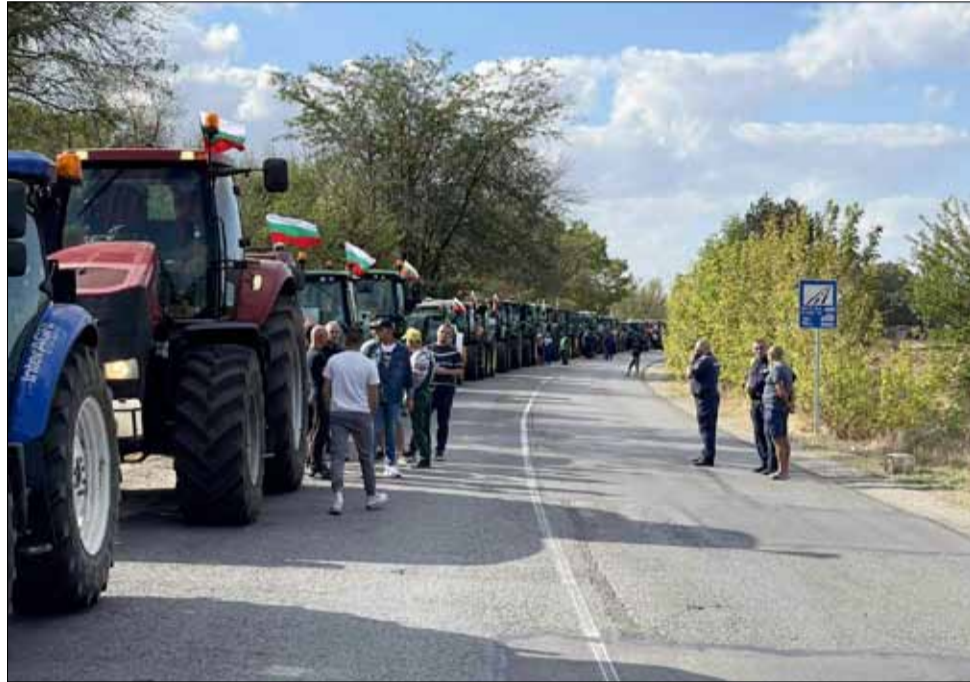
В рамките на три дни земеделски производители блокираха за няколко часа пътя между село Кардам и граничния пункт с Румъния. В крайна сметка националният протест даде резултат и протестните действия спряха.

След като официално бяха оповестени взетите решения голяма част от протестиращите останаха значително удовлетворени и обявиха, че прекратяват националната стачка. Земеделците обаче бяха категорични, че ако напред ситуацията отново се промени в негативна за тях посока, тогава те направо ще блокират столицата и важни пътни артерии в страната с тежка техника.