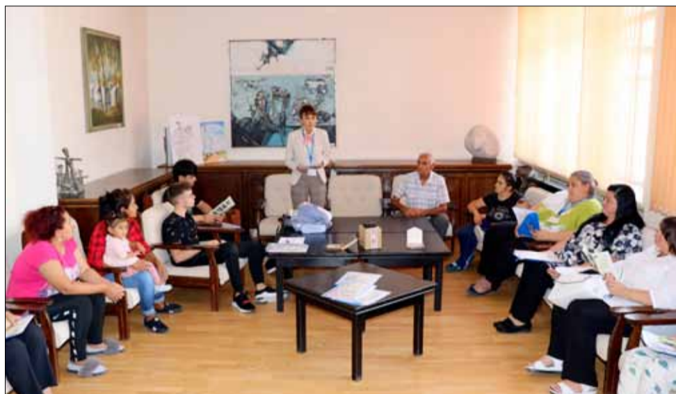
Заключителна пресконференция по проект „Заедно можем да продължим“.

доставяне на интегрирани услуги за ранно детско развитие. Проектът стартира през месец май 2016 г. и сега, седем години по късно, той приключва официално.