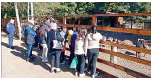
Децата с радост посетиха зооцентъра в Добрич.

та програма на третото издание на Детско полицейско управление, което се провежда вече трета година в училището в село Спасово. Инициативата е на Районно управление, град Генерал Тошево и се реализира съвместно Община Генерал Тошево и местното училище.