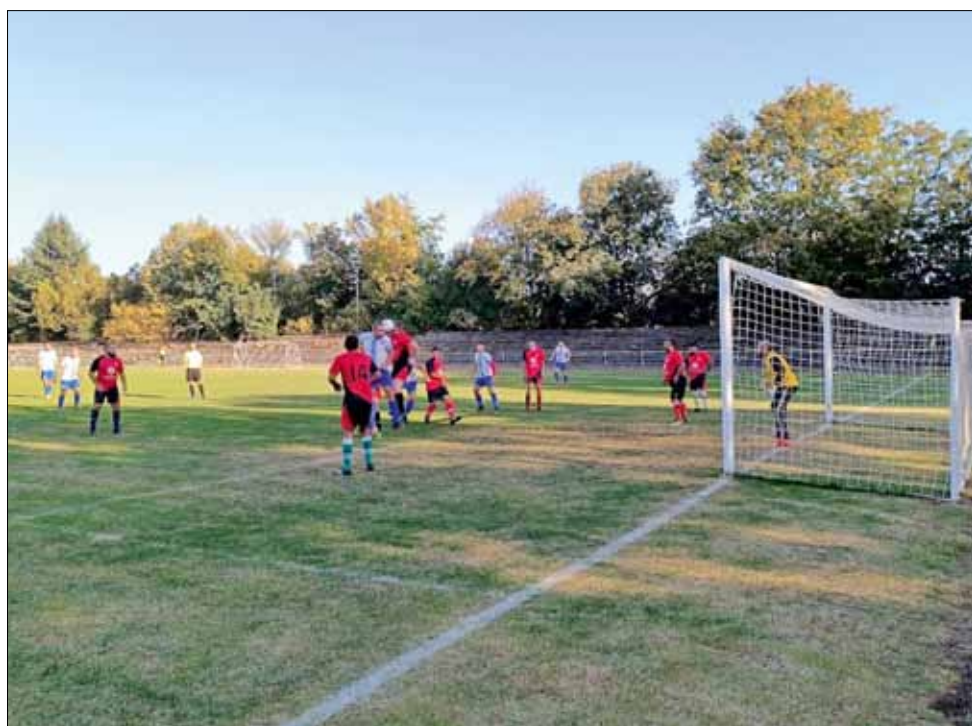
Нови емоции предложи поредният кръг от първенството по футбол в областта.

В следващия кръг, който ще се играе на 21 октомври (събота), „Спортист 2011“ ще бъде домакин на „Калиакра“ (Каварна), „Спортист“ гостува на „Добруджанец“ (Овчарово), „Дружба“ приема „Хр. Ботев“, а „Партизан“ е домакин на „Добруджа 1919 – 2“. Всички срещи са с начален час 16:00.