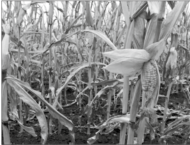
Царевицата пострада най-много от сушата това лято.

Каварна, Шабла, Балчик и град Добрич, жътвата е приключила. Най-назад в прибирането са в община Крушари, където са реколтирани малко повече от 1/3. Средният добив от слънчоглед в областта за момента е 170 кг/дка. Единствено в община Тервел средни-