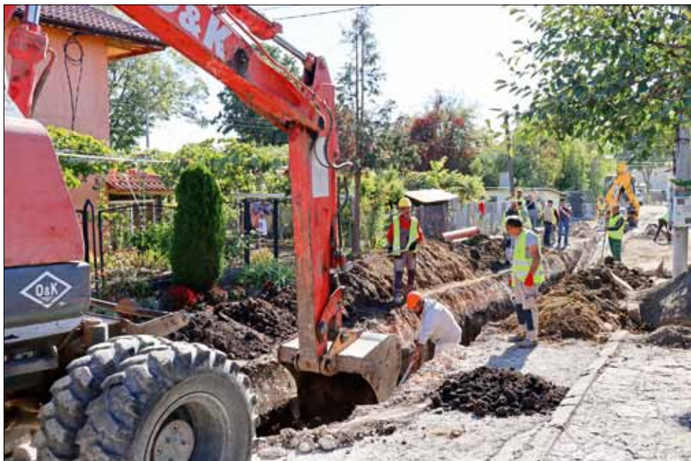
Първата улица, която беше разкопана за полагане на канализация е „Леонти Бакларов“.

Изграждането на канализация по трите улици е поредното инфраструктурно подобрение в града в рамките на последните няколко години. Подобни дейности вече бяха реализирани на улиците „Васил Алексиев“, „Иван Вазов“, „Васил Априлов“, „Никола Зидаров“, „Пеньо Пенев“, „Пейо Яворов“ и „Константин Кисимов“.