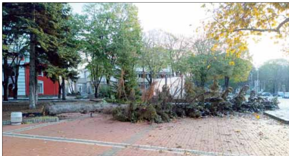
Този огромен бор в центъра на града беше съборен от ураганния вятър.

Въпреки тежката обстановка най-важното е, че няма информация за сериозно пострадали хора от паднали дървета или нестабилни постройки, както и сериозни материални щети.