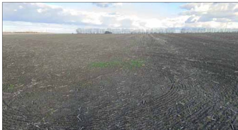
Тана изглежда в момента едно поле с пшеница. На съвсем малки места има покълнали зелени стръкчета.

Намалението на цената на тези продукти няма да е за сметка на качеството, уверяват от министерството.