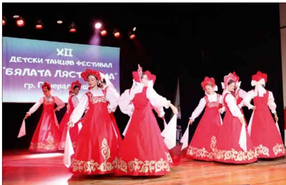
Много талантливи деца показаха магията на танца пред местната публика.

В крайна сметка всеки от нас всеки си мечтае да прекара една „бяла Коледа“ със семейството и най-близките.