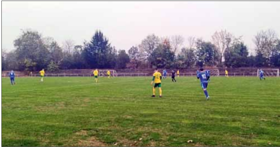
Много емоции, напрежение и хубав футбол предложиха двубойте в областната група през изминалия уикенд.

Всички останали срещи от този кръг, които бяха насрочени за неделния ден, бяха отложени заради влошената метеорологична обстановка в област Добрич.