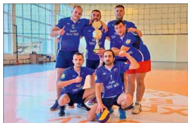
Отборът на „Спортист - 99“ спечели турнира в Балчик.

В другия полуфинален двубой отборът на „Локомотив“