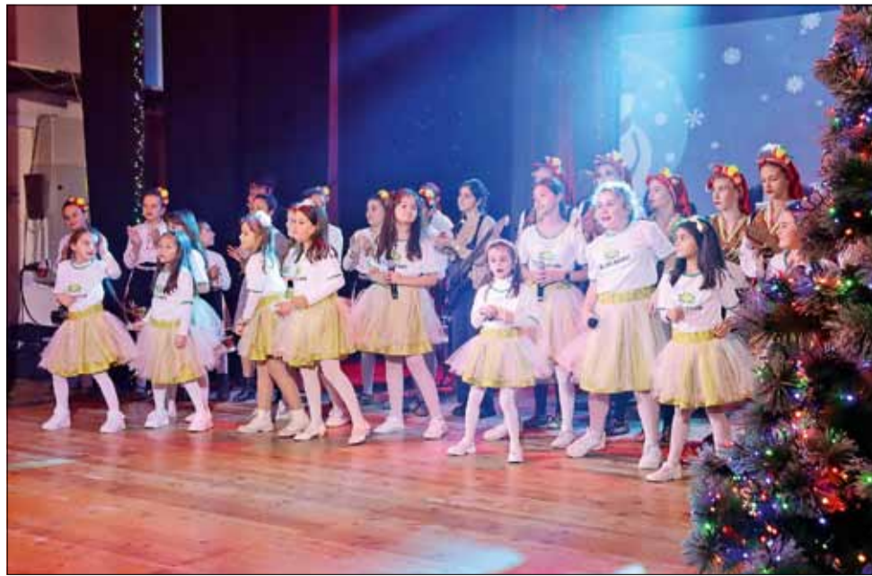
Концертът беше красив подарък за всички жители и гости на града ни преди светлите празници.

Празничният концерт на НЧ „Светлина – 1941“ „Коледна приказка“ беше изпълнен с великолепно настроение, много усмивки и безброй вълшебства. За поредна година културната институция представя отлична продукция за всички жители и гости на китното ни градче.