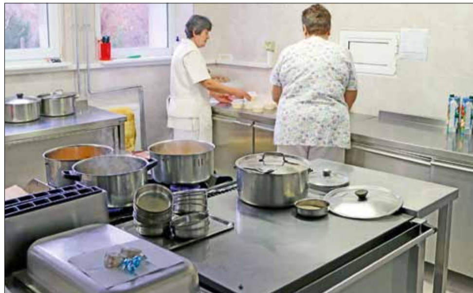
Детската млечна кухня ще приготвя обедно хранене с ваучери за деца в риск.

Партньорството на Община Генерал Тошево с Агенцията за социално подпомагане по проект "Детска кухня" е поредният голям принос на местната власт в посока следваната социална политика за смекчаване на бедността и намаляване на последиците от нея в общината. Освен подпомагането с храна, най-нуждаещите се лица ще получат подкрепа, за да се намери най-правилният път за повишаване качеството им на живот.