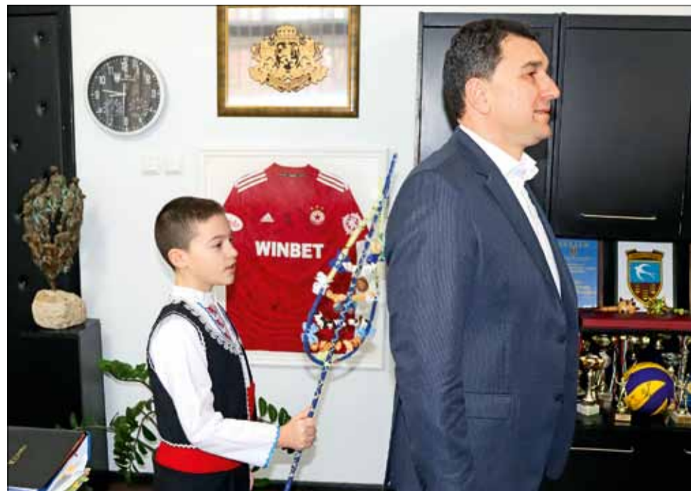
По традиция малки сурвакари навестиха Общинска администрация в първите дни на новата година.

нея по гърба подсилват ефекта от наричанията, които имат смисъл на благословия.