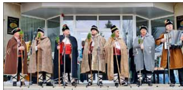
Много хубави песни и наричания имаше по време на традиционния Коледарски благослов.

Песните и наричанията на младите момци коледарци огласиха площада на малкото ни градче и зарадваха жителите му