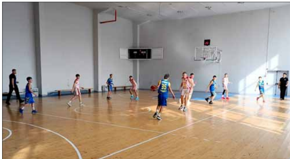
Доста трудни бяха двубоите на „Спортбаскет ГТ“ през изминалия уикенд.

Следващите си двубои, 16-годишните момчета на „Спортбаскет ГТ“, ще изиграят на 15 март, отново в град Генерал Тошево, а девойките ще пътуват до Велики Преслав на 10 март.