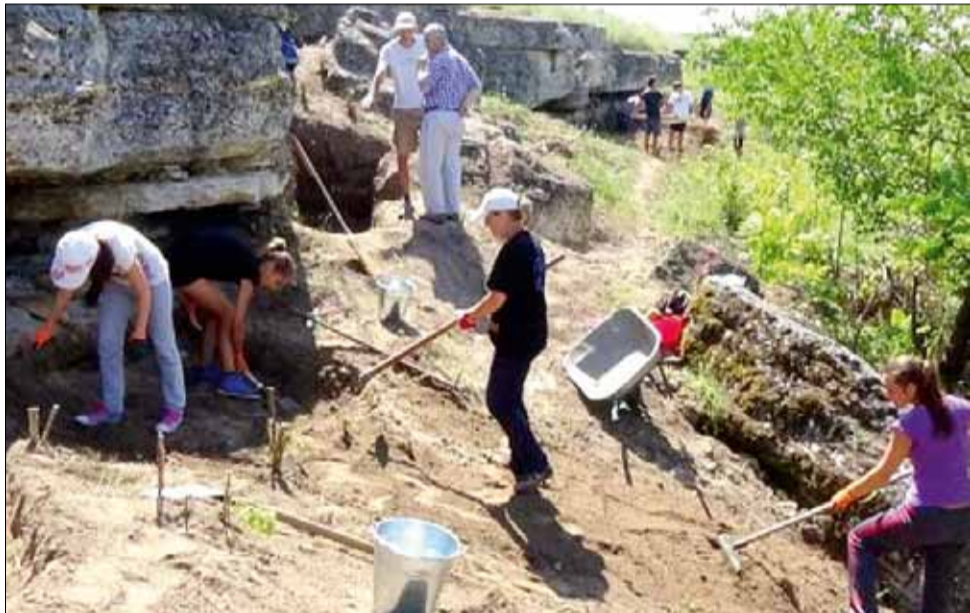
Момент от разкопките на нишите през 2014 г.

Несъмнено край скалите, върху които има изсечени ниши са регистрирани следи от изпълнявани ритуали посветени на култовете към слънцето и скалата. Загадка остава конкретно предназначение на нишите, защото те винаги са откривани празни. Най-популярна е идеята, че комплексите от ниши са били грандиозни некрополи. В камерите са полагали керамични урни с праха на покойниците. Формата и обемът на нишите действително дават възможност вътре да са стояли глинени съдове. В някои се наблюдават вдълбнатини за закрепване на някакви заоблени предмети. Почти всички ниши имат издаден напред горен край, предназначен да пази от дъждовната вода тяхното съдържание. Според някои учени в тези урни полагали праха на обикновените хора, докато в монументалните скални гробници погребвали аристократите. Друго мнение пък определя групите ниши като светилища на мъртвите. Всъщност то е разнородно на първото становище и не му противоречи. Интересно е, че наред с функционалните ниши