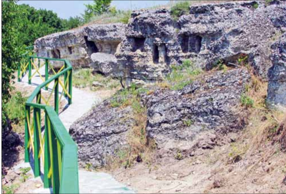
Най-подходящото време за разходка до скалните ниши в село Красен е между месеците април и октомври.

Скалните ниши в село Красен са едно красиво туристическо местенце на територията на община Генерал Тошево. Намира се в непосредствена близост до селото, с път стигащ до самите ниши и определено си заслужава да бъдат посетени! Паралелно с това могат да бъдат разгледани и много други забележителни места в района. Но за това ще ви разкажем друг път, в някои от следващите броеве на вестника.