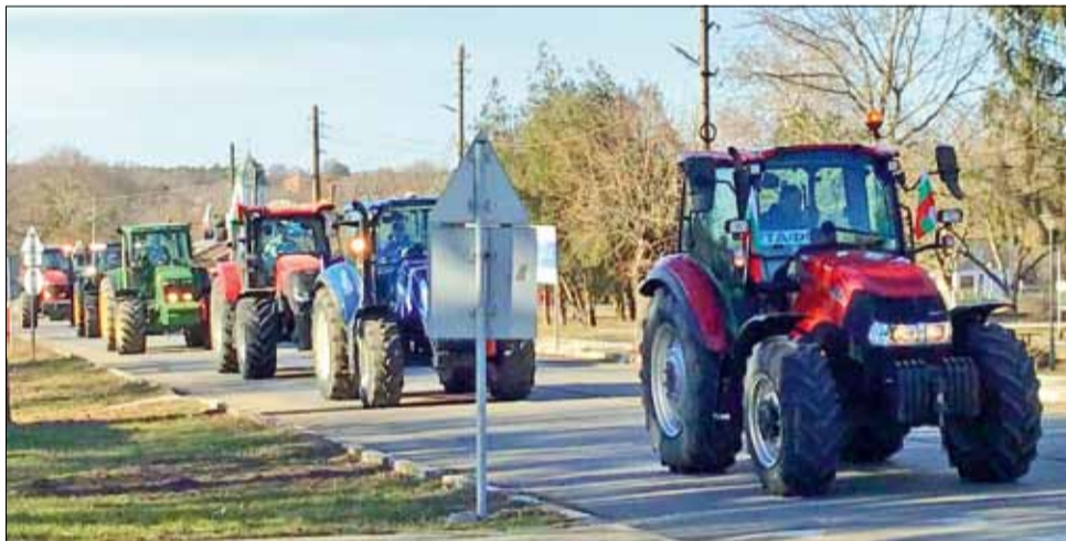
Десетки земеделски стопани от нашата община изкараха своите машини през миналата седмица и се включиха в националния протест, затваряйки граничния пункт край село Кардам.