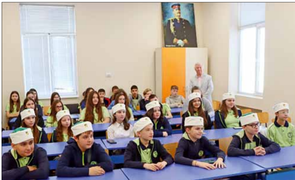
Клуб „Млад Възрожденец“ първа ще се разраства.

По време на събитието децата от клуба получиха зелено-бели четнически калпачета със златен лъв, а бъдеще надеждите са да бъдат осигурени и четнически униформи за всички.