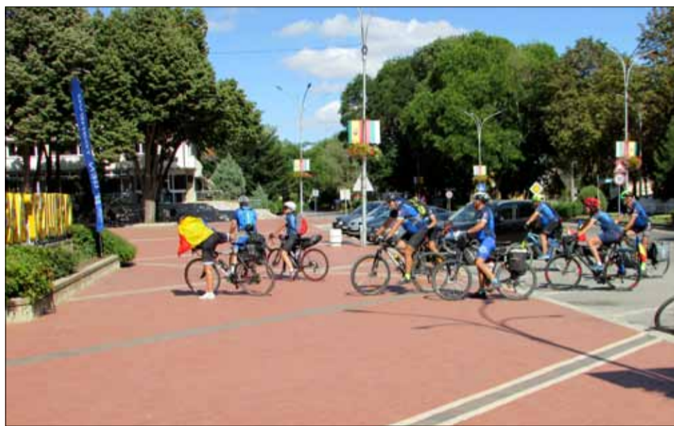
Генерал Тошево заема все по-централно място във веломаршрута „Дунав Ултра“.

то световноизвестни или регионални локации, природни феномени, културно-исторически обекти, личности, традиционни рецепти и дори характерни за региона представители на флората и фауната. Благодарение популярността на маршрута „Дунав Ултра“, интересът към конкретни места в нашия регион нараства и все повече пътешественици избират Добруджа за да обогатят своите туристически преживявания.