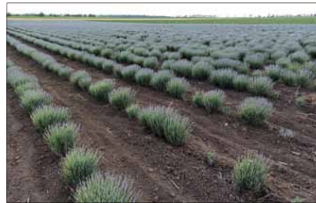
Все по-малко останаха масивите от лавандула в Добруджа.

покрива разходите на земеделските производители и отливът от сектора се очаква да продължи. Високите запаси от не-реализирана продукция оказват негативно влияние и върху пазара на нишови масла. Големият бум от периода 2016-2019 (2-5 пъти над обичайните площи) е последван от срив в производството при повечето ни-