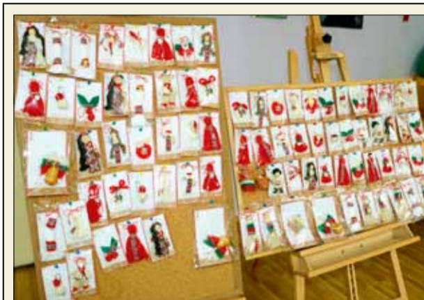
Преподавателите в ЦППР – Център за работа с деца изработиха десетки красиви мартенички, които се предлагат на импровизиран базар.