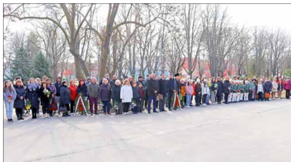
И през тази година много хора взеха участие в поклонението пред паметта на Апостола.

телно движение. Той надживява своето време, просветителските идеи на 18 и 19 век, а неговите виждания, принципи и идеали много повече подхождат на нашето съвременно разбиране за демокрация, за Република, равенство пред закона. Идеалите на Левски Републиката да е свята, демокрацията да е истинна, властта да е на народа, а свободата да е на свободните човеци са живи и до днес.