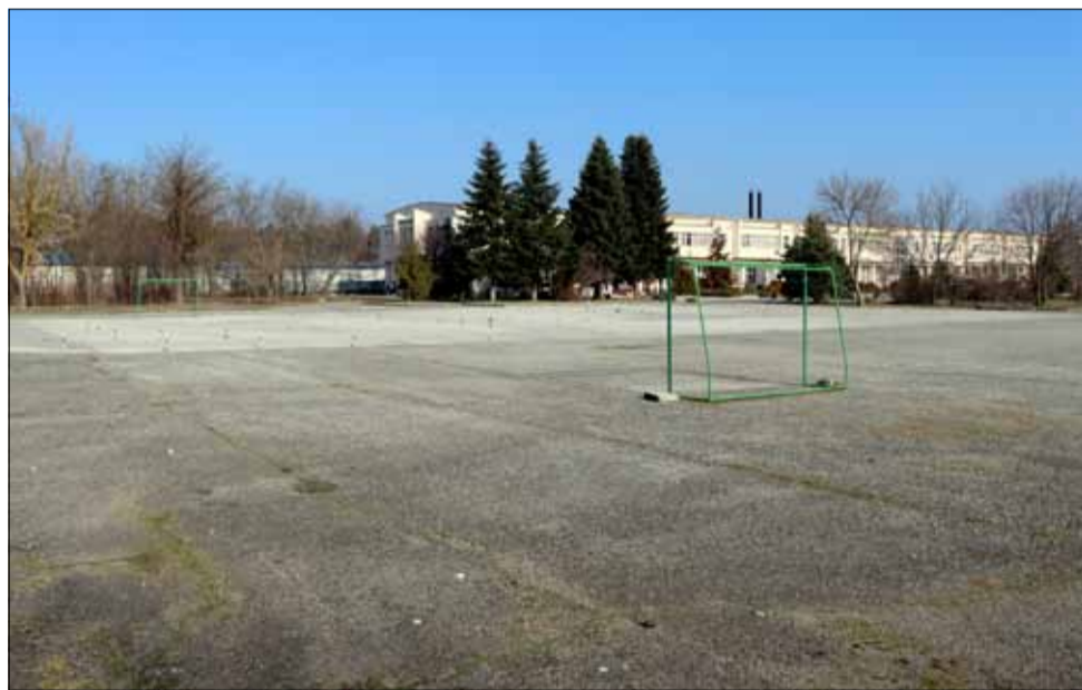
Така изглежда в момента спортната площадка на гимназията по земеделие.

години Министерството на образованието и науката изпълни договор за безвъзмездна помощ с Управляващия орган на ОППР 2014-2020 г. за ремонт на сградата на училището, изпълнение на мерки за енергийна ефективност и облагоустване на прилежащото дворно място.