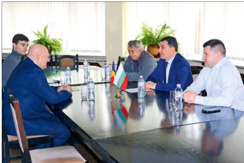
По време на работната среща бяха обсъдени последни детайли преди подписването на договора за реализирането на проекта.

Проектът има инвестиционен характер, като всички партньори ще извършват дейности по благоустройство и облагородяване на паркови зони, гористи местности, летни и открити сцени. Ще бъде извършена и доставка на ново парково оборудване. Предвидени са и дейности, свързани със задълбочаване на сътрудничеството и обмяната на опит между страните, както и дейности, свързани с младото население от четирите района.