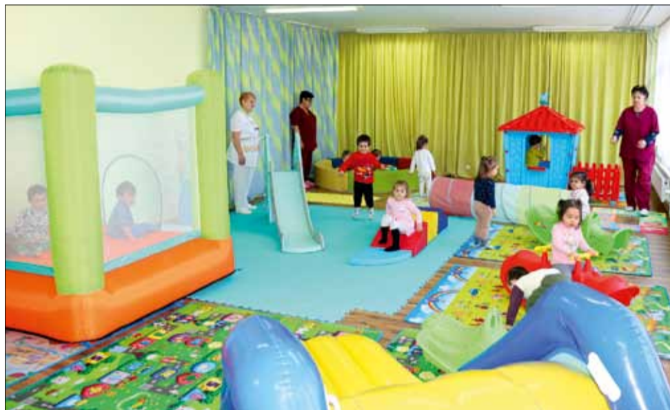
Децата в ДЯ „Радост“ се радват на безкрайни игри в новия игрален кът.

- Искаме да се радват на детството си, да слушат родителите си и да не пренебрегват училището.