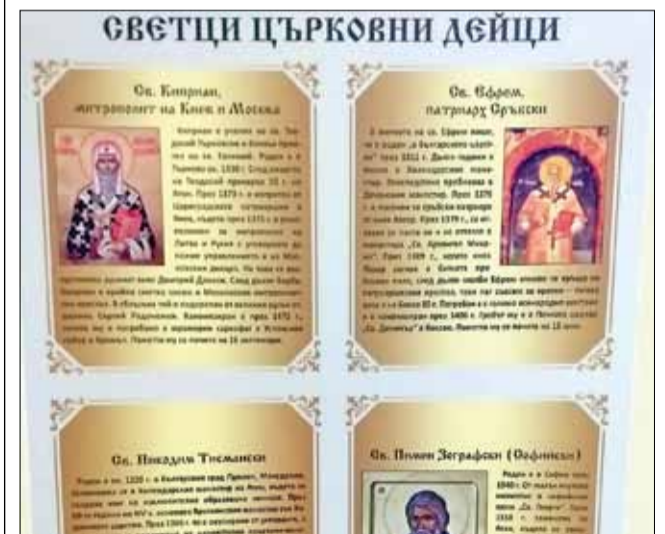
От паната в музея могат да се научат много интересни факти за българските светци.

зей, град Бургас и е съфинансирана от сесия на Министерството на културата за дейности в областта на музейното дело и образователните изкуства.