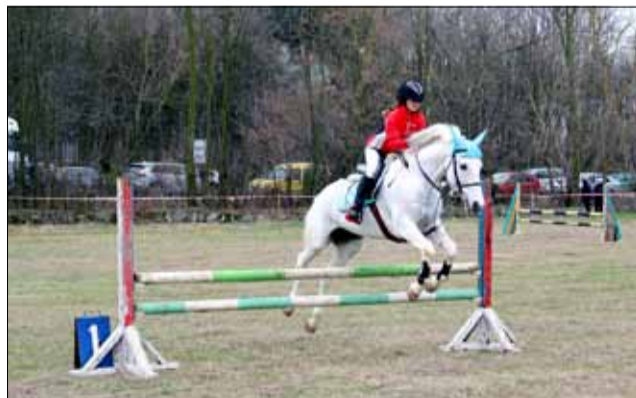
И тази година село Кардам се превръща в привлекателно място за любителите на конете.

зеен музей, град Генерал Тошево, е наредена мобилната изложба „Българските светци“ на Регионален исторически му-