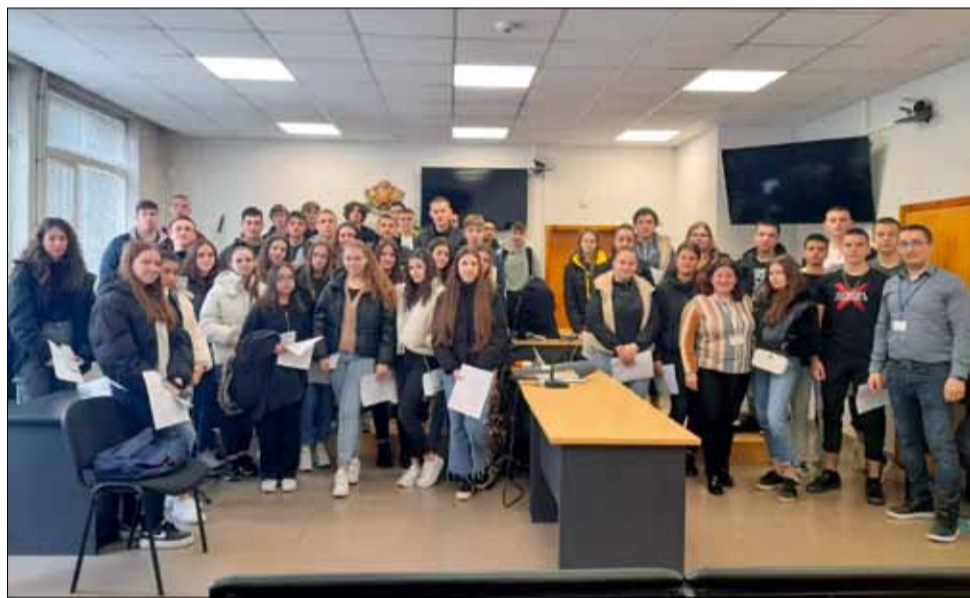
Учениците демонстрираха добри познания, свързани с компютърните киберпрестъпления.

Всички деца получиха и задание на организирания курс за есе от Районен съд, град Генерал Тошево на тема „Опасностите при сърфиране в интернет“, като крайната дата за подаване на готовите есета е 8 април 2024 г. Осигурени са предметни награди за първо, второ и трето място.