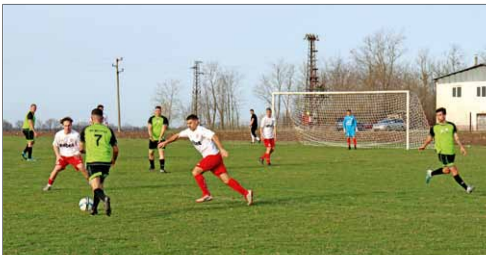
В село Люляково любителите на футбола видяха от всичко по много...

Четвъртият общински отбор „Партизан“ (Василево) загуби домакинството си на „Орловец – 2008“ (Победа) с 1:2 и остана на последното място в групата.