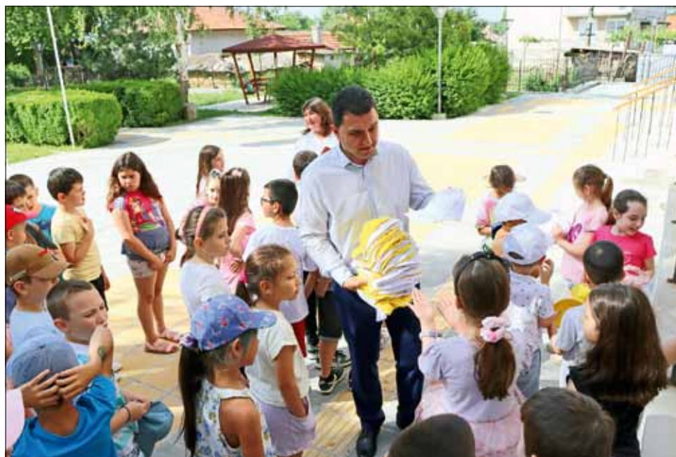
Старт на най-забавната лятна академия!

стигне чрез забавления и обучения, повишаване на общата екологична култура, обществена ангажираност, придобиване на знания за здравословния начин на живот, в областта на етнографията, историческото минало, флората и фауната на Добруджа, изящните и приложни изкуства, запознаване с българската и световна детска литература.