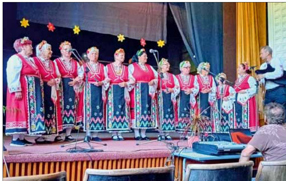
Гостите на събитието се насладиха на хубави изпълнения от всички самодейни групи.

Жителите на село Преселенци и техни гости посрещнаха с аплодисменти участниците във фолклорната програма, подготвена за празника. Тя започна с изпълнения на домакините – Фолклорна група „Сребърен листопад“ от Народно читалище „Нов живот 1941“, след което на сцената последователно се качиха гостуващите самодейни състави от читалищата в селата Победа, Змеєво, Люляково, Петлешково и фолклорна група „Добруджански славеи“ при Клуб на пенсионера 1, град Генерал Тошево.