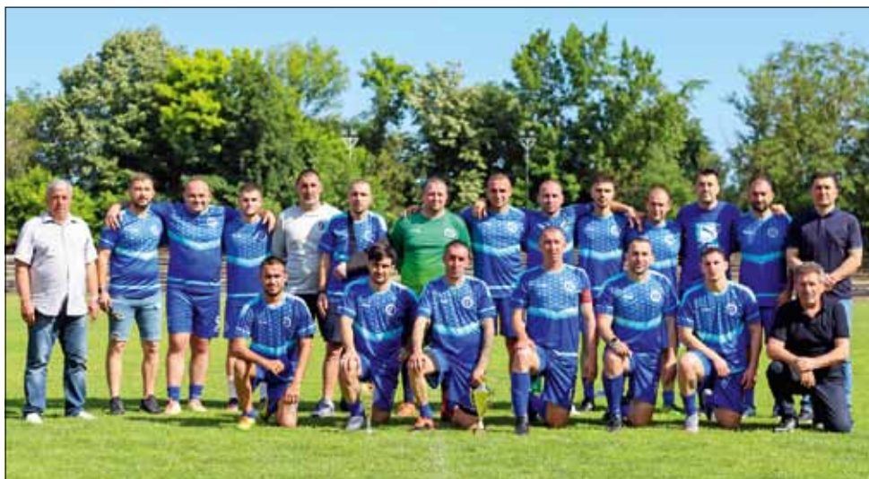
Отборът на „Спортист“ (Генерал Тошево) беше награден с купата за второто си място в първенството.

Така, след девет месеца, първенството по футбол в областта завърши. Сега предстоят три месеца почивка за всички отбори и в началото на есента стадионите отново ще се изпълнят с живот и емоции.