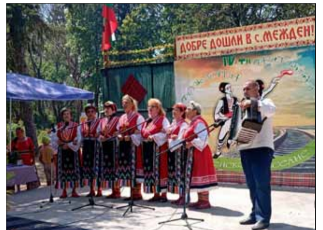
Самодейците от село Изворово.

Фестивалът „Межденско веселие“ привлича стотици посетители, които вече четвърта година имат възможността да се насладят на богата фолклорна програма, изпълнена