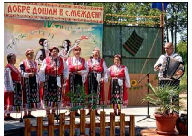
Групата от село Красен.

с песни, танци и музика. Събитието допринася за укрепването на културните връзки между различните населени места и за поддържането на традициите в българския фолклор.