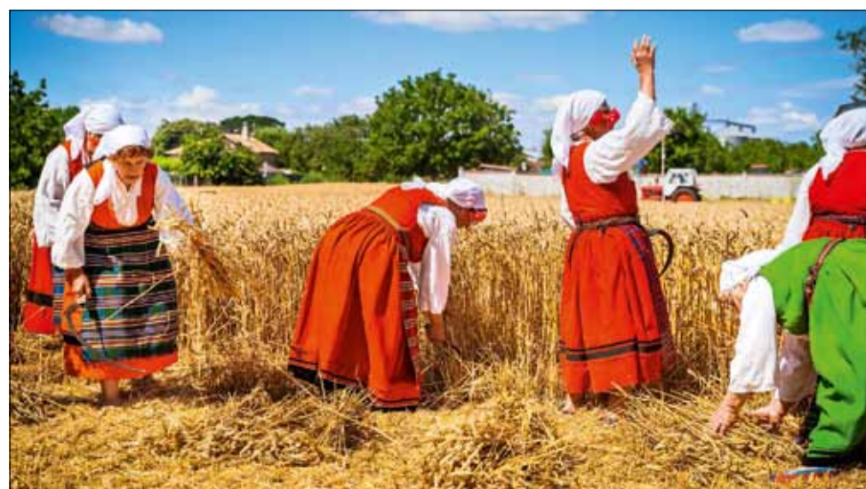
По стар български обичай дадоха старт на жътвата в село Дъбовик.

Асоциация на българските зърнопроизводители