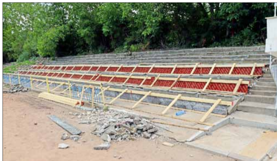
Паралелно с ремонта вътре в сградата на стадиона, където засега предимно се кърти и разбива, се оправят и откритите трибуни в отделните сектори.

Изпълнението на дейностите се финансира съвместно по проект „Ремонт работи на обществена сграда към стадион „Спортист“, град Генерал Тошево – II и III етап“, административен договор № BG06RDP001-19.585-0003-C01 за предоставяне на безвъзмездна финансова помощ по Програмата за развитие на селските райони 2014-2020 г., съфинансирана от Европейския земеделски фонд за развитие на селските райони по Процедура чрез подбор на проектни предложения по подмярка 19.2 „Прилагане на операции в рамките на стратегии за водени от общностите местно развитие“, на мярка 19 „Водено от общностите местно развитие“, сключен между Община Генерал Тошево и Държавен фонд „Земеделие“ и от бюджета на Община Генерал Тошево. Общата стойност за изпълнението на договора е в размер на 378 900.40 лв. с ДДС.