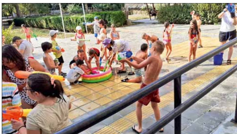
Водни забавления в двора на ученическото общежитие.