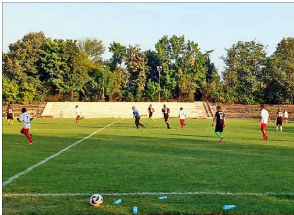
„Спортист 2011“ записа една победа и една загуба в досегашните си две приятелски срещи.

При три оставащи седмици до старта на първенството, повечето отбори водят подготовка и окомплектоват съставите си. Първи, още в началото на месец август, за тренировки се събраха момчетата от тима на „Дружба“. Те дори изиграха една престижна контрола в Румъния. „Спортист 2011“ също вече направи две проверки, докато другите отбори все още не са играли приятелски срещи. Във всички клубове обаче цари настроение и ентузиазъм преди началото на новия сезон.