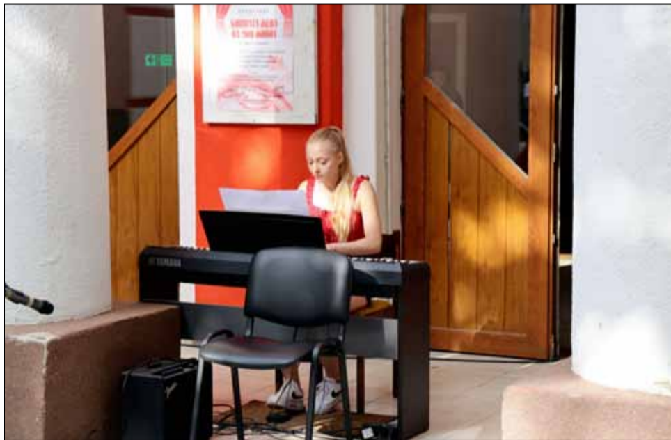
Новата учебна година започна с хубав концерт пред сградата на читалището.

ла при НЧ „Светлина 1941“ в града напомнят, че продължава записването на желаещи за придобиване на нови знания, успехи и развиване на таланти. Всички деца от 5 до 18 го-