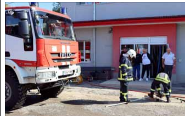
Служители на РС „ПБЗН“, град Генерал Тошево направиха малка демонстрация нато част от събитийната програма за „Седмица на пожарната безопасност“.

От службата цитираха и статистика от началото на 2024 г. до 11 септември. За този период от време служителите от РС „ПБЗН“, град Генерал Тошево са реагирали на 88 произшествия, като по-значимите произшествия ликвидирани от екипите са: пожарите през месец февруари в селата Житен и Градини; пожарът в град Генерал Тошево в многофамилна жилищна сграда; пожарите в житни масиви през месеци юни и юли в землищата на селата Чер-