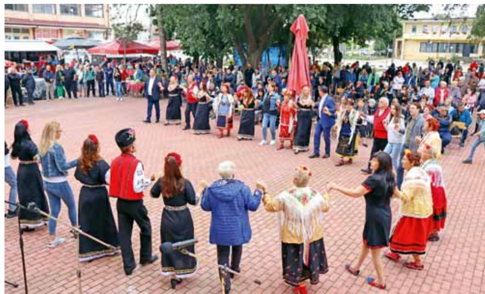
Жителите на село Кардам приветстват есента с хубав празник на плодородието.

и Детска танцова школа „Жътвари“. Никой не се уплаши от дъжда и всички участници в музикалната програма дадоха всичко от себе си, за да забавляват публиката, а най-големите овации обреха най-малките деца, които под дъжда не спряха да изпълняват хубави народни танци.