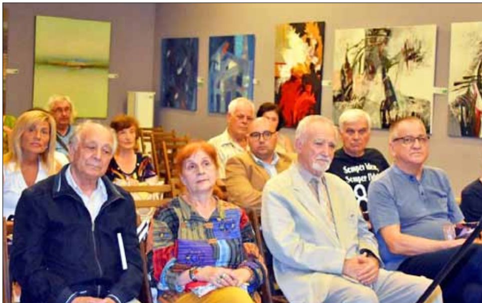
Български съвременни автори ще представят последните си книги пред жителите на град Генерал Тошево и село Кардам.