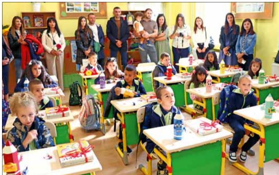
Първият учебен ден – шарен и вълнуващ.

Тази година в община Генерал Тошево има общо 68 първокласници. В града са 50 от тях, като те са разпределени в двете училища – в ОУ „Хр. Смирненски“ има 24 първокласници, а в СУ „Никола Й. Вапцаров“ – 26.