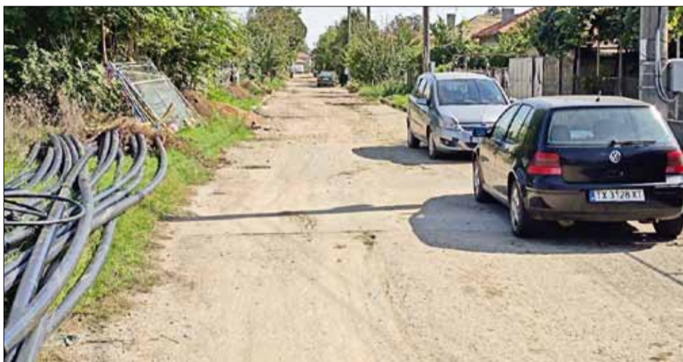
Водопроводът по ул. „Леонти Бакларов“ е вече подменен. Сега се работи на улиците „Стара планина“ и „Отец Паисий“.

Гореизброените дейности по трите улици са поредното инфраструктурно подобрене в града в рамките на последните няколко години. Подобни ремонтни действия вече бяха реализирани на улиците „Васил Алексиев“ и „Васил Априлов“ (канализация и водопровод), както и „Никола Зидаров“, „Пеньо Пенев“, Пейо Яворов“ и „Константин Кисимов“ (канализация).