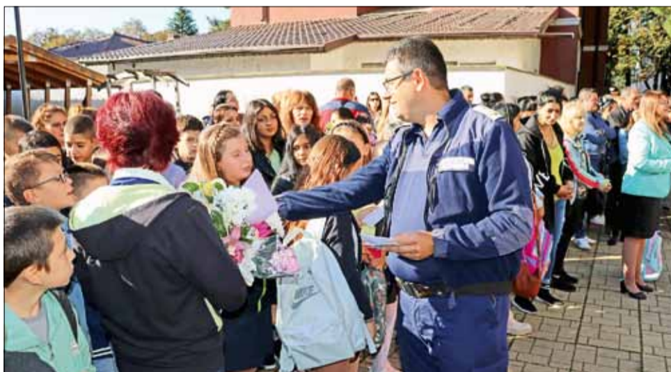
Служители на РУ „Полиция“ в града раздават информационни брошури по време на откриването на новата учебна година в СУ „Никола Й. Вапцаров“.

Според информацията в брошурата подобен тип превозни средства няма право да се управляват в тъмната част на денонощието, по улиците на града, извън града, както и в градските паркове и детски площадки. Управлението на електрически тротинетки на територията на градския парк в Генерал Тошево е най-честото нарушение, което се допуска. Освен това в парковете много лесно може да стане произшествие и да пострададът съсем невръстни деца,