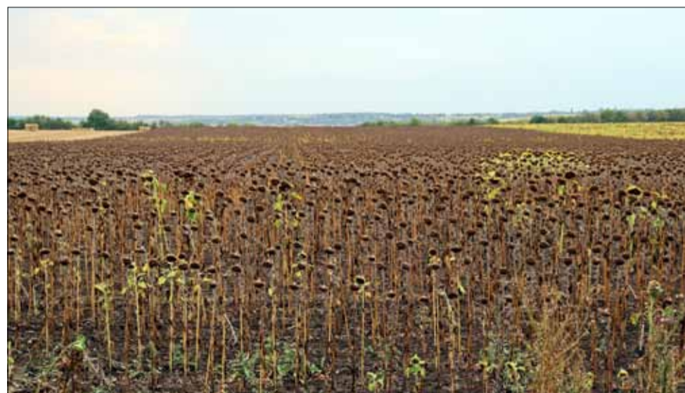
Ето така изглеждат неожънатите все още слънчогледови полета край нашия град.

„Есенно-зимният запас трябва да е около 250 – 300 милилитра, а той достига максимум до 150 милилитра. Такава беше ситуацията и през 2023 г., затова гле-