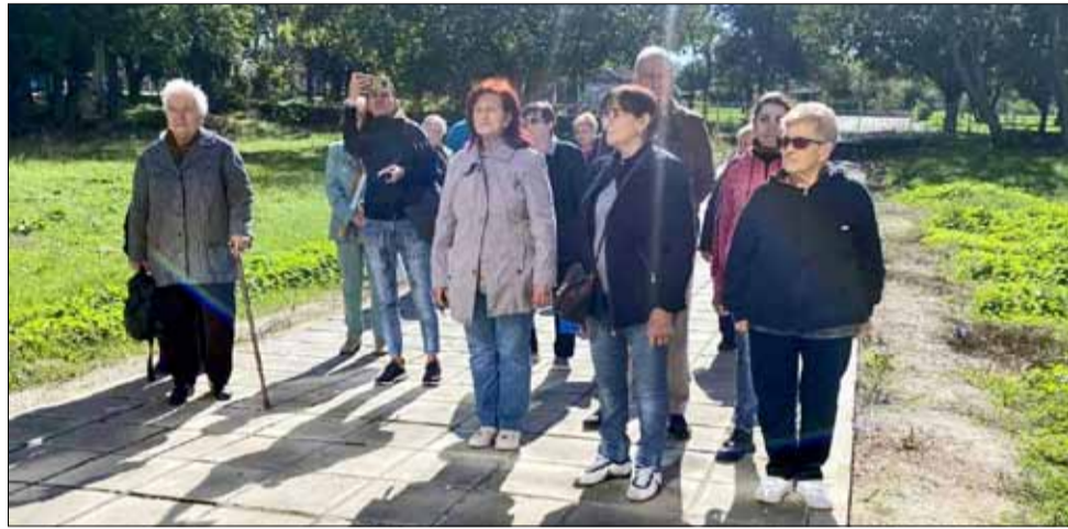
Бивши учители и възпитаници на ОУ „Христо Ботев“ се събраха пред сградата на училището в селото на първия учебен ден.