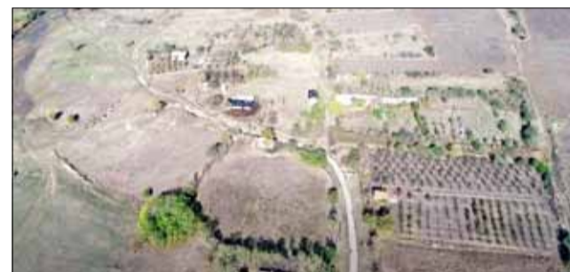
Тук някога е кипяло от живот...

Старото име на село Огражден е Хисарлък /крепост/. Получило го е от римската кре-