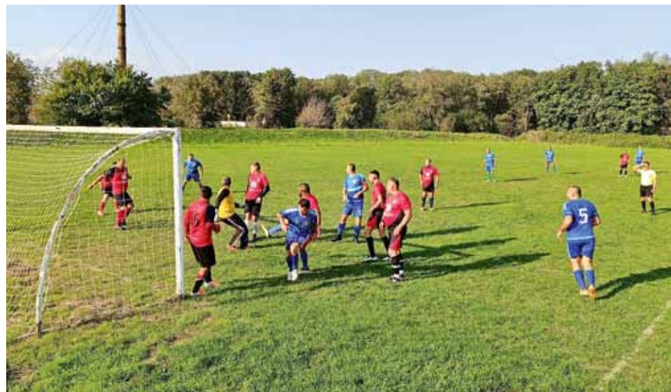
„Спортист“ (Генерал Тошево) не постави под съмнение превъзходството си в двубоя с „Партизан“ (Василево).

Другите два отбора от нашата община - „Дружба“ (Люляково) и „Спортист - 2011“ (Генерал Тошево) загубиха своите двубои от втория кръг на първенството. „Дружба“ отстъпи у дома с 1:4 от „Добруджанец“ (Овчарово), докато „Спортист - 2011“ претърпя тежка загуба с 1:5 от „Орловец - 2008“ (Победа). В първия кръг двата тима не играха.