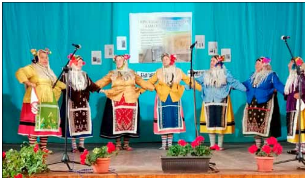
Такива празници връщат хората към корените им.