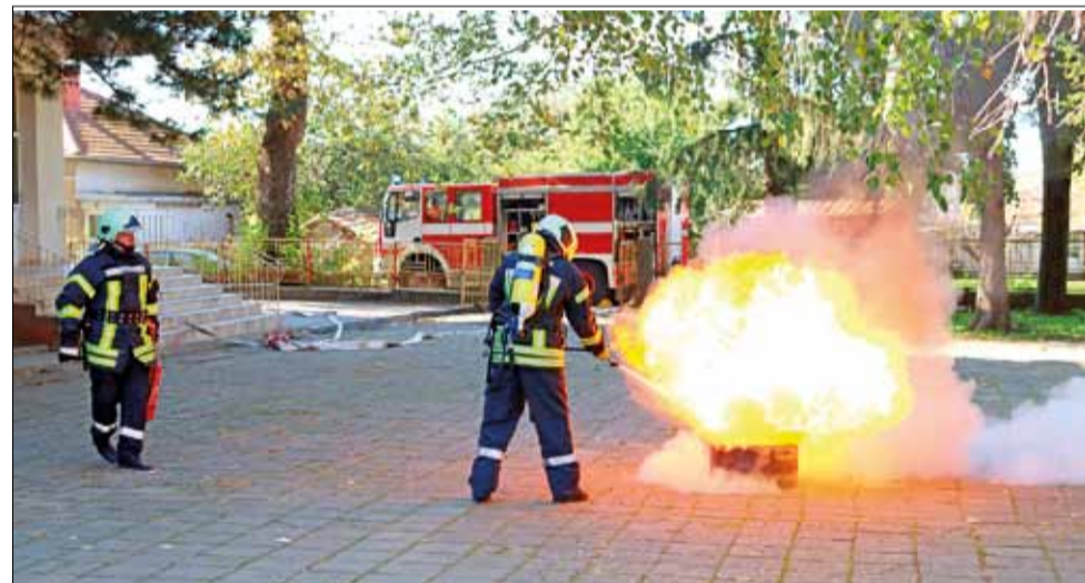
Показното занятие премина при много добра организация и добре спазвайки всички планове за евакуация.

След практическата част на занятието, изграденият Щаб за изпълнение на плана за защита при бедствия, докладва за възникналите събития на директора и заместник-директора на ОУ „Христо Смирненски“. Показното упражнение премина при много добра организация и стриктно спазване на всички правила и разпоредби.