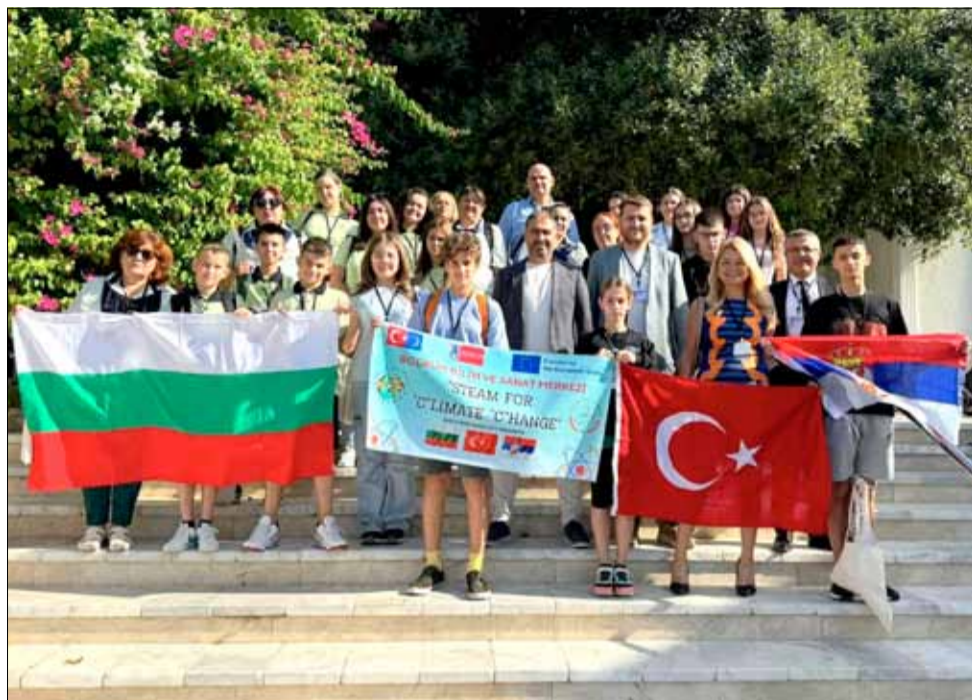
Деца дълго ще помнят това вълнуващо пътуване до турския град Бодрум.

сотинце (Сърбия) през април тази година и сега дейностите приключват с посещение на последния партньор – Бодрум (Турция).