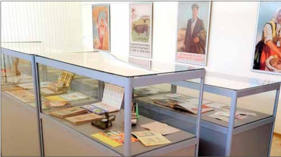
Изложбата е доста интересна, особено за по-възрастните хора.

За възрастните хора би било интересно да се върнат назад във времето и да си припомнят младините точно по този начин. Изложбата ще остане наредена до края на месеца и всеки желаещ може да я разгледа в работно време всеки делничен ден.