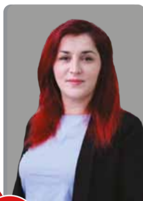
105 Стоянка КЕСКИНОВА