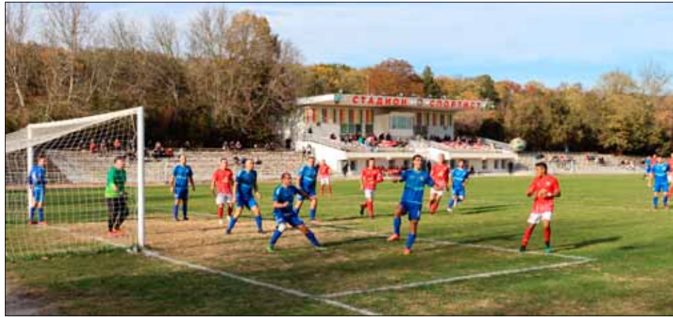
Местното футболно дерби се превърна в истински празник. Точно такъв, какъвто заслужават феновете на играта в града.

Все пак малко след средата на второто полувреме усилията на домакините се увенчаха с успех и те изравниха резултата. Равенството се задържа до последните 7-8 минути, когато настъпи кулминацията на мача. Първо левият краен бранител на „Спортист 2011“ получи директен червен картон за удар без топка и остави своите съотборници с двама души по-малко на терена, а после, буквално в последните секунди, домакините стигнаха до успеха с гол, който им осигури победата в дербито.