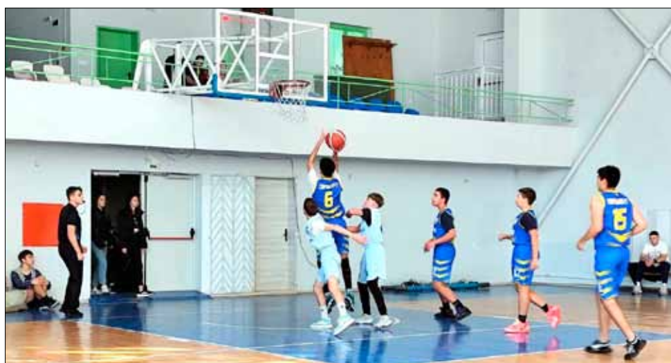
Всеки уикенд в спортната зала на СУ „Никола Й. Вапцаров“ има интересни баскетболни срещи при подрастващите.

В първата си среща „Спортбаскет – ГТ“ победи по категоричен начин „Вихър 2002“ с 40 точки разлика – 78:38. Във втория мач на отбора обаче беше допуснато поражение с 59:82 от тима на „Варнабаскет“.