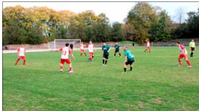
За съжаление ветераните на „Спортист 2011“ допуснаха поражение от „Добруджа“ с 1:3.

Първите минути на втората част също бяха равностойни като вече започна да се усеща умората у футболите. При резултат 1:1 нападателят на „Спортист 2011“ излезе очи в очи със стража на гостите, но се съсети и пропусна много изгодно положение, което можеше да доведе до преднина за домакините. И както често се случва във футбола, още в ответната атака „Добруджа“ вкара втори гол и поведе с 2:1. До края на двубоя момчетата на „Спортист 2011“ се хвърлиха в атака в опит да изравнят, но на няколко пъти се оголиха в защита и допуснаха трето попадение във вратата си.