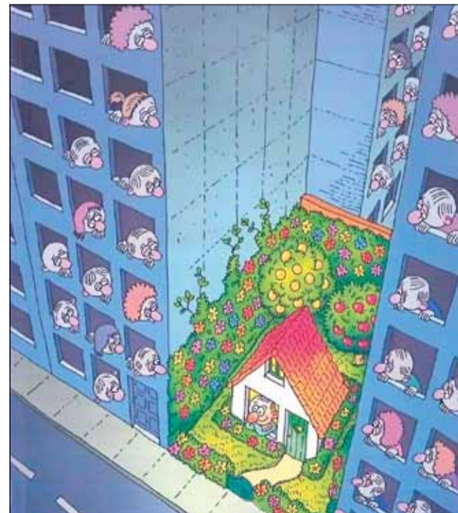
Въпрос на мислене и осъзнат избор...