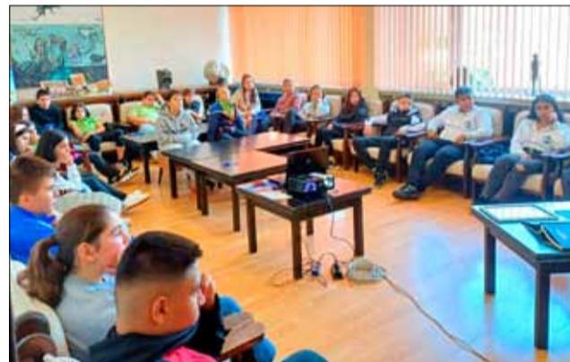
Учениците в нашия град демонстрираха богати знания за живота на генерал Стефан Тошев в редица беседи, организирани по повод 100-годишнината от кончината му.