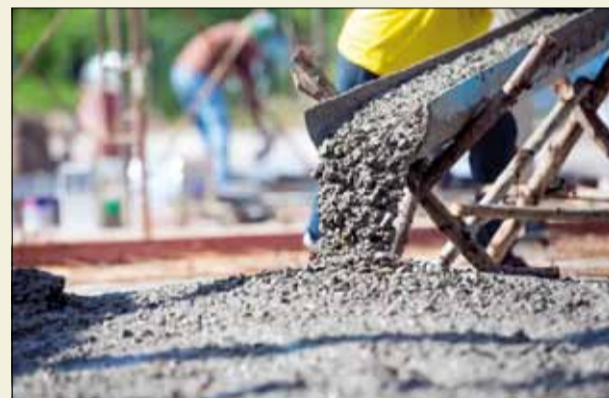
Пазете общинската собственост пред имотите си!

Всяка година стават все повече случаите, в които гражданите правят мащабни ремонти на частните си домове и стоварват и съхраняват строителни разтвори и материали на тротоари или други общински терени. Най-често това се случва през топлиите месеци – от април до октомври. Изграждане на огради, подмяна на покриви и саниране на къщи са най-често срещаните ремонтни дейности в града. При всяка една от тях, а при други, се образуват „мини“ строителни площадки пред имота, в който се прави ремонт. На-