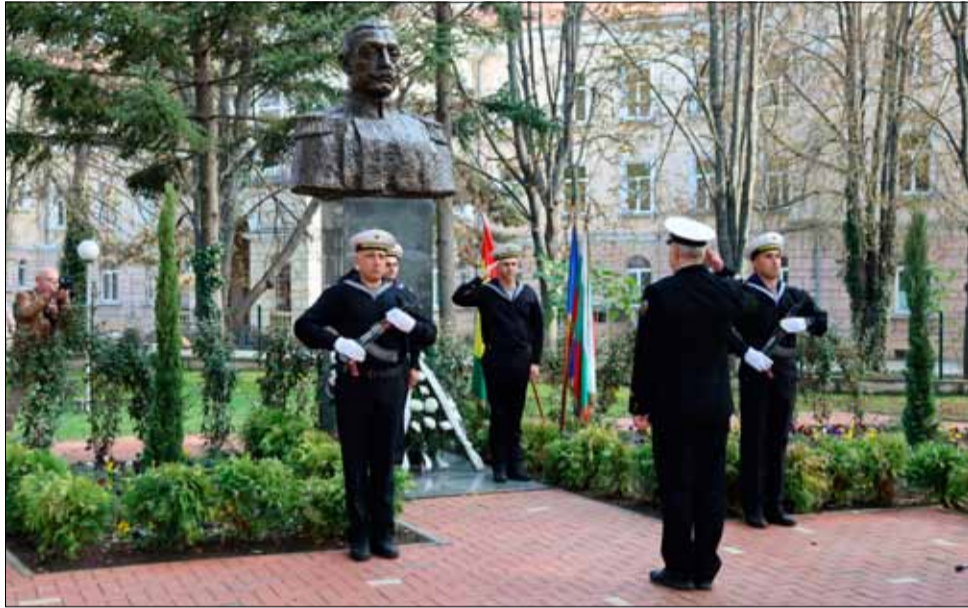
Военният ритуал пред паметника на генерал Стефан Тошев.

Историята ни учи, че тя се създава и твори от хора водачи, силни и непреклонни личности с висок дух и достойнство, отстояващи правотата си, а времената на изпитания раждат тези личности. Но ежедневната сивота на следващите поколения покрива със забравата националните герои. Пощадени