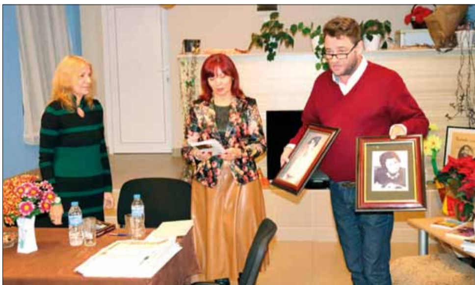
За поредна година в село Росица почетоха големия български писател Йордан Йовков по уникален и неповторим начин.