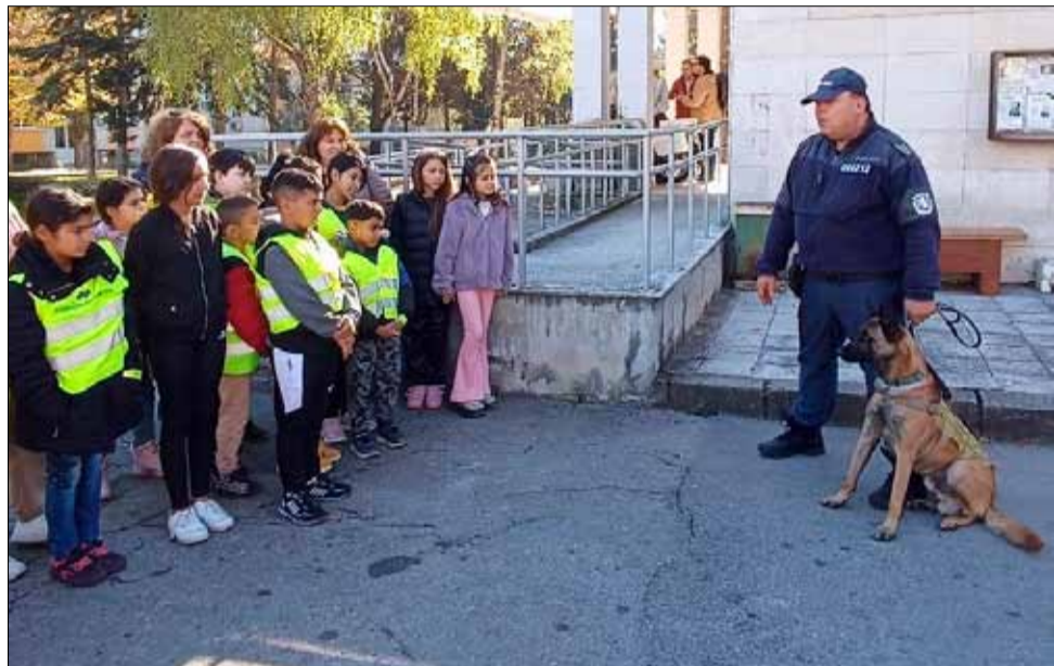
Учениците от ОУ „Васил Левски“ в село Преселенци се запознаха с работата на следовите полицейски кучета.

Денят на децата премина неусетно и беше много интересен. Те научиха много за работата на служителите на реда, за оръжията, с които боравят и за верните им помощници – кучетата-следователи. Дейностите в Детско полицейско управление продължават с още изненади за учениците от село Преселенци.