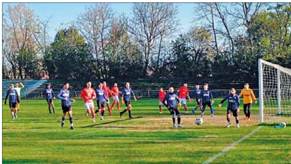
До края на есенния полусезон в „А“ Областна футболна група остават само два кръга.

В таблицата „Дружба“ и „Партизан“ се намират на последните две места без спечелени точки, докато „Спортист“ е девети с актив от девет пункта.