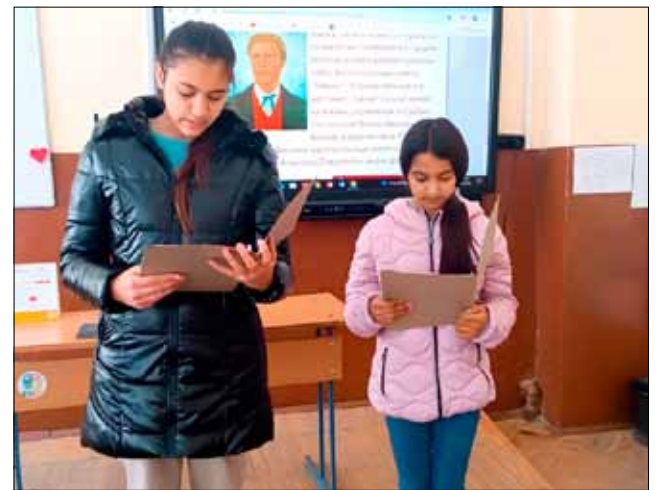
Децата показаха отлично знание за живота на Васил Левски.

Учениците имаха възможността да се запознаят и с едни от най-великите мисли и цитати на Васил Левски и да