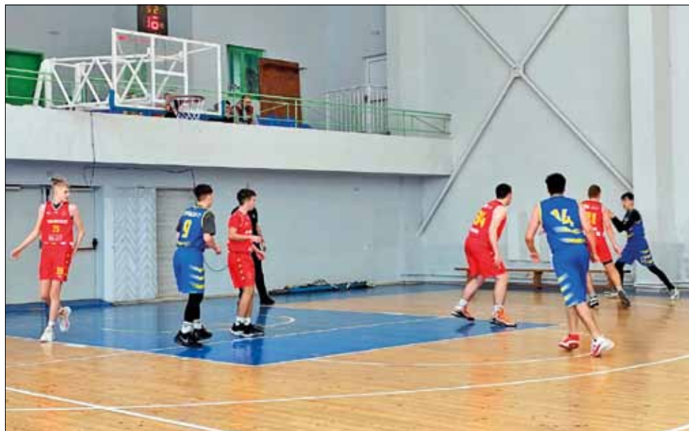
Юношите на „Спортбаскет ГТ“ се представят добре в своите срещи.

Същите три отбора, които трябва да разпределят помежду си местата от 5-то до 7-мо в крайното класиране ще изиграят още два подобни мини-турнира, в които всеки ще играе срещу останалите два тима. Това ще се случи на 14 март и на 3 април, отново с спортната зала на СУ „Никола Й. Вапцаров“.