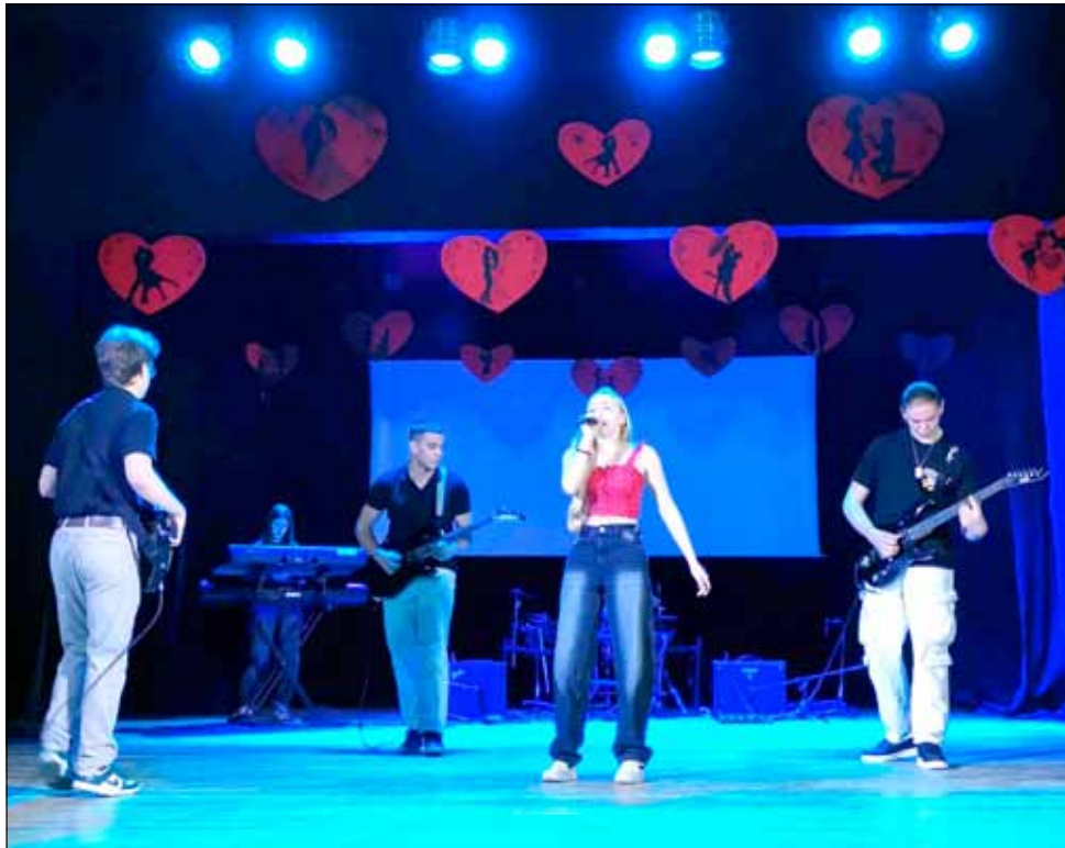
Любовни песни за страхотно любовно настроение в залата на читалището.

дариха роза и стихосбирка с едни от най-красивите любовни стихотворения в българската литература. Стиховете са подбрани от самите младежи и издадени от самите тях, оформени в малка книжка с илюстрации.