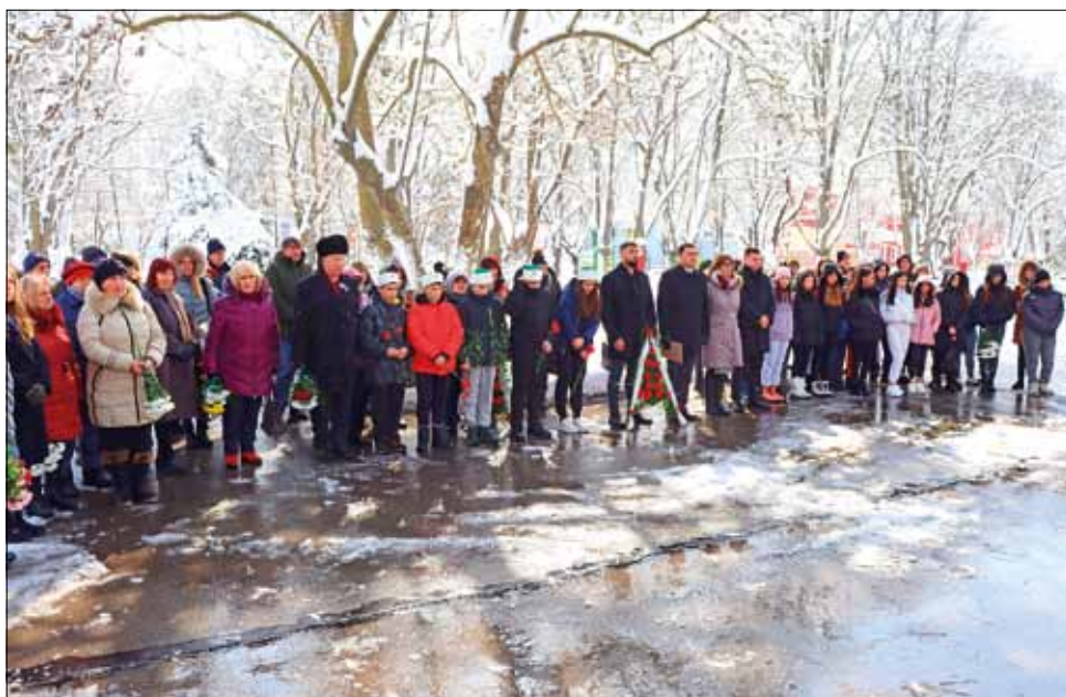
Поклон пред делото ти, Апостоле!