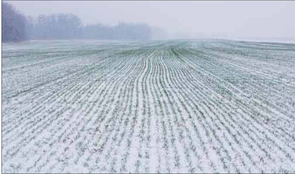
Този дебел сняг предпазва растенията от студове и осигурява влага в почвата.