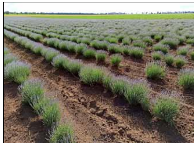
Продължителната суша и очакваното горещо време в следващия месец ще изместят жътвата на лавандулата с дни напред.

В края на цикъла стоят и услугите по прибиране на реколтата и дестилериите за извряване на продукцията. Собствениците на казани обаче още умуват върху цените след миналогодишните изкуствено завишени суми за тази услуга и недоволството на производителите.