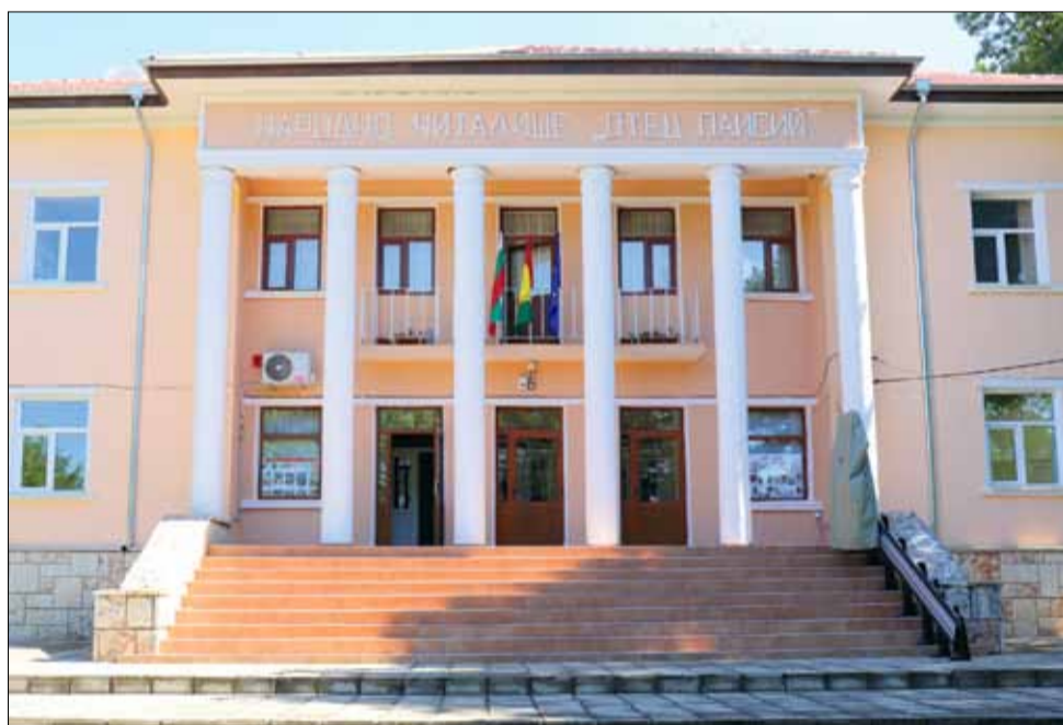
НЧ „Отец Паисий – 1897“ в село Спасово вече е изцяло реновирано и обновено.

Проектът се изпълнява в партньорство с община Мурфатлар, Република Румъния. Водеща организация е Община Генерал Тошево, като общата стойност на проектното предложение е 1 219 951 евро. От тях 610 006 евро са за българската община. Извършените ремонтни дейности на читалището в село Спасово са на стойност 375 528,00 лв. с ДДС.