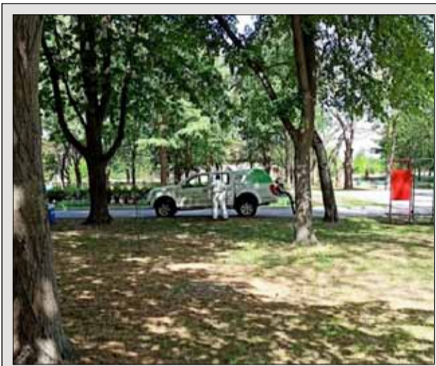
Втора обработка на общински зелени площи – паркове и детски площадки, за предпазване от кърлежи започна на 4 юни в град Генерал Тошево. Пръскането ще продължи до 10 юни. За целта се използват препаратите „Бандит 10 ЕВ“ и „Айкъл 10 КС“. Освен всички паркове, зелени площи и детски площадки в града, ще бъдат напръскани и Гробищният парк и тренировъчното игрище. Точно преди месец – между 11 и 15 май в града се извърши подобна обработка на общински зелени площи за предпазване от кърлежи.

На телефонен номер 0883 560 603 се приемат заявки от назначени за целта служители, които ще се изпълняват в рамките на същия ден по проект за предоставяне на услуги по домовете в града и селата за оказване на подкрепа на възрастни хора над 65 години с ограничения или невъзможност от самообслужване; хора с увреждания; възрастни в риск – лица в зависимост от грижа, поради увреждане, неподвижност или невъзможност за водене на независим и самостоятелен живот; поставени под карантина във връзка с COVID – 19; самотен/ни родител/и с дете/ца до 12 г., които са в невъзможност да оставят децата си сами.