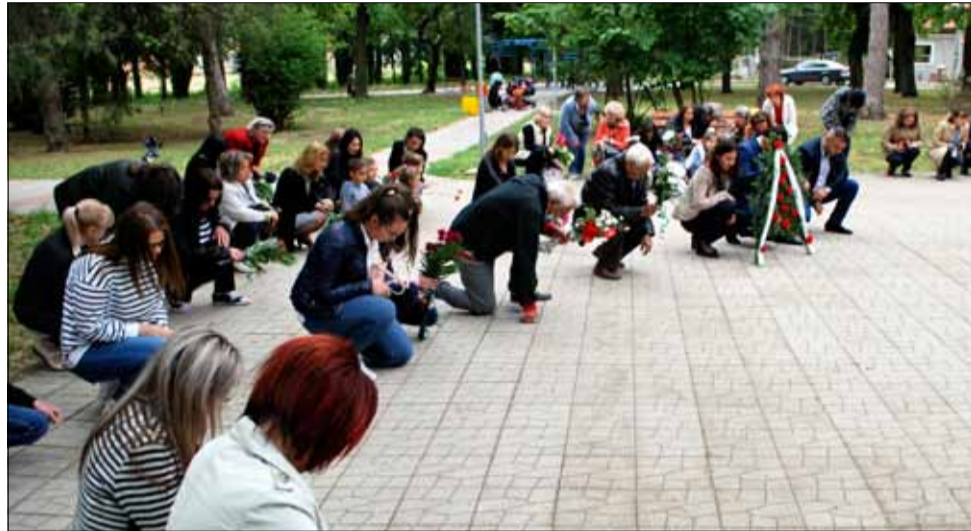
Десетки признателни граждани и ученици се поклониха пред саможертвата на Христо Ботев и загиналите за свободата на България.

Днес Христо Ботев е сред най-обичаните ни национални герои, оставили светла диря в съзнанието на поколения българи. А гениалната му поезия и страстната му публицистика, са скъпи на всеки от нас. От 1901 година насам 2 юни официално се чества като Ден на Ботев и на загиналите за свободата на България, а от 1948 г. точно в 12:00 часа всяка година сирени ни приканват към мълчание и свеждане на глави в памет на загиналите в цялата страна.