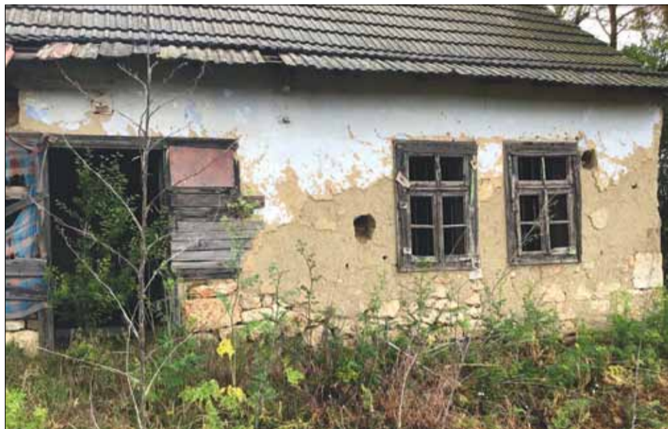
Тук, в тази къща, някога е имало живот...

Затова, скъпи ученици и родители, не мислете, че това е някаква прокоба, която тегне над вас. Всъщност всичко това е за ваше добро!