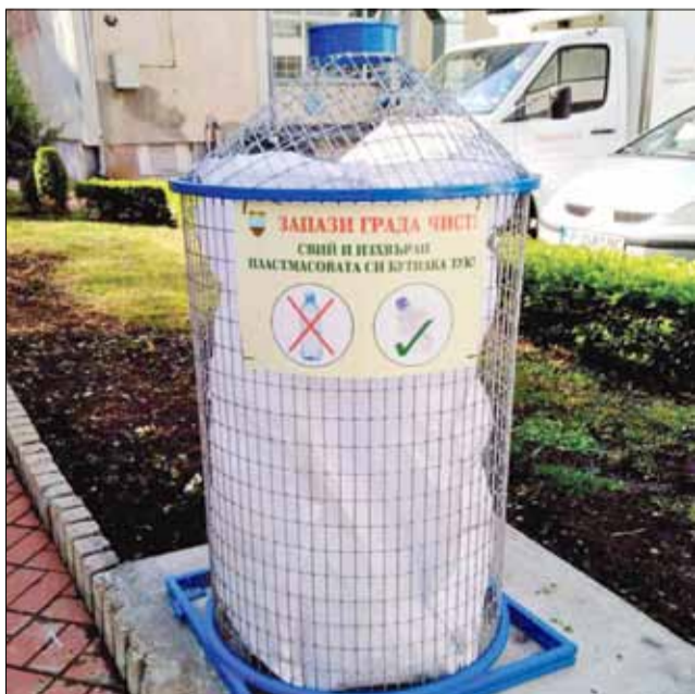
„Запази града чист! Своя и изхвърли своята пластмасова буталка тук!“ От една седмица в центъра на град Генерал Тошево (до Зеления магазин и срещу НЧ „Светлина – 1941“) има специално съоръжение за изхвърляне на пластмасови буталки, които да бъдат събирани и рециклирани. Община Генерал Тошево призовава всички граждани да бъдат отговорни и да пазят природата чиста!

сгради с адреси: ул. „Г. Киров“ №1, ул. „Ал. Стамболийски“ №2А и ул. „Станьо Милев“ №15, както и обществени сгради с адреси: СУ „Никола Й. Вапцаров“, ул. „В. Априлов“ №9 и ДГ „Пролет“, ул. „Хр. Ботев“ №18 в град Генерал Тошево. Общата стойност