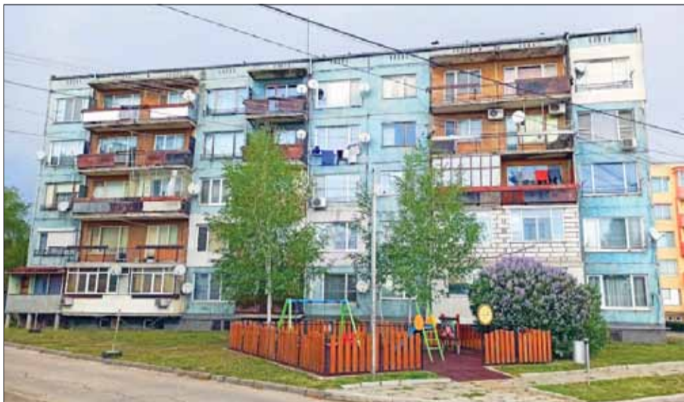
Ако проектните предложения на Община Генерал Тошево бъдат одобрени, единственият несаниран блок на ул. „Ал. Димитров“ - №3, също ще бъде енергийно обновен.

В рамките на следващите няколко месеца, Управляващият орган ще проведе конкурентен подбор на всички подадени проектни предложения от всичките 28 общини, допустими по програмата. След това ще бъде изготвено и крайното класиране с одобрените кандидати, като надеждите на Община Генерал Тошево са и двете предложения да бъдат сред класираните за безвъзмездно финансиране по процедурата.