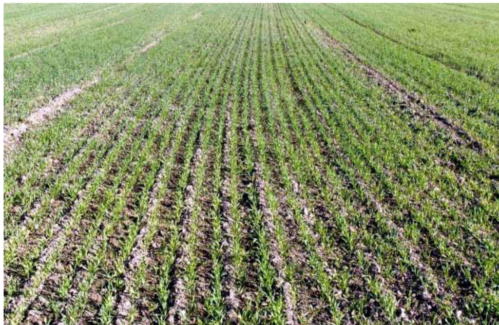
В края на миналата седмица започна да вали. Дали обаче количествата ще бъдат достатъчни, за да се възстановят посежите, все още е трудно да се наже.

Продължава процесът на застаряване на населението в област Добрич. В края на 2019 г. над 22% от населението на областта е било на възраст над 65 години и делът му продължава да расте. Застаряването е по-силно изразено сред жените отколкото сред мъжете. В същото време, децата до 15 години в областта са едва 14.1% и намалява спрямо предходната година. Към 31 декември 2019 г. населението на област Добрич е 171 809 души, което нарежда областта на 15-о място по брой на населението непосредствено след Шумен и преди Враца. В сравнение с 2018 г. населението на областта е намаляло с 2 022 души.