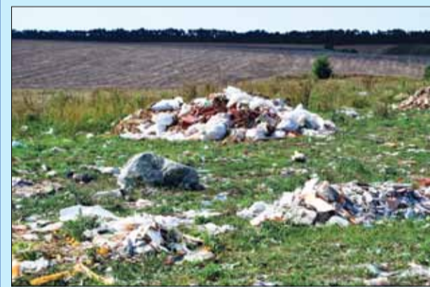
Тана изглежда в момента само малка част от сметището край квартал Пастир.

съществуващо общинско депо за неопасни отпадъци на община Генерал Тошево, което е разположено в землището на града, в кв. Пастир, на площ от 54 дка. Те имат за цел максимално да се ограничи неблагоприятното въздействие върху околната среда на натрупаните стари отпадъци и да се намали вредното им влияние върху почвата, водите и въздуха. Рекултивацията на депото ще протече на два етапа - техническа рекултивация и биологична рекултивация;