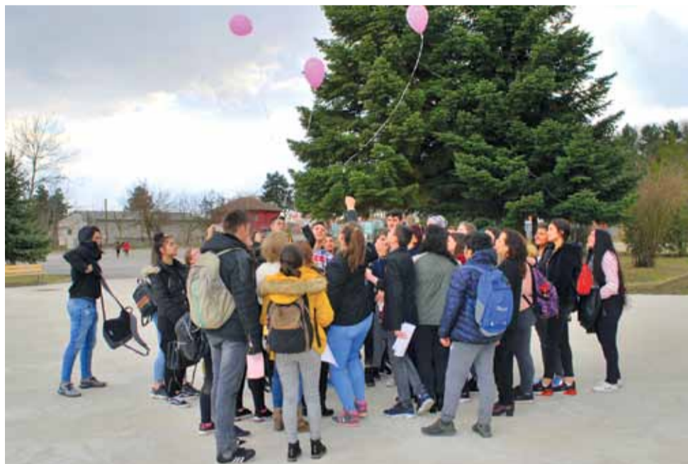
Учениците от ПГ по земеделие „Тодор Рачински“ се обединиха срещу насилието в училище.

счученици събират 50 розови тениски и ги раздават в училището. Оттогава последната сряда на февруари се превръща в символ срещу насилието в училищата, а розови-