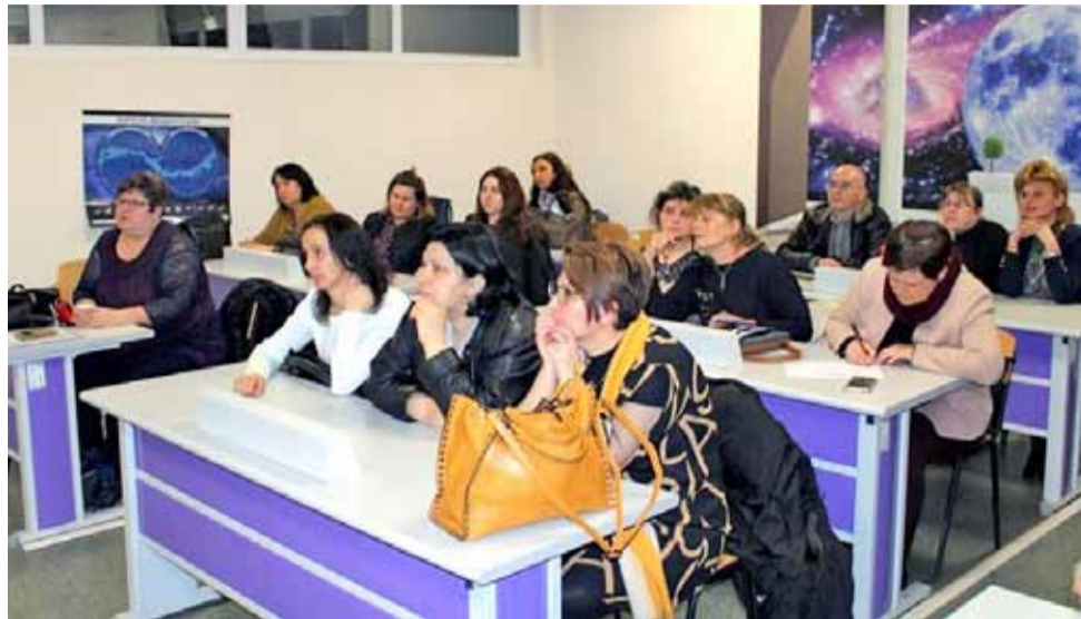
По време на работната среща, преподавателите от двете учебни заведения изслушаха интересни лекции

В края на срещата двете страни единодушно стигнаха до заключението, че изключително важно за училищата е да работят в мрежа, да уеднаквят изискванията си, както и да бъдат иновативни, за да отговорят на реалните потребности на своите ученици.