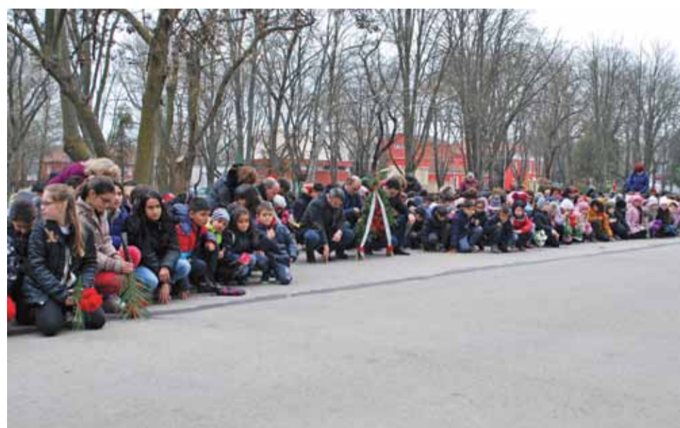
Десетки жители и гости на града се поклониха пред паметника на Васил Левски в знак на признателност.