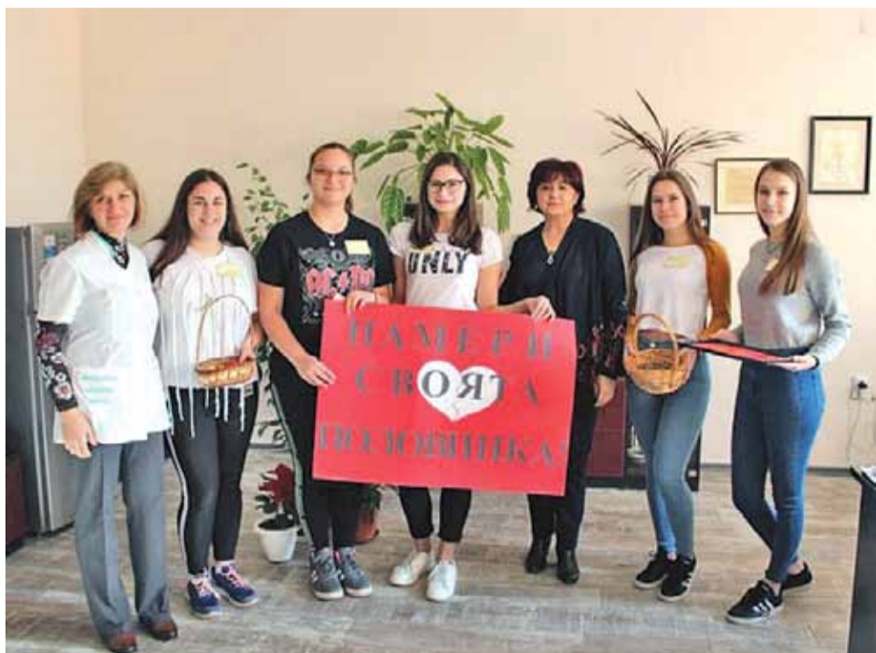
Клуб „Здраве“ към Иновативна професионална гимназия по земеделие „Тодор Рачински“ организира събитие по случай празника на влюбените – Свети Валентин: „Намери своята половинка“. Участниците в клуба изготвиха и раздадоха на учениците червени и сини валентинки с номерца, с надеждата да намерят своята половинка. Учителите също получиха поздрав от Клуб „Здраве“.

Какво ви коства лично на вас толкова много работа в залата? А, какво