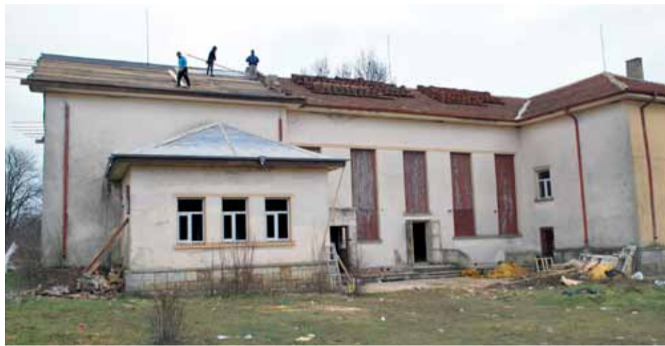
Ремонтните дейности на сградите на двете читалища вървят с усилени темпове.

сгради. По този начин ще бъде удължен живота на културните институции, а това ще подпомогне устойчивото социално-икономическо развитие на трансграничния регион. В двете най-многолюдни села от нашата община Кардам и Спасово пък ще могат да продължават да съхраняват и популяризират културното наследство на Добруджа, както и да насърчават младите хора да се включват и участват дейно в организирания прояви.