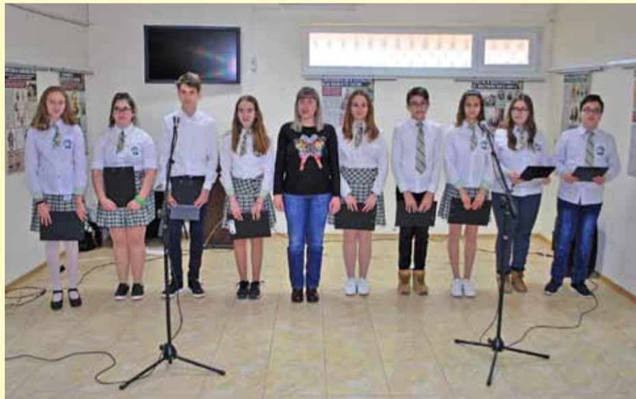
Деца от ОУ „Хр. Смирненски“ изнесоха невероятен рецитал малко преди официалното откриване на гостуващата изложба.

Откриването на изложбата беше предшествано от великолепия рецитал „Помним те и днес, Апостоле“ на учениците от 7 „б“ клас на ИОУ „Христо Смирненски“ с ръководител Крассимира Тодорова.