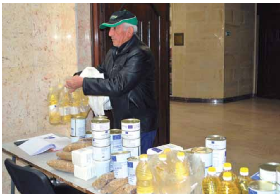
Хранителните пакети със сигурност ще бъдат от голяма полза на хората, които ги получиха.

еднократна помощ за ученици в първи клас, лица с трайни увреждания и семейства, получили еднократни или месечни помощи, предназначени за превенция и реинтеграция, отглеждане на дете при близки и роднини и др.