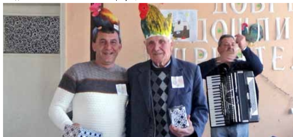
Хората в село Чернооково си спретнаха чудесен празник на Петльовден.