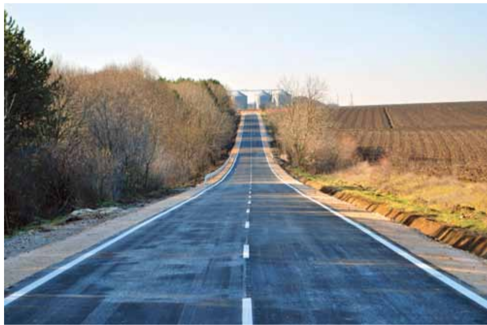
Ето по такъв път е истинско удоволствие на шофиращ.

Екипите на двете страни обсъдиха възможностите за реализация на бъдещи съвместни културни събития и работа по оперативни програми. Проведе се и ползотворен разговор за заложените в проектното предложение инфраструктурни дейности. Главните такива са три: основен ремонт на Народно читалище „Дора Габе – 1940“ в село Дъбовик, обновяване на околното пространство на Културен дом в град Мурфатлар и възстановяване на паметник на архитектурата – летен павилион „Малевински“ в град Болгард.