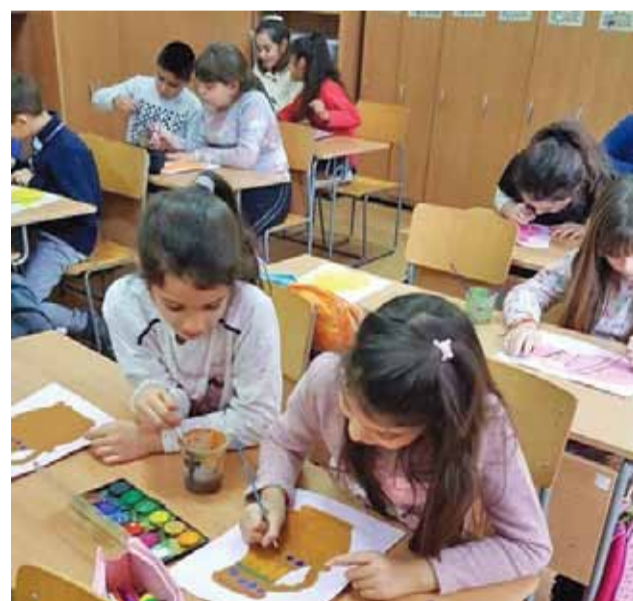
Децата декорират стомните си по свой вкус и идеи.