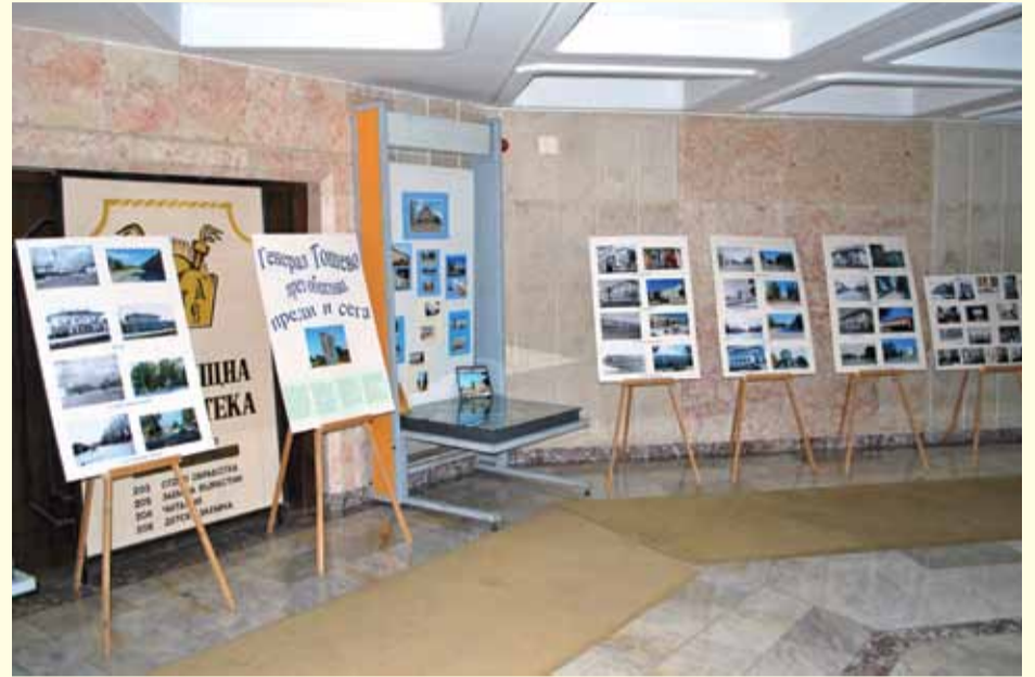
Изложбата може да бъде разгледана на втория етаж в сградата на Община Генерал Тошево.

та в града и улицата, водеща към нея – „Г. Раковски“, бившият ресторант „Ален Мак“ и хотелът, читалището, автогарата, училищата и няколко жилищни блока.