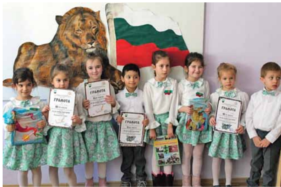
Децата от детските градини също се справиха страхотно.