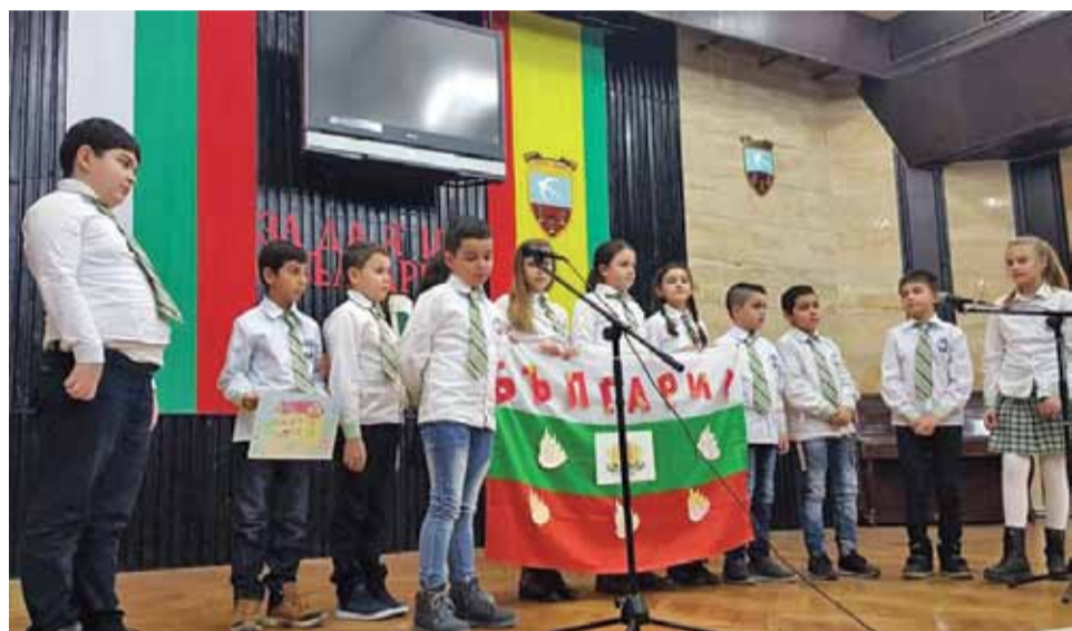
По-големите ученици плениха публиката и жури с прекрасни рецитации.

В края на месец февруари всички наградени с първо, второ и трето място, ще имат възможността да участват в областния кръг на конкурса „За да я има България“ в град Добрич.