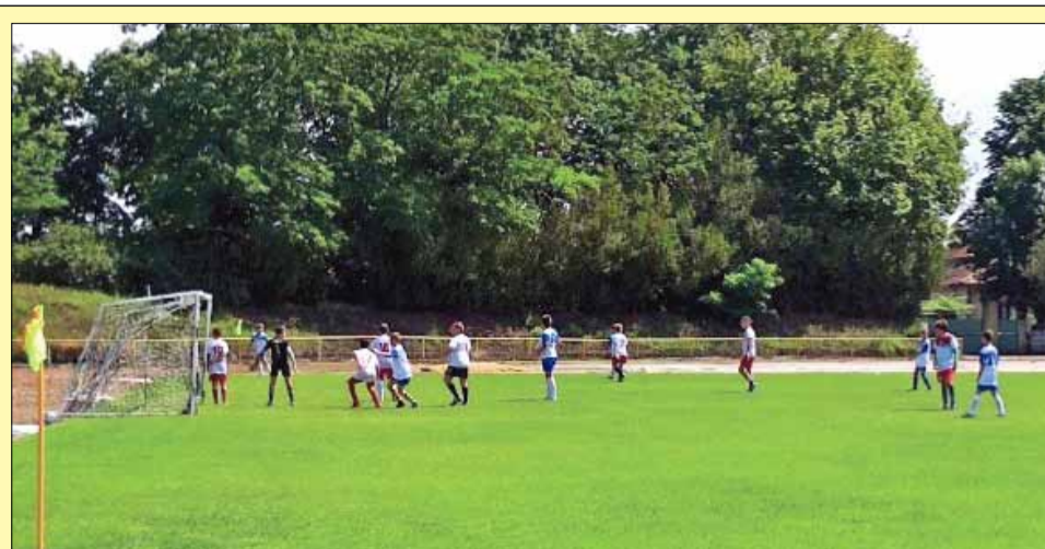
Децата изгаряха от желание да демонстрират своите способности и да се докажат в приятелската среща.

Добруджа Йордан Йовков. След това те започнаха да творят и да пресъздават с четка в ръка по един великолепен и неповторим начин своите виждания за това магнетично място, из-