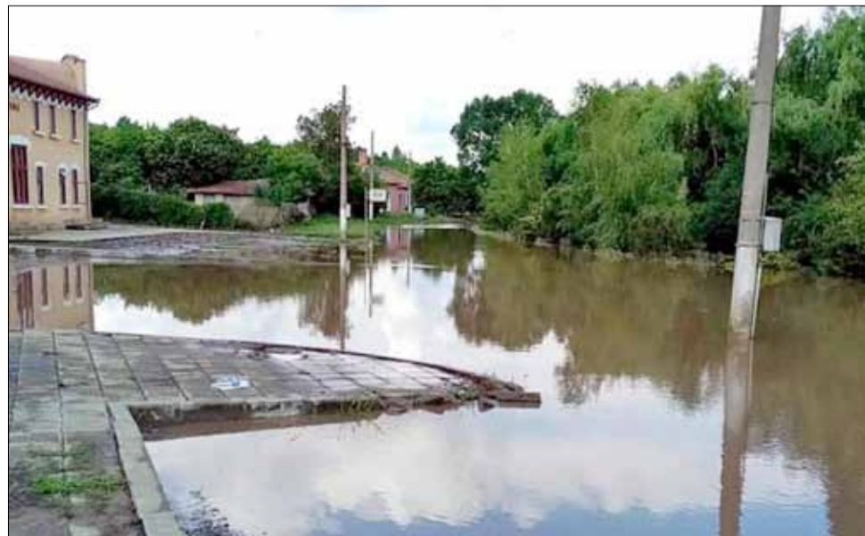
В ниските части на село Красен пороят буквално заля улиците и наводни градините на хората.

ти по почистването на пътя. Ще се чистят и деретата, които по принцип се обработват превантивно и се продълбочават наносите. Всяка година общината заделя и средства за поддръжка на проблемните участъци от деретата.