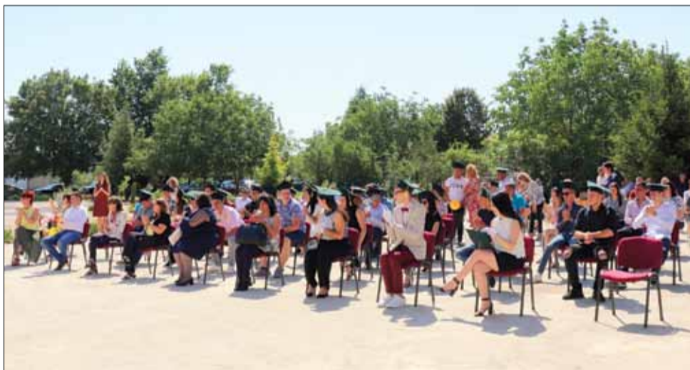
Випуск 2020 на ПГ по земеделие „Тодор Рачински“

Празничната атмосфера беше допълнена от музикално танцови изпълнения и много споделени мигове на радост.