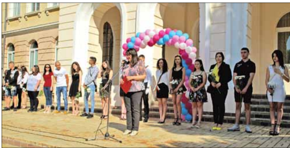
Юбилейният 65-ти Випуск 2020 на СУ „Никола Й. Вапцаров“.