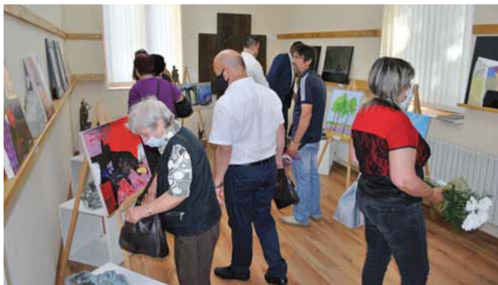
Още при откриването си, изложбата на картини от пленера по живопис, събуди огромен интерес сред гражданите.

създадоха истински шедеври на своите платна. През първите два дни от пленера участниците разгледаха село Красен и неговите околности. Впечатлени бяха от музейната сбирка и старото училище в селото, в което е преподавал Певецът на