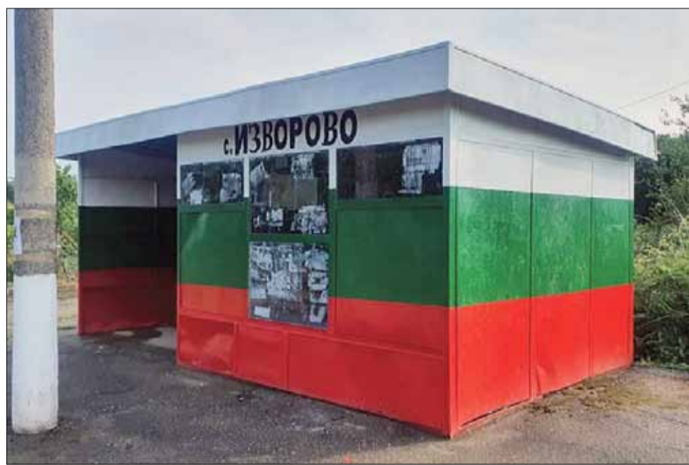
Преди време кметството на село Изворово предприе интересна инициатива. Всички спирки по главния път бяха старателно боядисани с цветовете на родния трибагреник – бяло, зелено и червено. Свежото решение се хареса на всички, а преминаващите често спират за снимки.

Тържеството завърши с емблематичната за всички абитуриенти песен: „Един неразделен клас“!