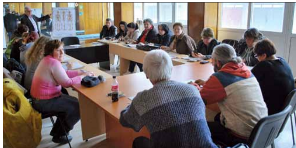
Момент от предходещото обучение за болногледач, организирано по проекта.