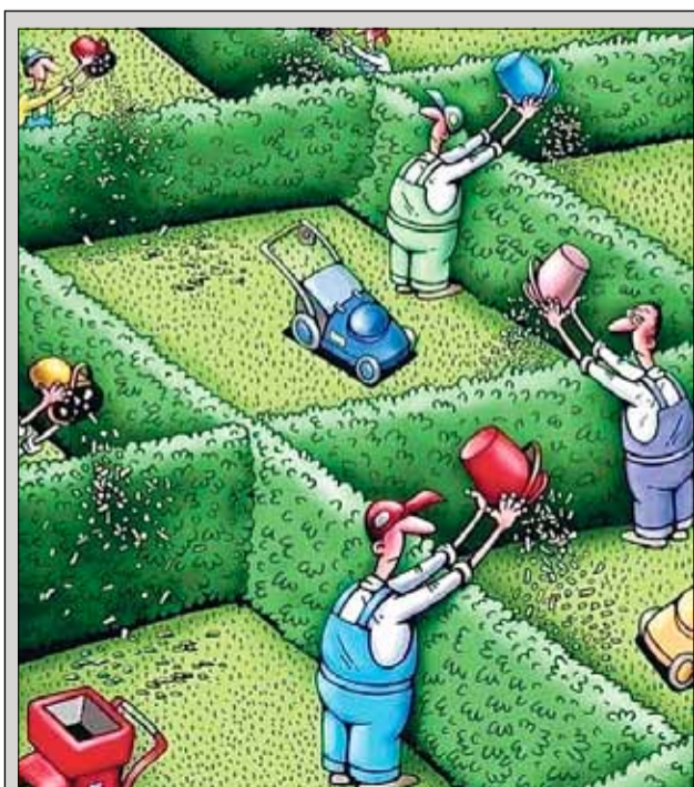
Така правим тук в България...