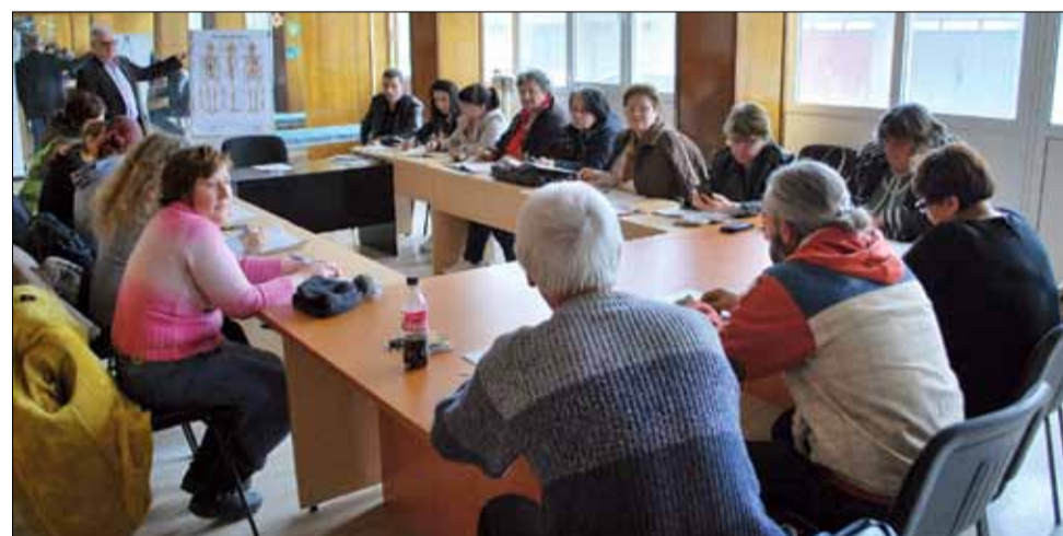
Момент от предходещото обучение за болногледач, организирано по проекта.