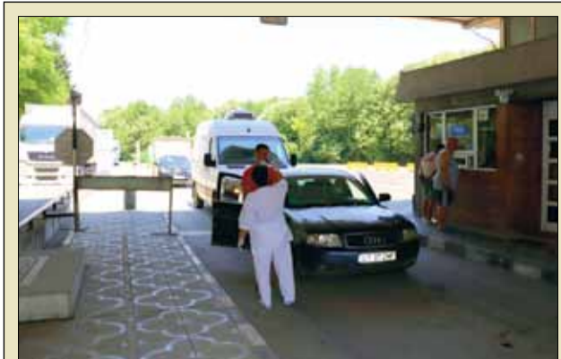
След отваряне на ГКПП – Иовнов всички граждани, влизащи на територията на Република България преминават през първичен здравен преглед и попълват декларация за общо здравословно