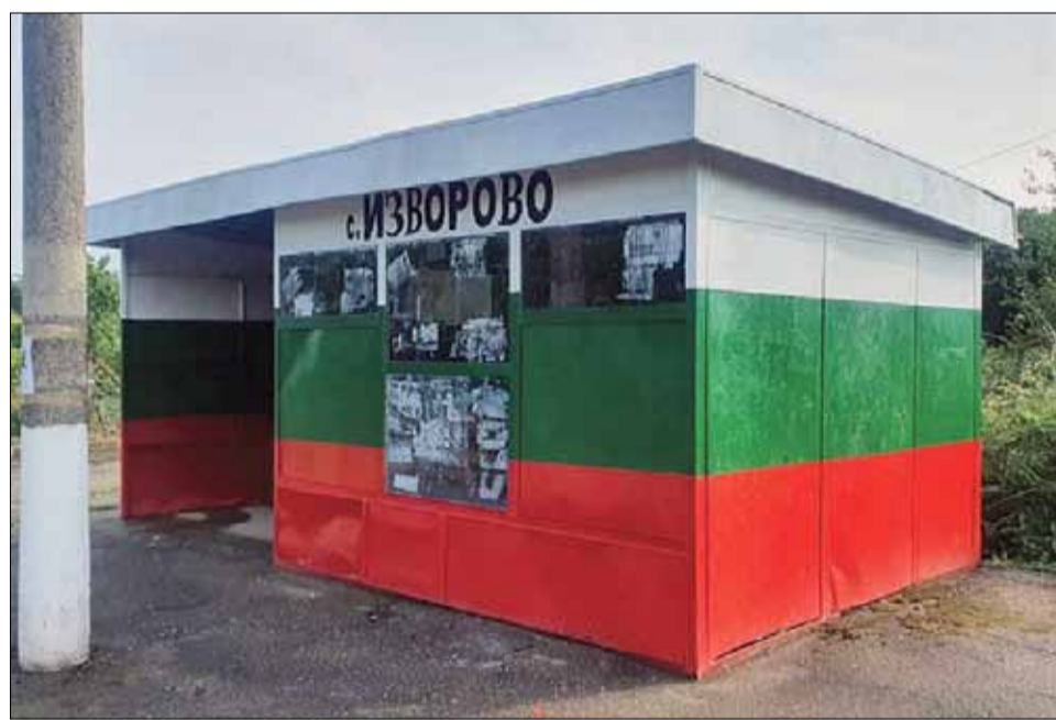
Преди време кметството на село Изворово предприе интересна инициатива. Всички спирки по главния път бяха старателно боядисани с цветовете на родния трибагреник – бяло, зелено и червено. Свежото решение се хареса на всички, а преминаващите често спират за снимки.

Тържеството завърши с емблематичната за всички абитуриенти песен: „Един неразделен клас“!