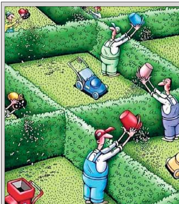
Така правим тук в България...