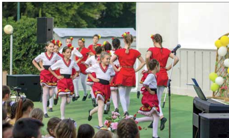
Въпреки горещото време концертът на децата в лятното кино привлече интереса на жителите на общината.

Всички деца от 5 до 18 годишна възраст могат да се запишат в школата за всяка една от формите на обучение, според собствените си възможности, интереси и желания.