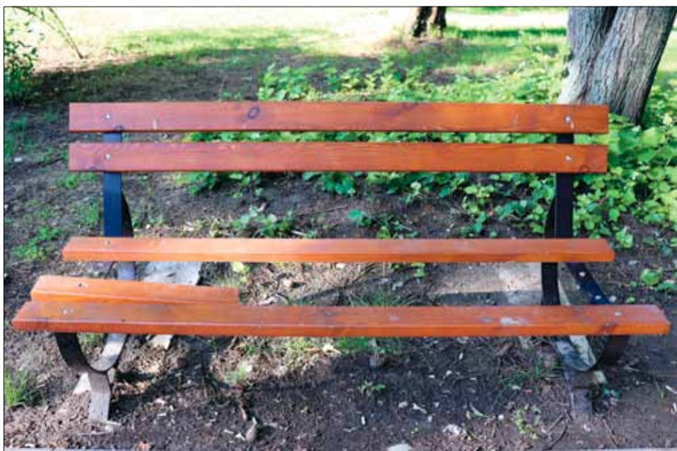
За съжаление вече ни стана навик да ви показваме вандалските прояви на местните „герои“. Този път снимката е на поредната счупена пейка в парк „Бойна слава“. Видно и съвсем ясно е, че това действие е съвсем умишлено. Всички ние продължаваме да не разбираме подобни деяния и отово задаваме въпроса ЗАЩО?