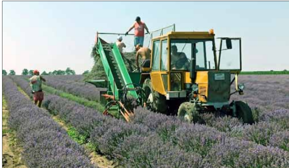
Жътвата на лавандула започна с ентузиазъм, но първите резултати на добитите количества масло охладиха страстите.

Кандидати по схемата могат да бъдат земеделски стопани, регистрирани по реда на Наредба № 3 от 29 януари 1999 година за период от най-малко 3 години назад, считано от датата на кандидатстване, както и организации и групи производители, признати със запознел на министъра на земеделието, храните и горите. Указанията за прилагане на схемата за държавната помощ и документите към нея са публикувани на интернет страницата на ДФ „Земеделие“.