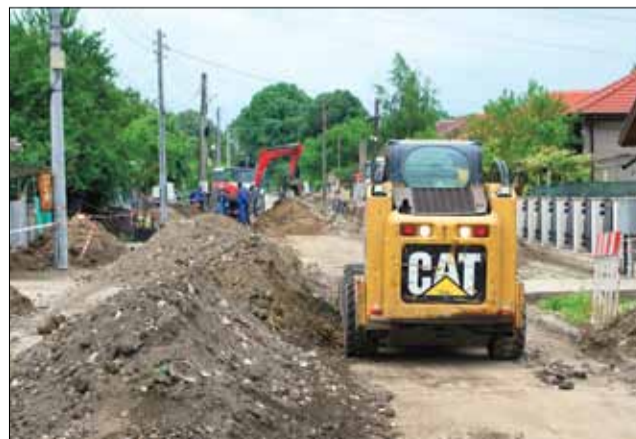
Ул. „Васил Алексиев“ в началото на строителните дейности.

След направена консултация със специалисти и във