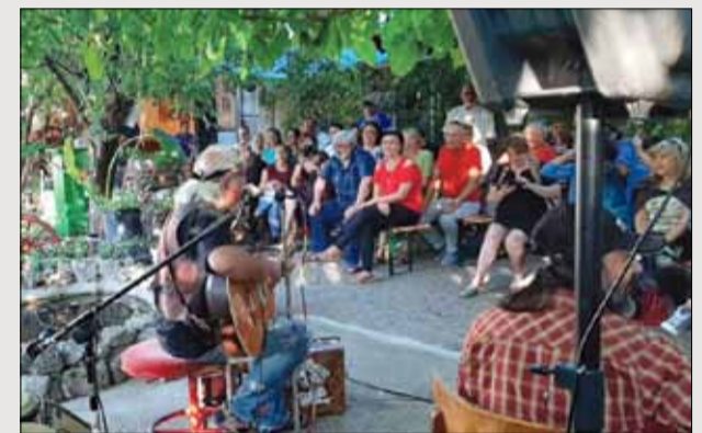
Васко Кръпката направи незабравимо музикално шоу в село Пчеларово.

Затова остават във времето и звучат винаги актуално – защото има какво да кажат и знаят как да го направят. Всеки, който има уши може да слуша, но само, който има душа може да чува, защото мястото на тази музика е там, където тя се чува най-силно – ехти, докосва те и те