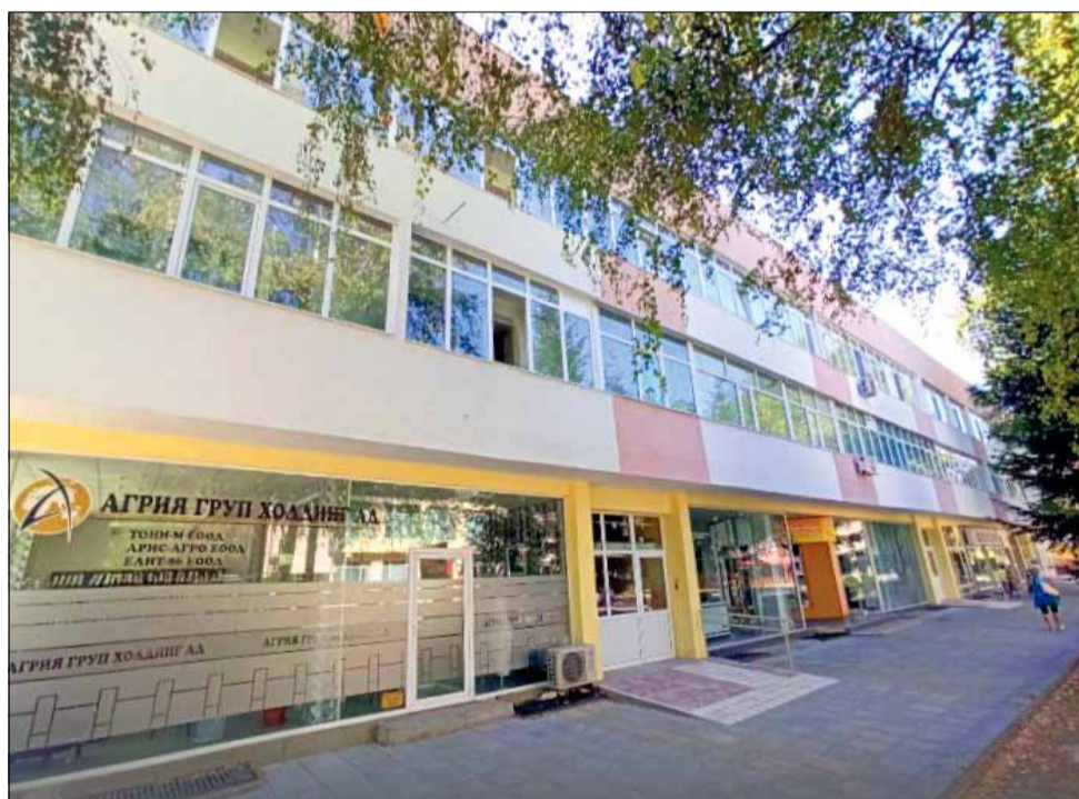
Санитарните сгради придават на града още по-хубав и приветлив тип.

Общата стойност на договорите по двата проекта е в размер на 2 424 363, 44 лв.