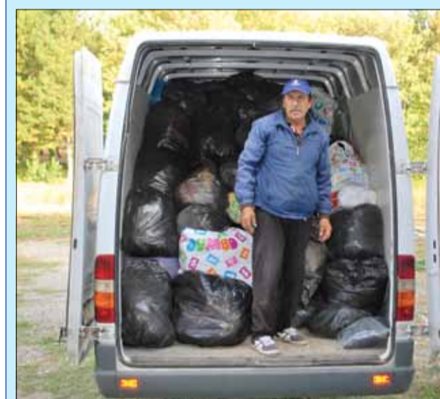
Товарният микробус едва побра всички торби с дрехи за рециклиране.

продукти от населението. Всички събрани за рециклиране текстилни продукти от контейнера бяха извозени с общински транспорт до Варна, където бяха предадени за подпомагане на кризисния резерв на БЧК за пострадали при бедствия и аварии, които извършва целево дарение на дрехи на хора в нужда. Преди