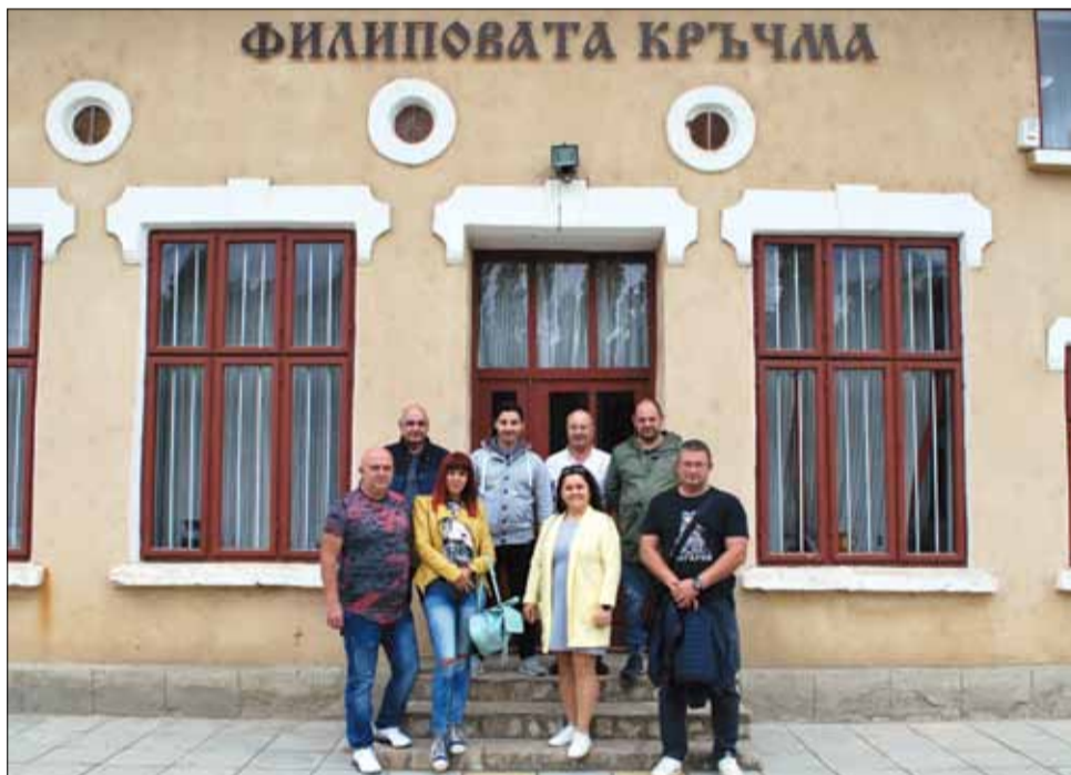
Това са участниците в третото издание на фотопленера.

да ги вдъхнови да претворяват в багри красотата във всички нейни форми и проявления. Изложбата на фотосите ще бъде открита на 30 октомври в НЧ „Светлина – 1941“ в град Генерал Тошево.