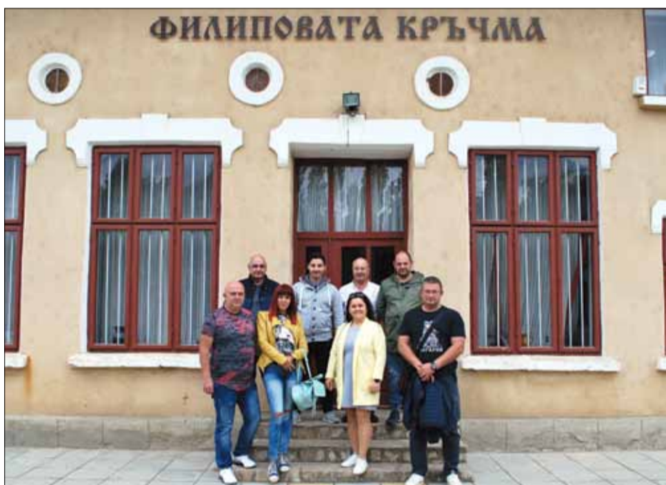
Това са участниците в третото издание на фотопленера.

да ги вдъхнови да претворяват в багри красотата във всички нейни форми и проявления. Изложбата на фотосите ще бъде открита на 30 октомври в НЧ „Светлина – 1941“ в град Генерал Тошево.