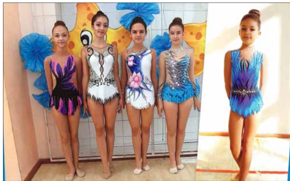
Това са нашите златни момчета в художествената гимнастика.