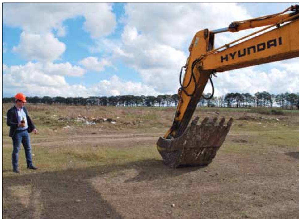
Със счупена бутилка шампанско в специализираната тежка машина, беше дадено началото на дейностите по проекта.