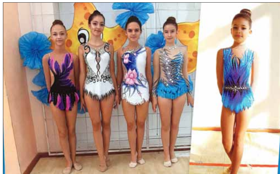
Това са нашите златни момчета в художествената гимнастика.