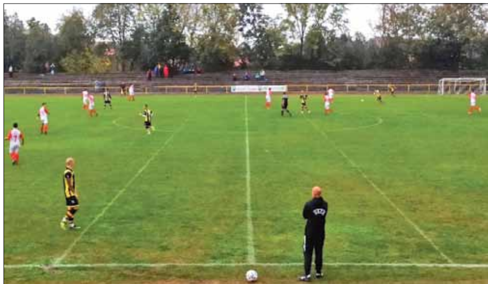
В този двубой отборът на „Спортист – 2011“ (Генерал Тошево) беше пределно амбициран и напълно заслужено грабна трите точки.

Лидер в групата е отборът на „Позенец – 2015“ (Позенец), следван от тимове на „Рилци“ (Добрич) и „Хр. Ботев“ (Стожер), а до края на есенния полусезон остават три кръга.