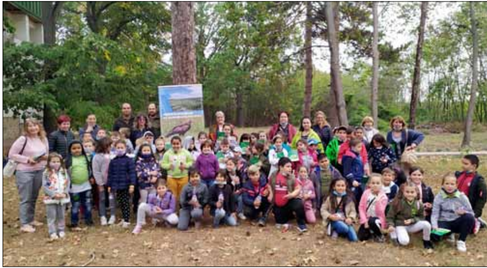
Децата проявиха сериозен интерес към темите от открития урок по горска педагогика.

Урокът по Горска педагогика и книжката „Приказки от гнездото“ се осъществяват благодарение на Проекта „Мерки за опазване на малкия креслив орел и неговите местообитания в България“, който е към програмата LIFE на ЕС. Страни в проекта са ИАГ, БДЗП, СИДП и ЮИДП, а целта му е да бъдат създадени нови местообитания за малкия креслив орел, да бъде опазен вида и да бъде съхранено биологичното разнообразие на горите в България.