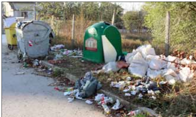
Това определено не е нормална гледка и не трябва да се вижда по улиците на който и да е град. Но истината е, че това е тъжната действителност. Разпилян боклук точно до... контейнерите за боклук. Ако ние самите нямаме личната отговорност да живеем в чиста и приветлива среда, то тогава не можем да бъдем сърдити на никой!

Запознавайки туристите и местните общности в редица страни с уникалните, редки или трудни за откриване сирена, заедно със заповедите им „истории“, проектът ще създаде и популяризира мита за „Балканските сирена“, който датира още от древността.