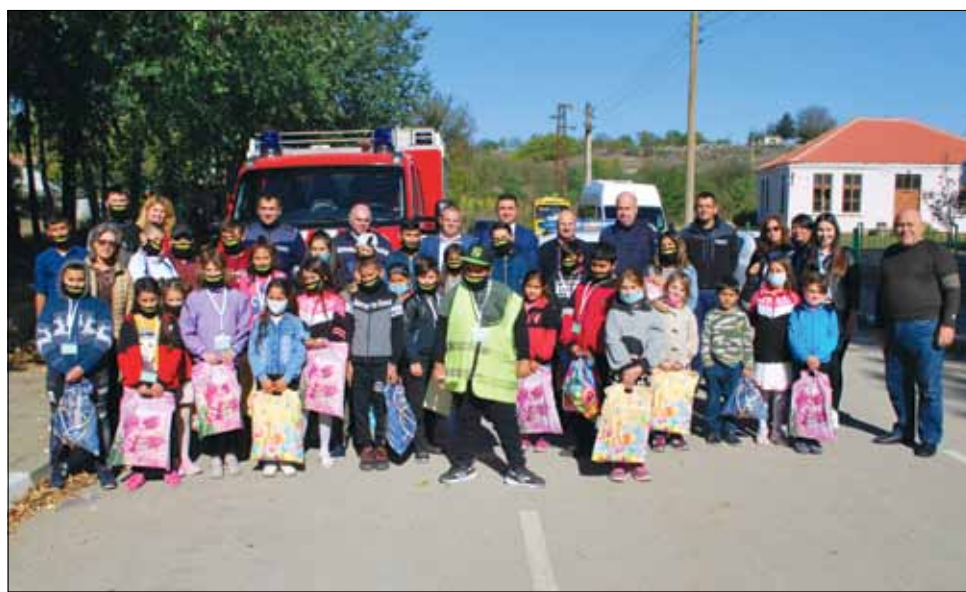
Детско полицейско управление при ОУ „Йордан Йовков“ – село Красен.

По време на официалното събитие учениците, участници в програмата получиха много подаръци, но по-интересното за тях беше, че имаха възможността да се докоснат до тайните на специализираните автомобили на МВР. Разгледаха отвътре полицейската кола, след което се включиха в демонстрацията по за потушаване на пожар.