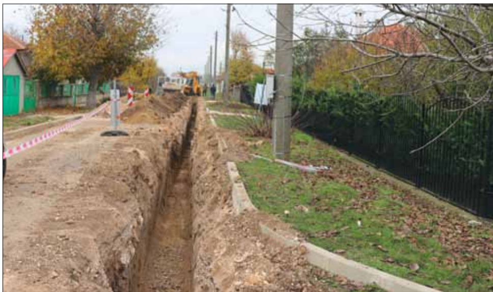
Ул. „Единадесета“ в село Люляково в началото на строителните дейности

В началото на миналата седмица започна изпълнението на проект „Рехабилитация на част от водопроводната мрежа на с. Спасово, с. Кардам и с. Люляково, Община Генерал Тошево“ по Програма за развитие на селските райони