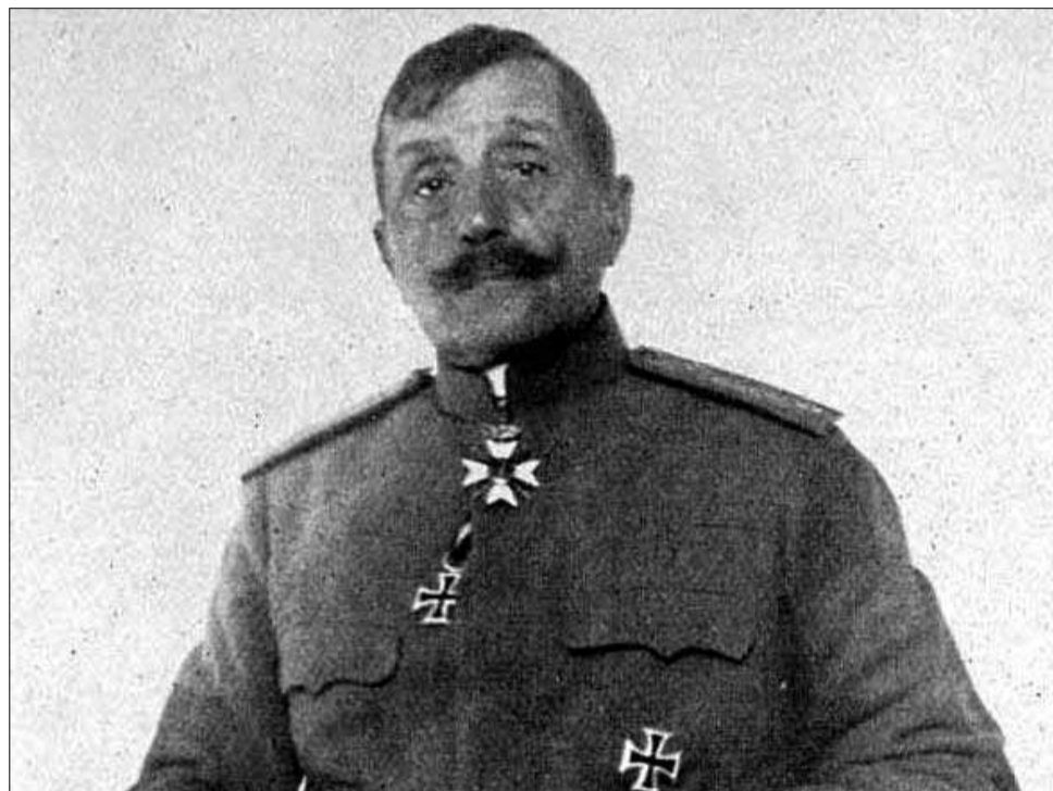
Генерал Стефан Тошев

Негови са и думите: „Защото историята се повтаря и победения народ, преминал през етапа на нещастията, всякога има повече шансове за повдигане, отколкото победителя, стига градещето да се зида върху опитите от горчивото минало.“