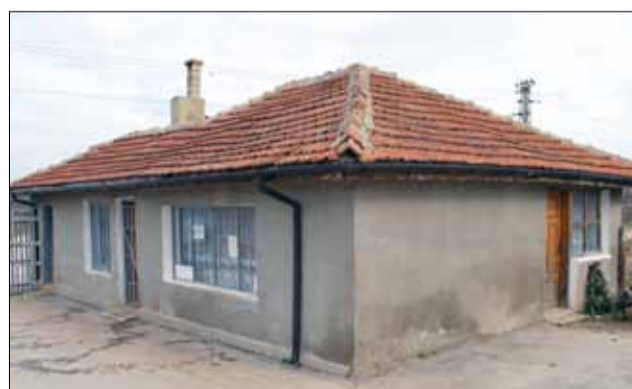
Тази сграда на входа на гробищния парк ще бъде съборена, а на нейно място ще бъде изграден нов траурен дом.

Проектът стартира официално през 1998 година и за този период Община Генерал Тошево реализира договори за финансиране надхвърлящи един милион и половина лева.