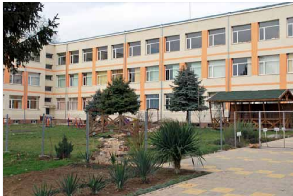
ОУ „Христо Смирненски“ продължава да работи усилено по реализирането на различни проекти.

да в училище, осигуряваща комфорт и удобство за всички ученици.