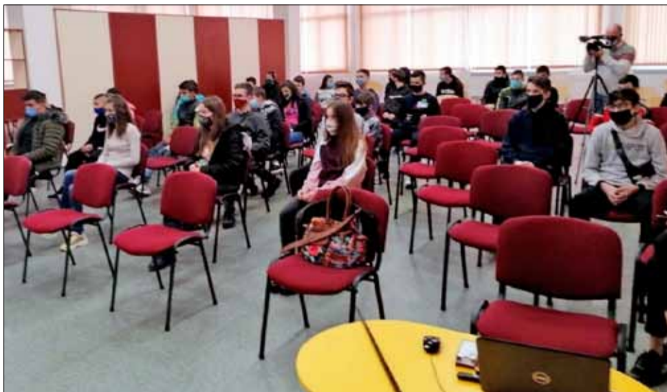
Лекциите за онлайн тормоза определено заинтеригуваха учениците.

Решението на Окръжен съд – Добрич наказание не подлежи на обжалване.