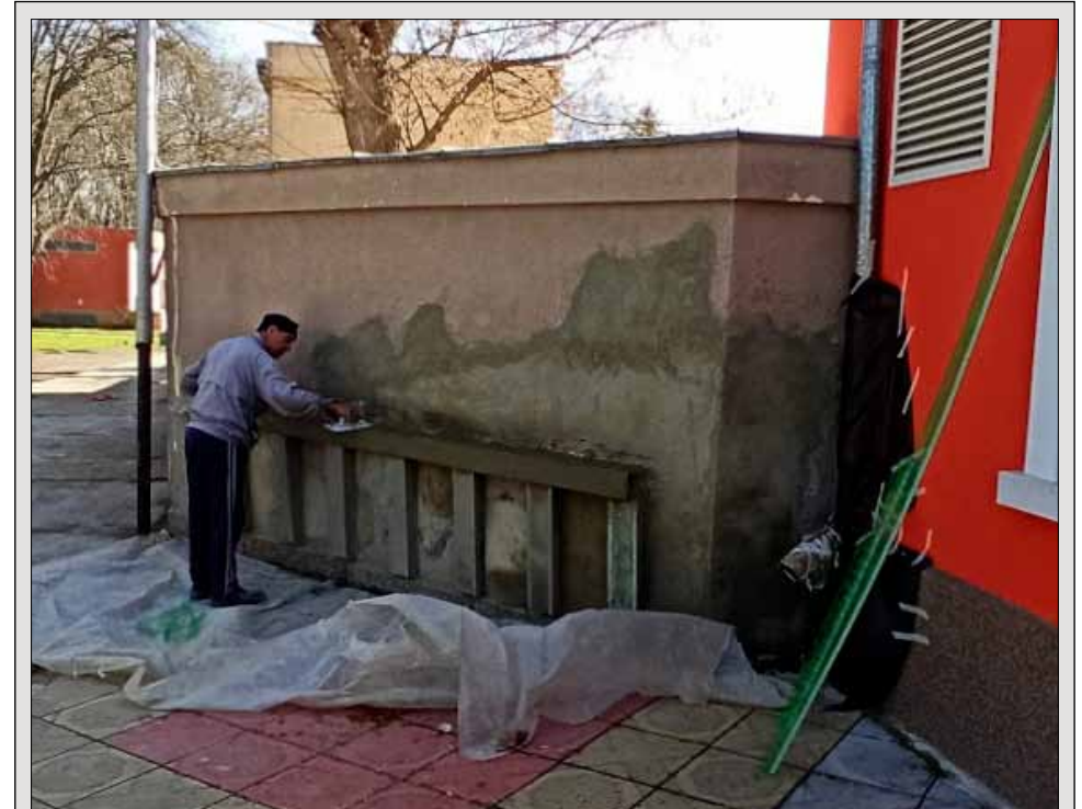
През последната седмица строителни работници извършваха ремонтни дейности по фасадата на лятното кино откъм парка в града. Лицевата част на съоръжението беше силно компрометирана, като на места големи части от мазилката липсваха. Строителните работници извършиха шпакловка и замазка, както и други дребни ремонтни дейности. В близките дни отремонтираната част от фасадата ще бъде изцяло боядисана.