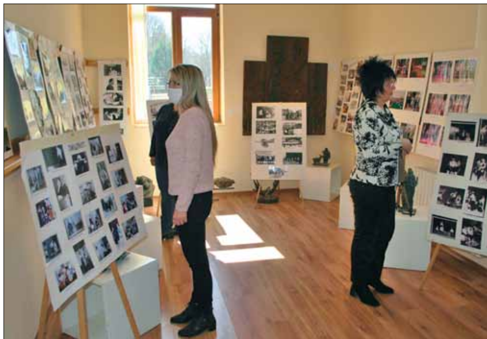
Изложбата в културната институция може да бъде разгледана от всеки при спазване на противоепидемичните мерки.