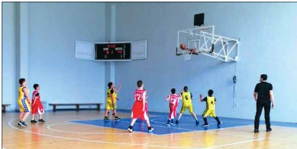
Малките баскетболисти на „Спортбаскет ГТ“ в действие.

Следващите двубои в град Генерал Тошево ще се проведат на 18 април в две възрастови групи – момчета до 14 години (3 срещи) и юноши до 19 години (3 срещи).