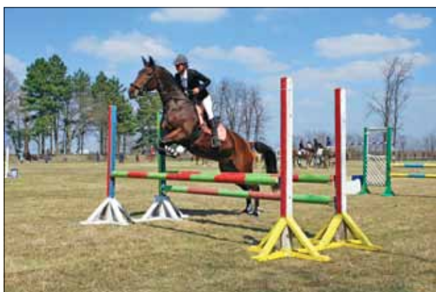
Любителите на конния спорт ще могат да се насладят на поредното силно състезание по прескачане на препятствия.

На 22 май (събота) от 10:30 часа на тренировъчното игрище (старият стадион в град Генерал Тошево), ще се проведе турнир по прескачане на препятствия, във връзка с отбелязването на 90-годишнината от създаването на конния спорт в общината. В програмата на състезателния ден са заложени три дисциплини - прескачане на препятствия до 90 см. - за млади коне, любители и деца,