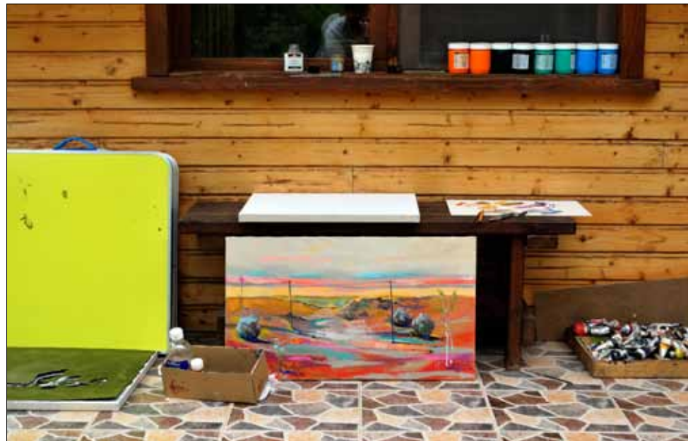
И през тази година пленерът по живопис „Бялата лястовица“ ще се проведе в село Красен.