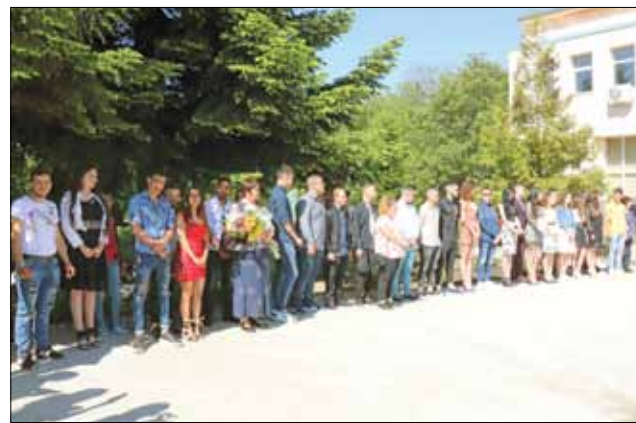
Випуск 2021 на ПГ по земеделие „Тодор Рачински“

бравими мигове и емоции от ученическите години, Випуск 2021 си взе „Довиждане“ с учителите и училището. Красиви, различни, чаровни и неподправени, усмихнатите абитуриенти, загледи в бъдещето със замечтани очи, със сигурност ще помнят с носталгия този ден на раздяла с родното училище, най-добрите учители и първите истински приятели. До тях пък, родителите едва сдържаха сълзите си - хем от радост, хем от мъничко тъга, че изпращат своите деца по неутъпканите пътеки на живота.