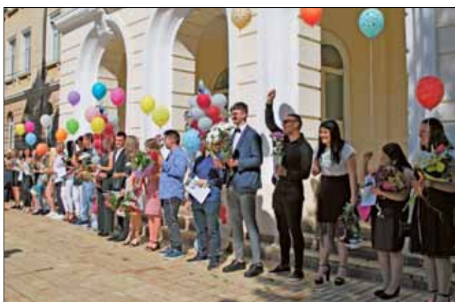
Випуск 2021 на СУ „Никола Й. Вапцаров“